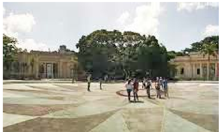
El evento permite el acceso gratuito al público en general

Para los interesados el formulario de inscripción lo podrán encontrar en el siguiente enlace https://forms.gle/H5PD34mqkf1H9VdSA . Una vez formalizado este proceso se les indicará los pasos a seguir para acceder al encuentro di-