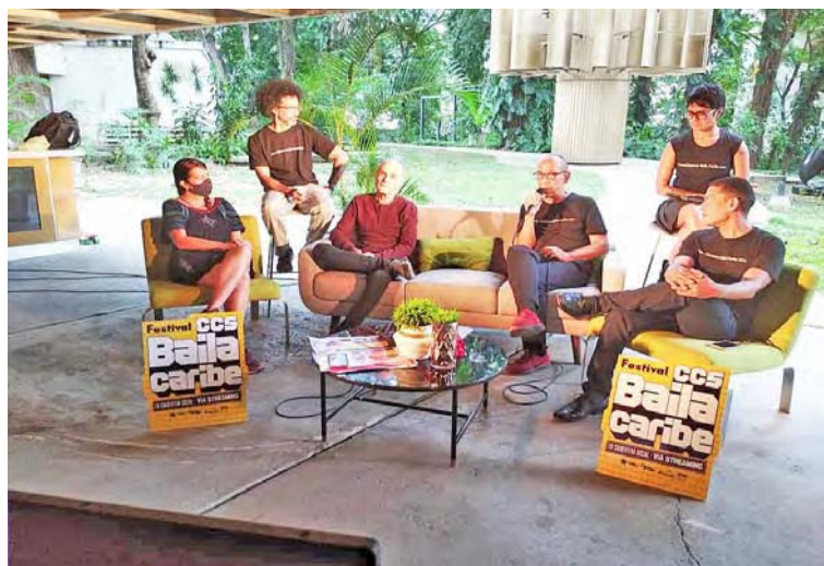
Cada número estará dedicado a un maestro venezolano del arte del movimiento corporal