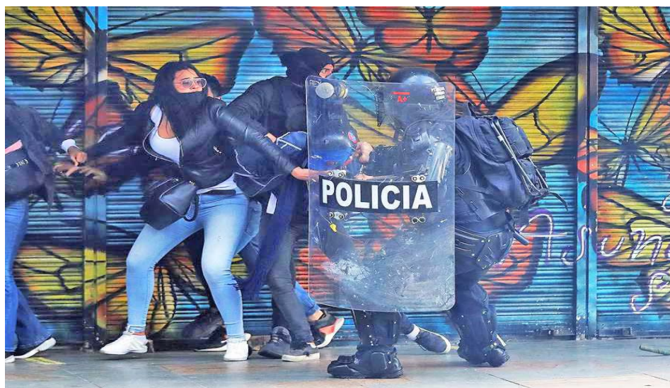
El fallo, prohíbe a los agentes policiales utilizar escopetas calibre 12 en manifestaciones