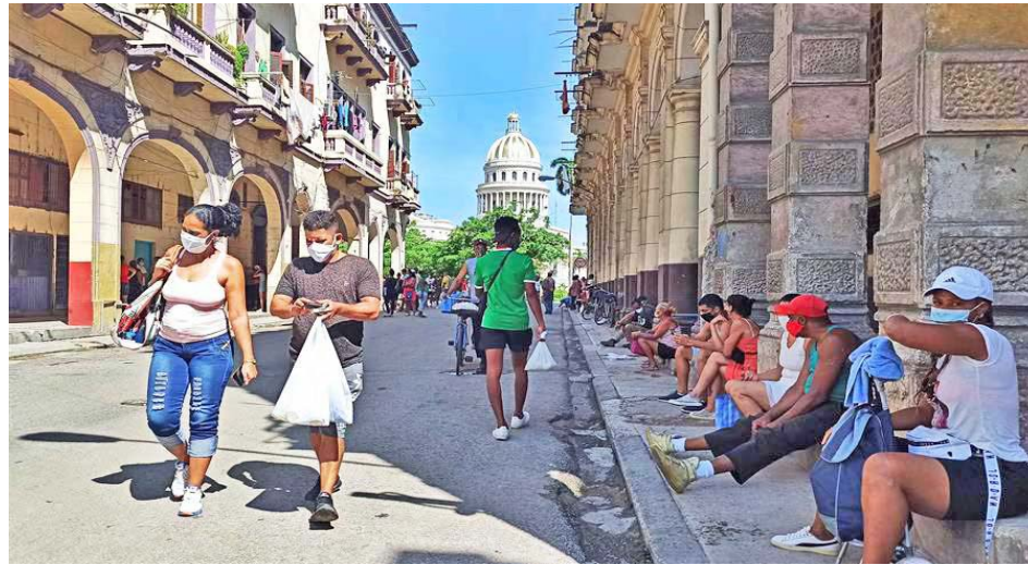
Donald Trump anunció que pretende restringir aún más las importaciones de productos cubanos

T/ Redacción CO-agencias RT-HispanTV