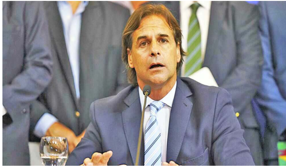
No era obligatorio elegir a alcaldes y concejales

La calle Pou anunció que hablará con todos los intendentes electos en los próximos días y después con el Congreso de Intendentes. También informó que la llegada de uruguayos del exterior para votar era “bajísima”.