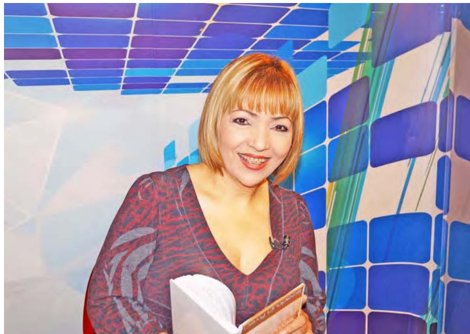
Oropeza está residiendo en Los Teques, estado Miranda

La escritora cuenta la historia de un personaje contradictorio, que se atrevió a romper las cadenas culturales, sociales, familiares y amorosas para descubrir quién era, para ser ella misma y enfrentar la vida bajo sus términos: “Una historia que muestra los comple-