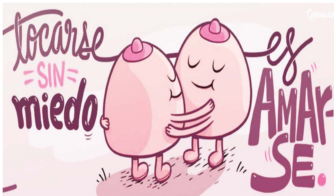
El autoexamen de las mamas es clave para superar el cáncer de seno

El cáncer de pecho es el segundo cáncer más común a escala mundial y afecta a 1,7 millones de mujeres cada año. Aunque hay herramientas para que muchas mujeres superen esta enfermedad, es preocupante que el cáncer de mama se haya convertido en la principal causa de mortalidad entre las mujeres en todo el mundo. La OMS estima que