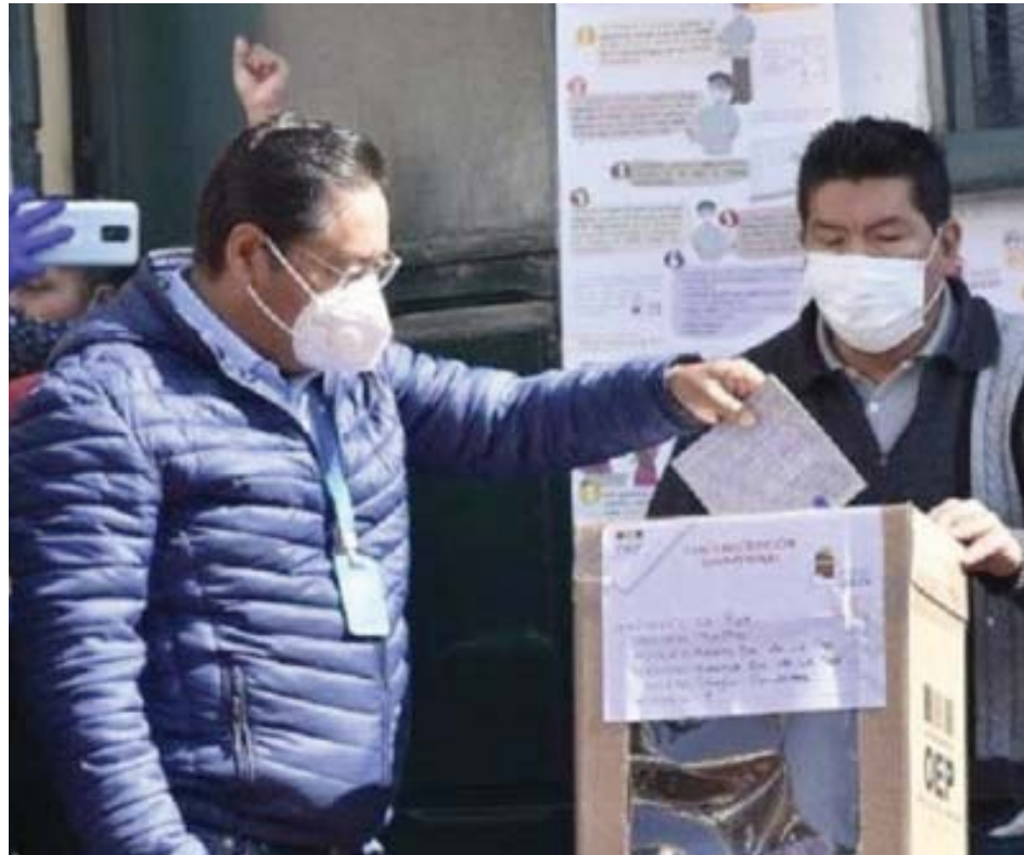
Los sondeos a boca de urna dan como ganador a Luis Arce, candidato del MAS

Al final de la tarde, tras cerrar las mesas electorales fueron divulgados los primeros sondeos a boca de urna que dan como ganador al candidato del MAS, Luis Arce, con más del 43% de los votos, frente a Mesa, que habría logrado solo el 29%. Luego de estos datos extraoficiales,