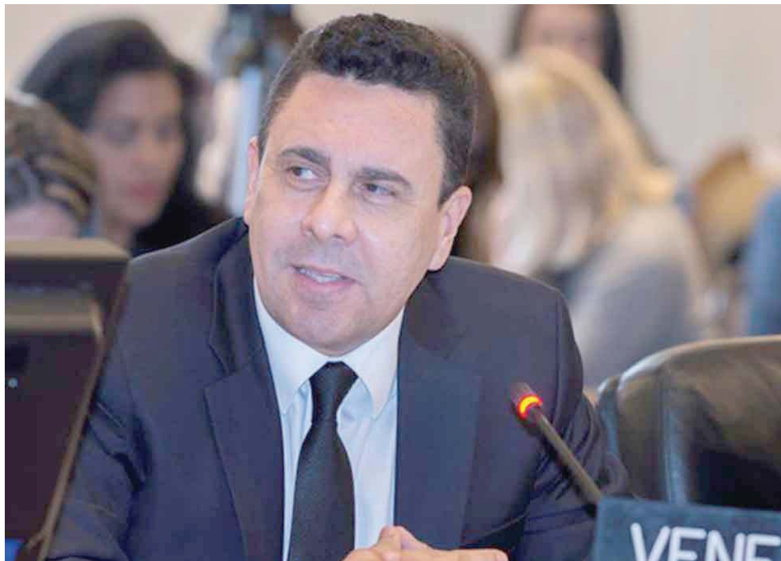
El próximo paso de la OEA es desconocer los cinco años del período de la AN, señaló

En su opinión, la OEA se posiciona para servir a los gobiernos más racistas, violentos y corruptos del continente.