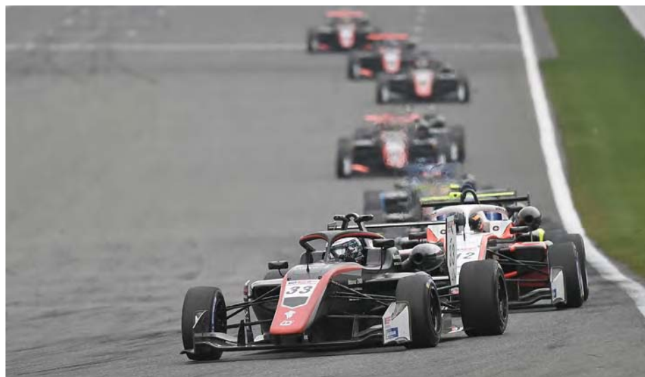
El fin de semana presentó varias pruebas exigentes

El aragüeño, ficha del Team Motopark (equipo campeón del año pasado), pro-