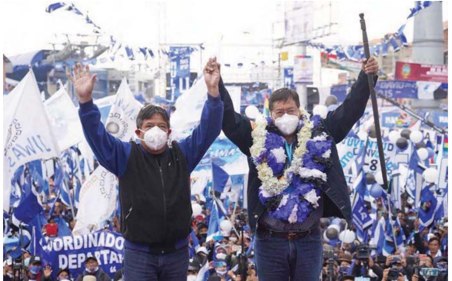
El presidente electo Luis Arce aseguró que trabajará para todos los bolivianos

“Hemos recuperado la democracia, pero sobre todo los bolivianos hemos recuperado la esperanza”, dijo el presidente electo, quien se comprometió a construir un gobierno de unidad nacional