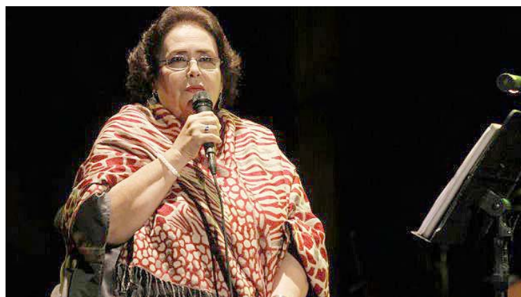
Tiene más de 16 producciones discográficas

T/ Prensa Min-Cultura