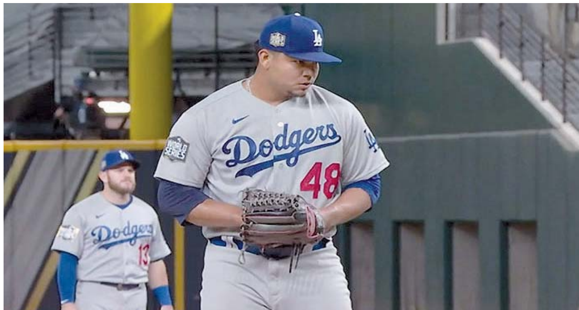
El derecho aspira a su primer anillo como campeón mundial