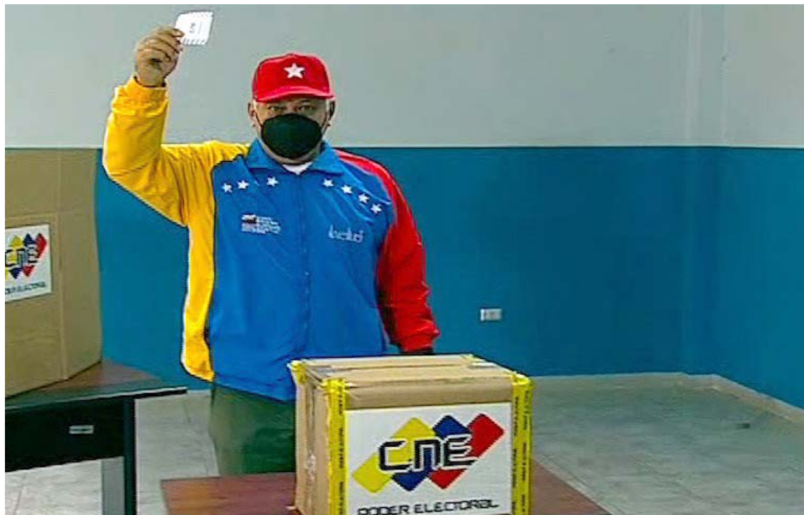
Diosdado llamó al pueblo a sufragar el 6-D

En el centro de votación ubicado en la Universidad Bolivariana de Venezuela en Maturín, estado Monagas, señaló: “Aquí no aceptamos a la OEA. No tiene que opinar sobre nada, ya que ellos están desprestigiados. Que la OEA diga ABC a nosotros nos resbala. No tenemos nada que ver con esos países afiliados con Estados Unidos. Iremos a votar este 6 de diciembre”.