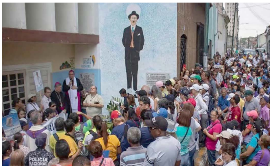
Esquina de Amadores

Cuando el presidente Hugo Chávez lanzó la Misión José Gregorio Hernández, en marzo de 2008, para atender a las personas con discapacidad, señaló que sin duda el médico trujillano formaba parte del imaginario colectivo.