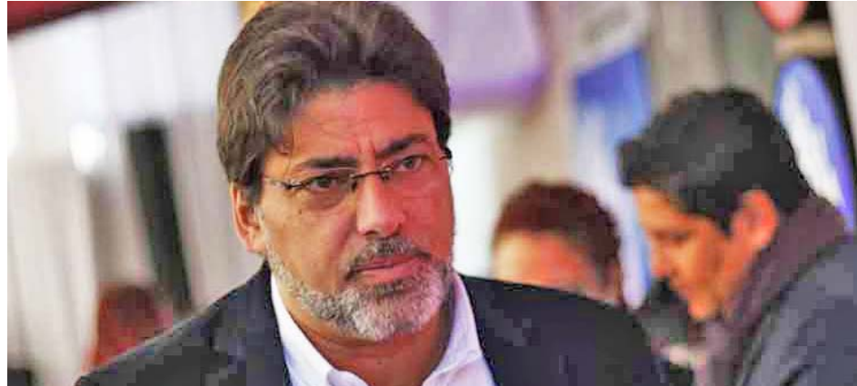
El burgomaestre comunista es una de las figuras de la oposición mejor valoradas

Consideró que este proceso constituyente era imprescindible, pues resultaba imposible salir de la dictadura militar, como lo aceptaron muchos en 1990,