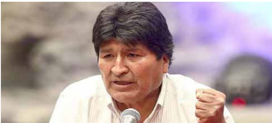
Las autoridades judiciales declararon procedente un recurso interpuesto por la defensa

T/ Actualidad RT