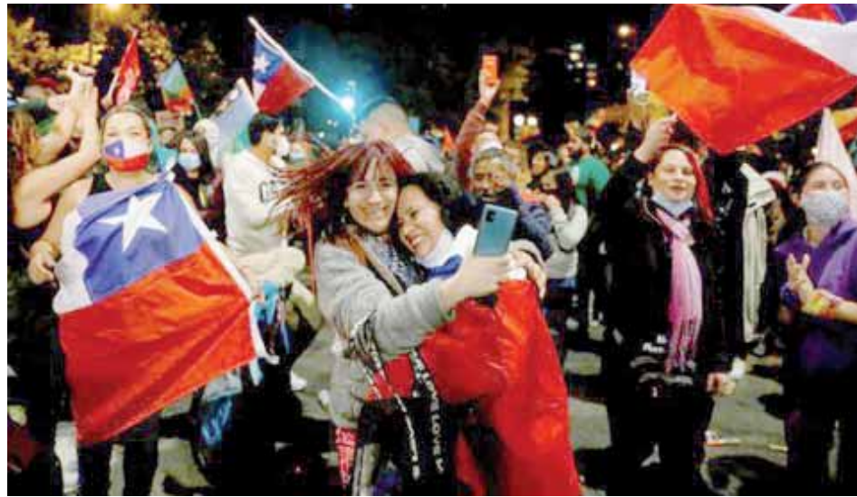
Chile hizo historia y marcó un hito con el plebiscito del pasado domingo

Al cerrarse las mesas electorales y conocerse los resultados extraoficiales