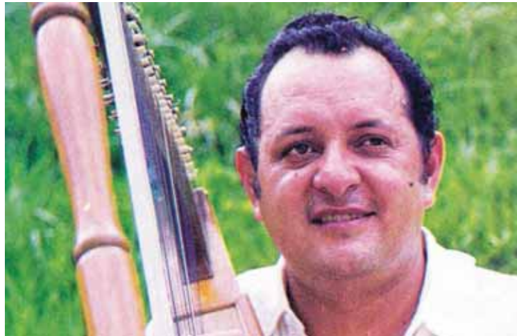
Hugo Blanco marcó historia en la música venezolana