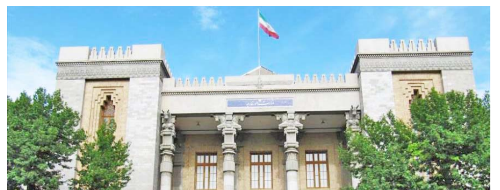
La Cancillería iraní califica de inaceptables las acciones de las autoridades francesas

T/ Redacción CO-HispanTV