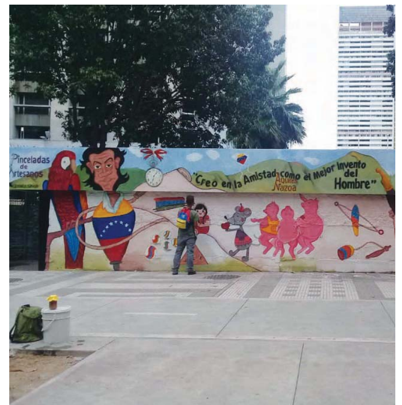
La pieza es de creación colectiva