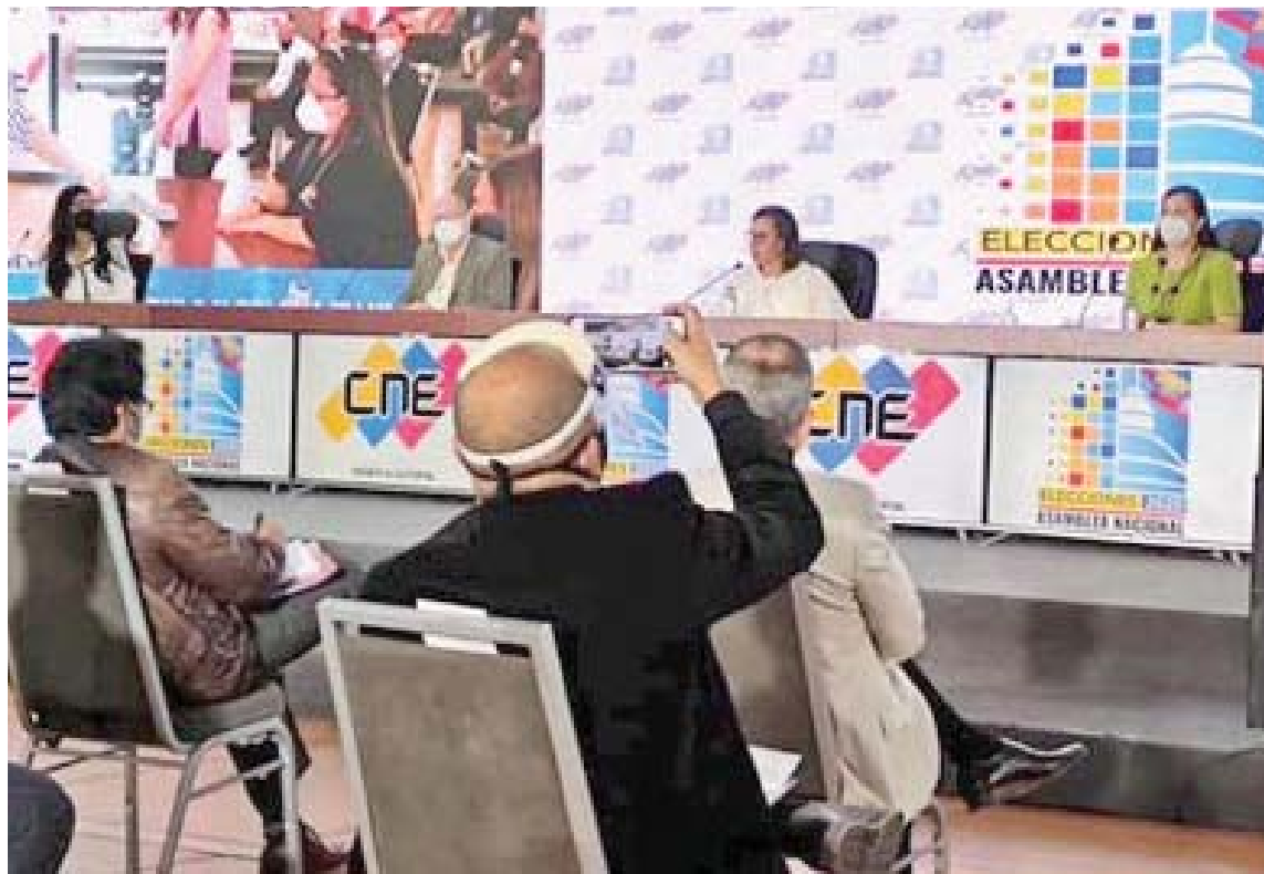
El CNE ratifica su apoyo a los partidos políticos a la campaña electoral

El máximo ente electoral evalúa la posibilidad de organizar un segundo simulacro comicial