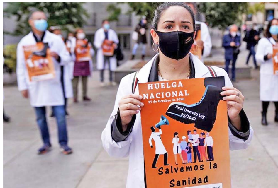
Los médicos denuncian que atraviesan años de recortes

La medida de paralización de las actividades de los médicos se repetirá todos los últimos martes de cada mes, con la finalidad de exigir la eliminación del Real Decreto Ley 29/2020, que permite, excepcionalmente durante la pandemia,