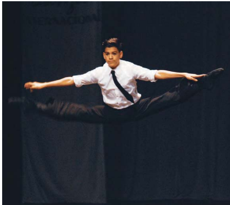
La competencia convocó a 170 artistas de diferentes lugares del mundo