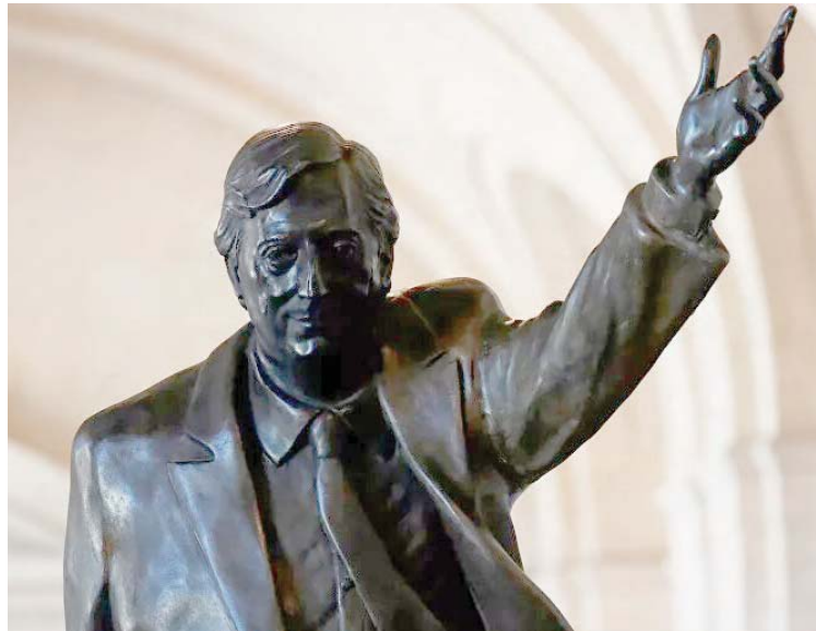
Fue develada una estatua de bronce con la efigie de Nestor Kirchner en Buenos Aires