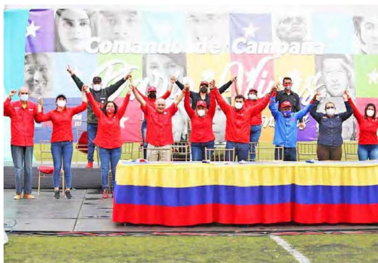
El pueblo reclama una AN que este a favor del país y sus intereses, destacó Cabello

Sostuvo que actualmente los revolucionarios están obligados a devolverle la Asamblea