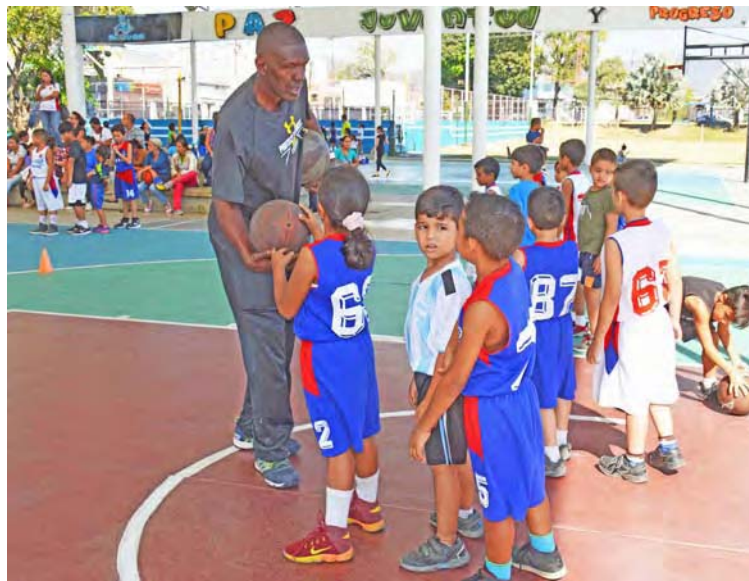
Ganó seis cetros en su carrera profesional

"A la edad de 8 años empecé con el fútbol. En Aguas Negras (estado Yaracuy). A temprana edad me vine a Valencia (estado Carabobo) en Santa Eduvigis, en Naguanagua. Después del fútbol volví a Aguas Negras. Estuve entrenando un poco de boxeo. Seguí con el fútbol, jugué un poco de beisbol también. A los 17 años entré al baloncesto. Entré tarde al baloncesto. No