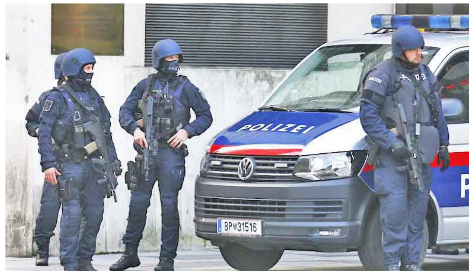
También fueron detenidos otros dos sospechosos y dos testigos del acto terrorista

Previamente los medios informaron que en Sankt Pölten, estado de Baja Austria, fueron detenidos otros dos sospechosos, mientras que un representante