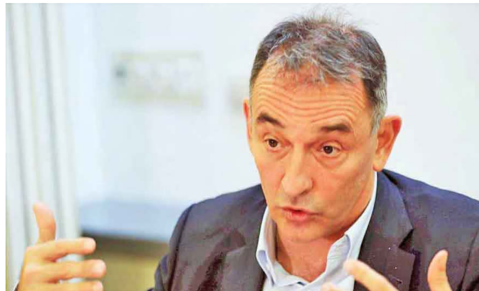
El diputado considera que no es adecuada la foto que se tomó Pedro Sánchez con Leopoldo López

Al respecto, el parlamentario dijo que “todas las elecciones de Venezuela han