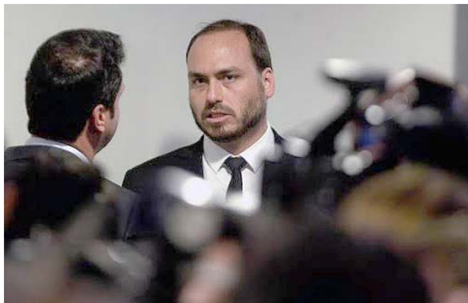
Hijo de Bolsonaro acusado de corrupción

crimen, según un testigo que trabaja como portero del centro residencial, y Elcio de Queiroz el otro detenido por el asesinato, visitó a Lessa horas antes del doble asesinato.