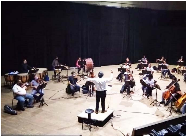
Los eventos se podrán seguir de manera gratuita vía internet

El titular de la FCNM anticipó además que la segunda actividad programada será el conversatorio: Aquiles Nazoa, el sortilegio de la música, en el que se escucharán testimonios del maestro premio Nacional