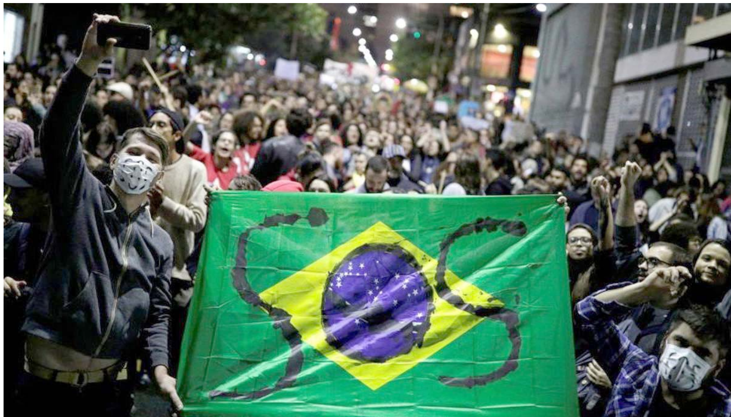
Protestas en Brasil en contra de política de Bolsonaro