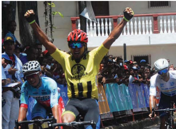
A pedalear se ha dicho este mes de noviembre

Los guaros tienen en sus plantillas corredores de jerarquía y varias jóvenes promesas. Además, en su mayoría con condiciones para rodar en el terreno plano, velocistas, excelente ca-