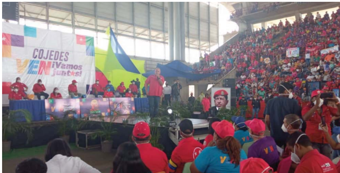
“Ante los ataques de la derecha la izquierda responde con más revolución”, resaltó Cabello

Así lo expresó Cabello durante los actos de Campaña Electoral en los estados Cojedes y Zulia de cara a las elecciones del 6 de diciembre. Allí enfatizó que al Parlamento Nacional no se va