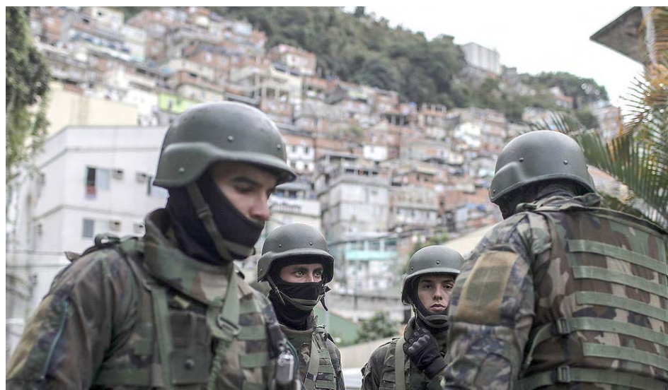
Paramilitares de Brasil toman las favelas

les del país. Son el “adversario” creado para el control de otras organizaciones criminales menos vinculadas al poder del Estado, como el famoso Comando Vermelho, la red gigante de crimen organizado que funciona a lo largo y ancho del inmenso país.