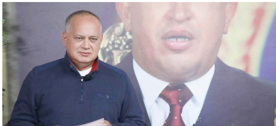
“Seguiremos luchando a pesar de los ataques”, sostuvo Cabello

La aseveración la hizo Cabello durante su programa Con el Mazo Dando, transmitido por VTV, en el que señaló que no se entiende cómo siendo Estados Unidos una potencia mundial todavía no se dispongan de los resultados de las elecciones presidenciales, y destacó que de todas maneras los 130 millones de votos emitidos por los estadounidenses de nada servirán ya que los resultados están en manos de la Corte Suprema estadounidense.