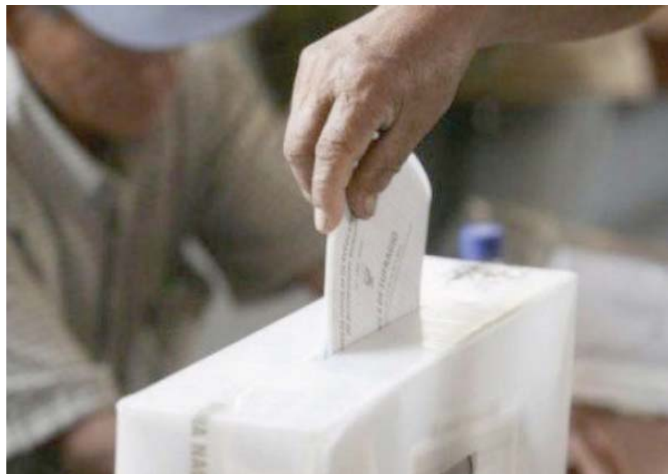
Con toda normalidad la población de San Vicente y las Granadinas acudió ayer a las urnas electorales

Unas 98.119 personas están registradas para votar en estos comicios generales en los cuales el actual mandatario, Ralph Gonsalves, y el Partido Laborista Unitario (ULP), buscan un quinto mandato consecutivo ante el opositor Nuevo Partido Democrático (NDP) y su candidato Godwin Friday.