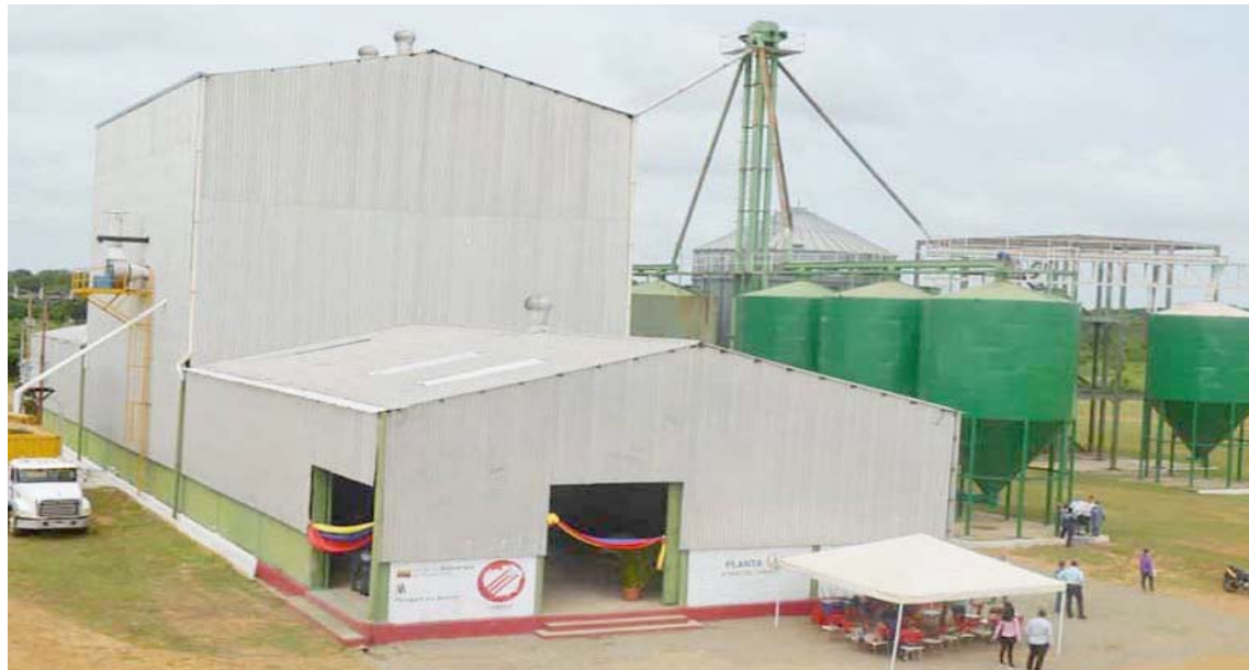
La planta ayudará al sector pecuario

En este sentido, el mandatario regional detalló que es una planta que va a procesar alimentos balanceados para todo el encadenamiento productivo de la parte pecuaria, al tiempo que puntualizó está generando