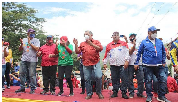
En Lara ya hicieron una reunión para estudiar estrategias

Informó que el trabajo realizado por las UBCH está vigente: “Tenemos que hacer una revisión y auditoría de estructuras de estos entes, señalar las fallas e indicar los correctivos. Ya los enemigos saben que el 6 de diciembre vamos a hacer que respeten la memoria de este