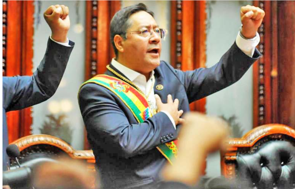
El Mandatario condenó la persecución y el uso de la violencia durante el gobierno de facto

“Los sectores minoritarios levantan la bandera de la democracia solo cuando les conviene, y cuando no, recurren a la desestabilización, a la violencia, a