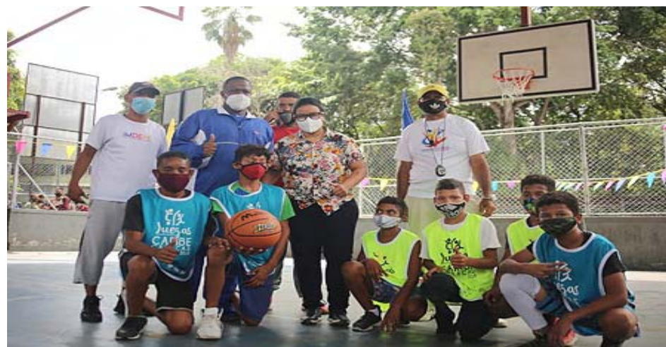
Escuelas deportivas recibieron implementos deportivos

La alcaldesa recordó que la primera edición de esta fiesta deportiva y cultural se hizo en el año 2018 y se dieron cita cerca de