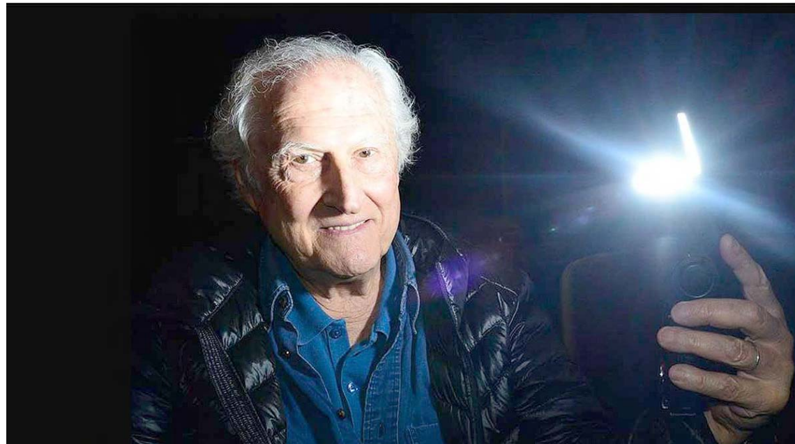
En 2010 se adelantó a la idea del streaming y propuso usarlo para difundir obras independientes

Además de eso, por sus laceras críticas al neoliberal Carlos Menem, a comienzos de la década de los 90 del siglo pasado, fue llevado a juicio e in-