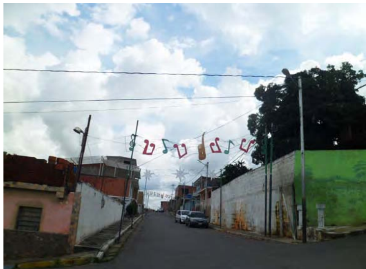
El 1 de diciembre se inaugura la Calle de la Navidad en Nirgua