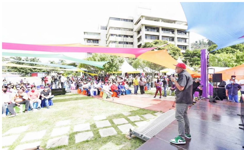
La derecha acabó con la AN y la utilizó para el robo y el asesinato, destacó Rodríguez

El comentario lo hizo durante su participación en el encuentro de la Juventud del Circuito 4 en Caracas, donde sostuvo que la derecha “acabó con la institución que está dirigida a aprobar las leyes de la patria, la Asamblea Nacional la utilizaron para el robo, el asesinato (...) La derecha trató de robarle