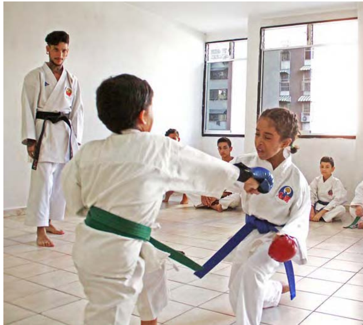
La actividad atlética siempre debe tener una cobertura informativa de primera

Una de las primeras medidas que se tomó fue compartir la memoria audiovisual de los Juegos Centroamericanos y del Caribe