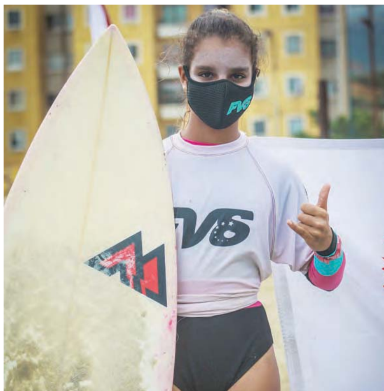
La mascarilla fue de uso obligatorio antes y después de entrar al mar.

“La intención es ir progresivamente retomando las actividades. Fue un evento muy puntual, la playa estuvo cerrada, sin público, con atletas previamente postulados por las asociaciones y que contó con los avales y permisos de todos los organismos de seguridad y deportivos del país, además de ello, cumplimos con todas las normas internacionales de