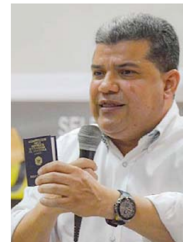
Los sectores de la derecha que se oponen a la democracia están reducidos, aseguró Parra

Señaló la necesidad de que todos los actores políticos e institucionales “volvamos al camino de la paz, la convivencia democrática y a la Constitución. Es la vía para que todos nos podamos reencontrar en el diálogo constructivo y el entendimiento”, añadió el candidato, quien rechazó tutelajes e imposiciones de gobiernos extranjeros.