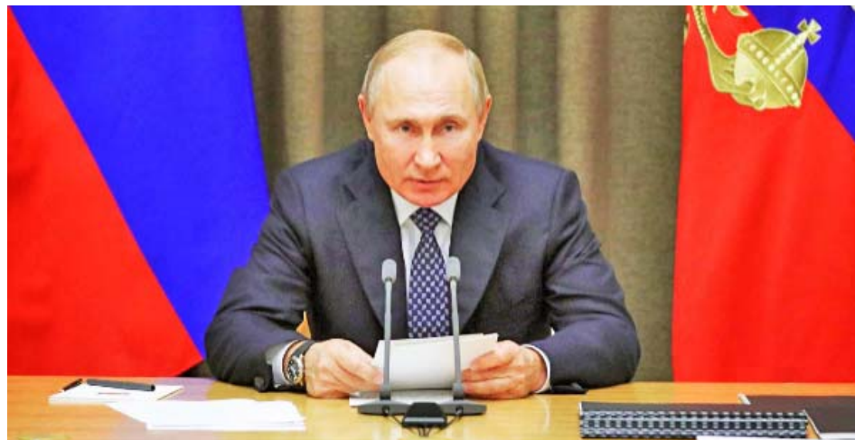
Vladimir Putin recordó que Rusia tiene dos vacunas contra el coronavirus

T/ Redacción CO/RT/AVN