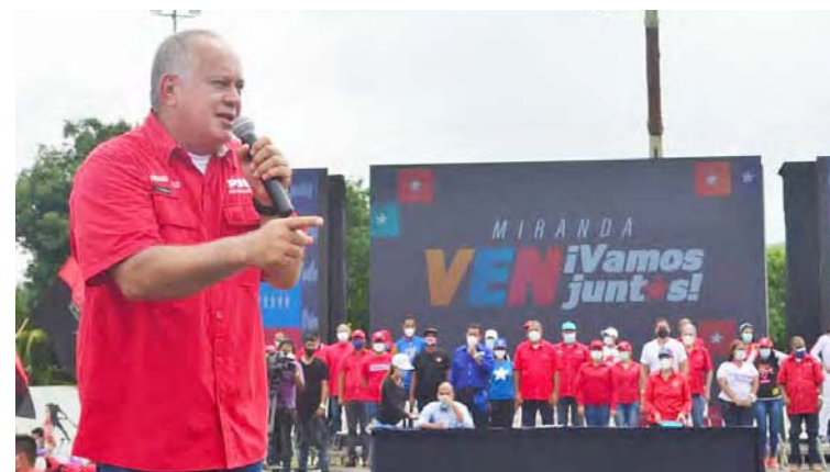
“La AN está convertida en la nada por quienes la han dirigido en los últimos cinco años”

Agregó que la participación en los comicios debe ser un homenaje a Darío Vivas, a su legado y a su lucha, por eso espera que el nuevo Parlamento que se instale a partir del 5 de enero de 2021 sea chavista, para estar a la orden del pueblo, para combatir las sanciones y agresiones del imperialismo.