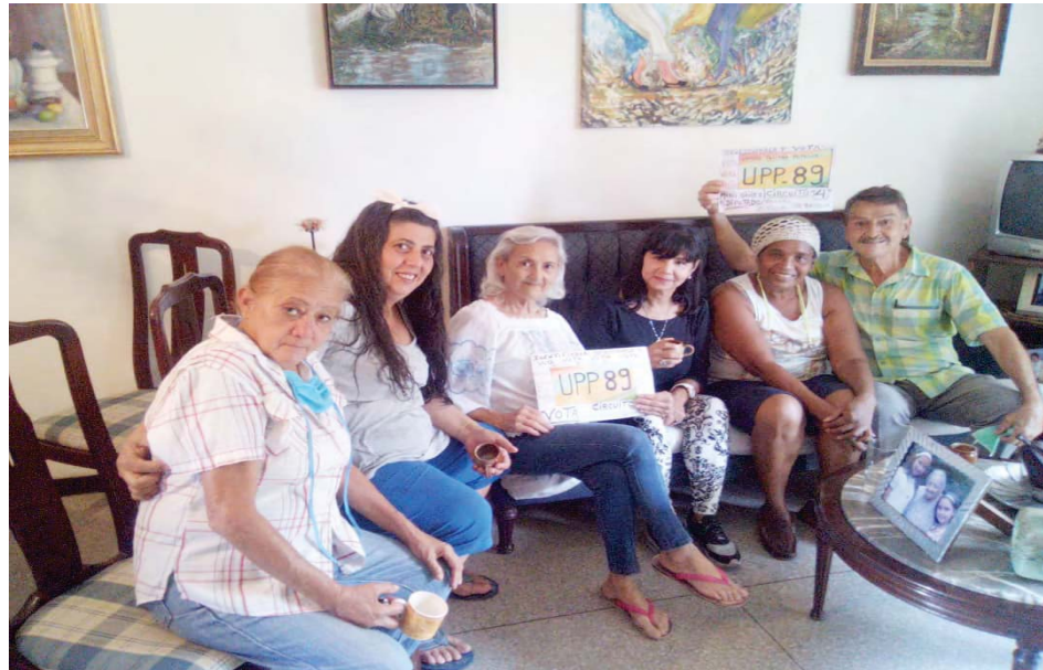
La candidata mirandina es abogada con experiencia