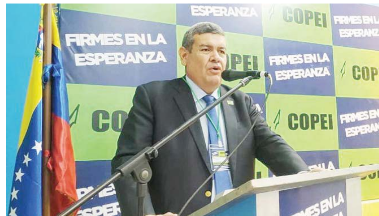
“Las personas que participan son los que construyen el país”, afirmó Salazar

“La democracia cristiana del partido Copei se coloca a la orden de todo el pueblo de Venezuela para este próximo 6 de diciembre, muy temprano acudamos a los centros de votación y mar-