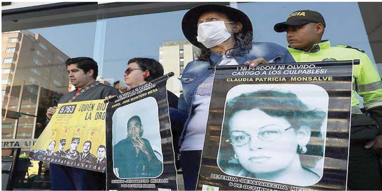
Los manifestantes señalan que los responsables de crímenes sigan gozando de beneficios

Organizaciones defensoras de derechos humanos denunciaron que el militar retirado está lejos de aportar datos para esclarecer numerosos crímenes atribuidos al Ejército Nacional