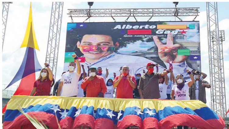
Es el momento de llevar a diputados dignos a la AN, resaltó Rodríguez

“El 5 de enero nos instalamos y el 6 entregaremos una ley para encerrar en la cárcel a los que pidieron sanciones y bloqueos, por ladrones, por malos hijos de la patria, para que el pueblo vuelva a la Asamblea Nacional, es un compromiso que tenemos los candidatos del GPP”, resaltó el candidato Diosdado Cabello