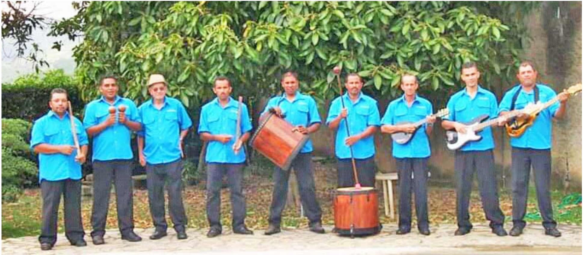
Embajadores de Canoabo

El Gran Parrandón del 25 de diciembre arriba a los 30 años