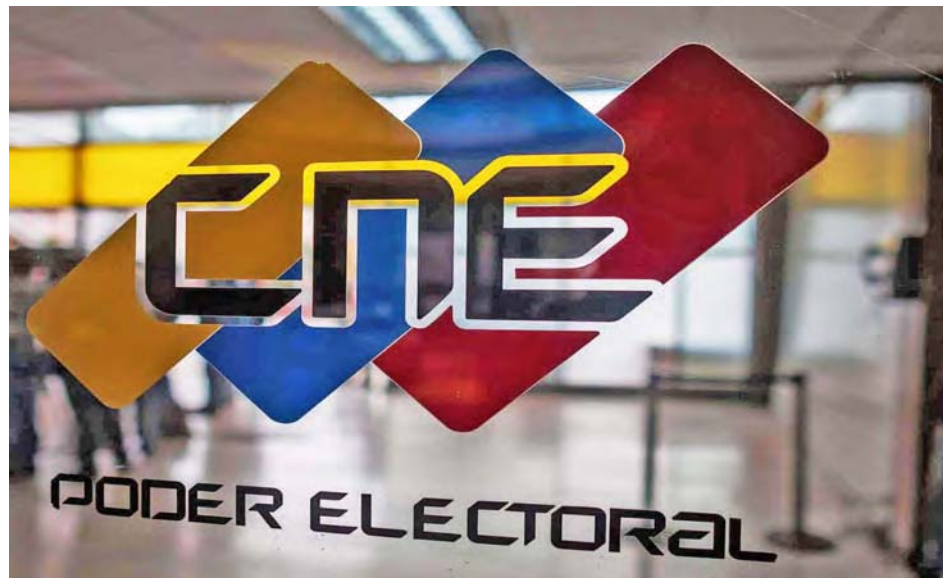
Del 9 al 21 de diciembre se retirarán los equipos electorales tecnológicos

El CNE también anunció que del 7 de diciembre al 9 de marzo se abre el proceso de rendición de cuentas de las organizaciones políticas postulantes a los comicios parlamentarios del pasado domingo, y el 23 de marzo de 2021 será el proceso de auditoría y sustanciación de investigaciones de gastos de campaña electoral.