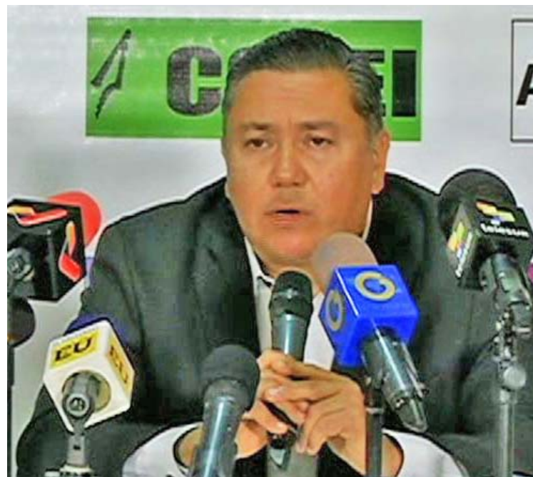
Diputados opositores y del GPP deben trabajar de manera conjunta

Asimismo, el diputado electo resaltó la necesidad de debatir una ley para la creación de un órgano social que permita que el dinero que el Estado tiene fuera del país vaya a un fondo social.