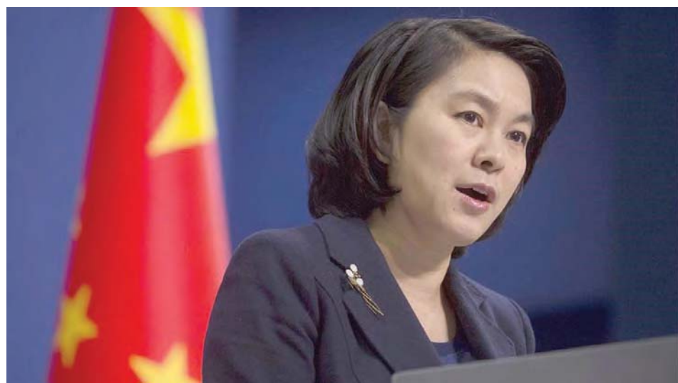
Hua Chunying llamó a EEUU a desempeñar un papel constructivo en la solución de problemáticas

La portavoz de la Cancillería de China, Hua Chunying, dijo que la celebración de las votaciones es un asunto interno de Venezuela, por lo que llamó a Estados Unidos a respetar el sistema democrático del país y sus prácticas