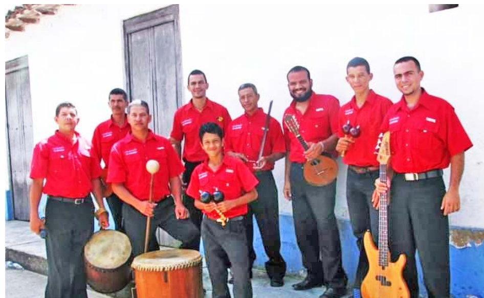
Cardenales de Canoabo