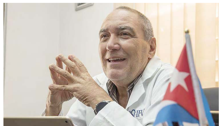
India, Pakistán, Vietnam y Venezuela, están interesados en adquirir la vacuna

Esta semana comenzó la segunda parte de un ensayo Fase II de este producto con 900 pacientes, que se sumaron a un centenar de la primera etapa en un policlínico de la capital, constató The Associated Press la víspera.