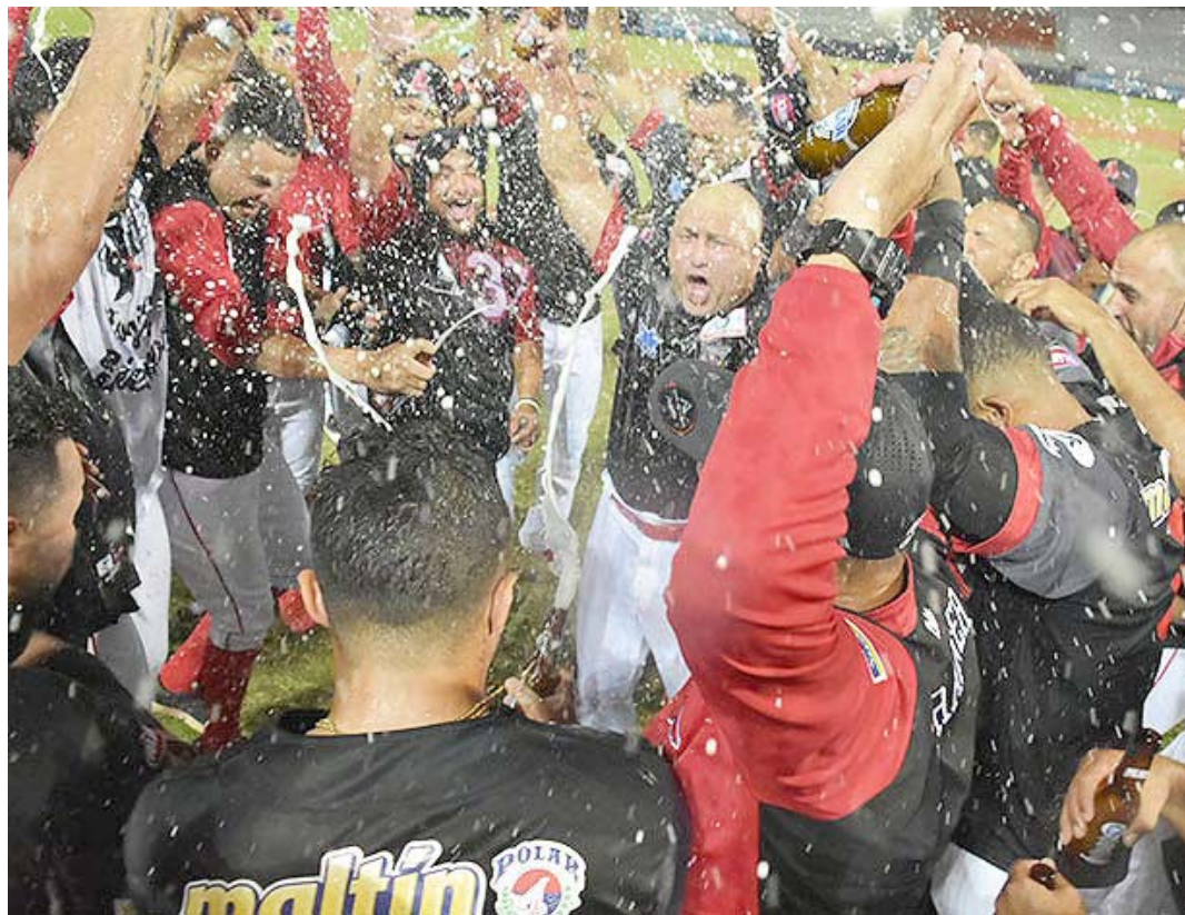
Lara quiere seguir celebrando hasta la Serie del Caribe

Es la tercera vez en las últimas cuatro zafras que ambas organizaciones definirán al campeón de Venezuela