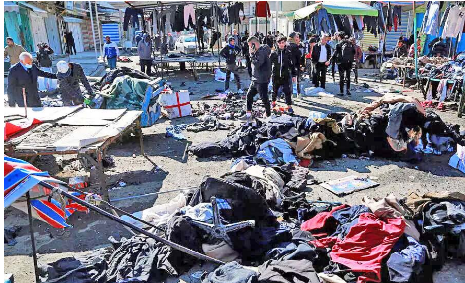
El número de víctimas podría elevarse, ya que varios heridos están en estado crítico

Ninguna agrupación ha asumido la responsabilidad por este ataque, sin