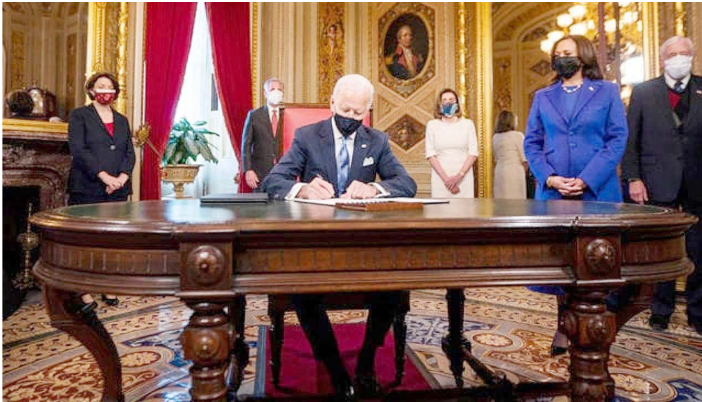
La estrategia busca contrarrestar el fracaso de Trump y actuar como EEUU necesita, dijo Biden

Firmó un decreto para poner en marcha un plan para enfrentar la pandemia, que establece el aislamiento social y el uso obligatorio de tapabocas en los espacios públicos