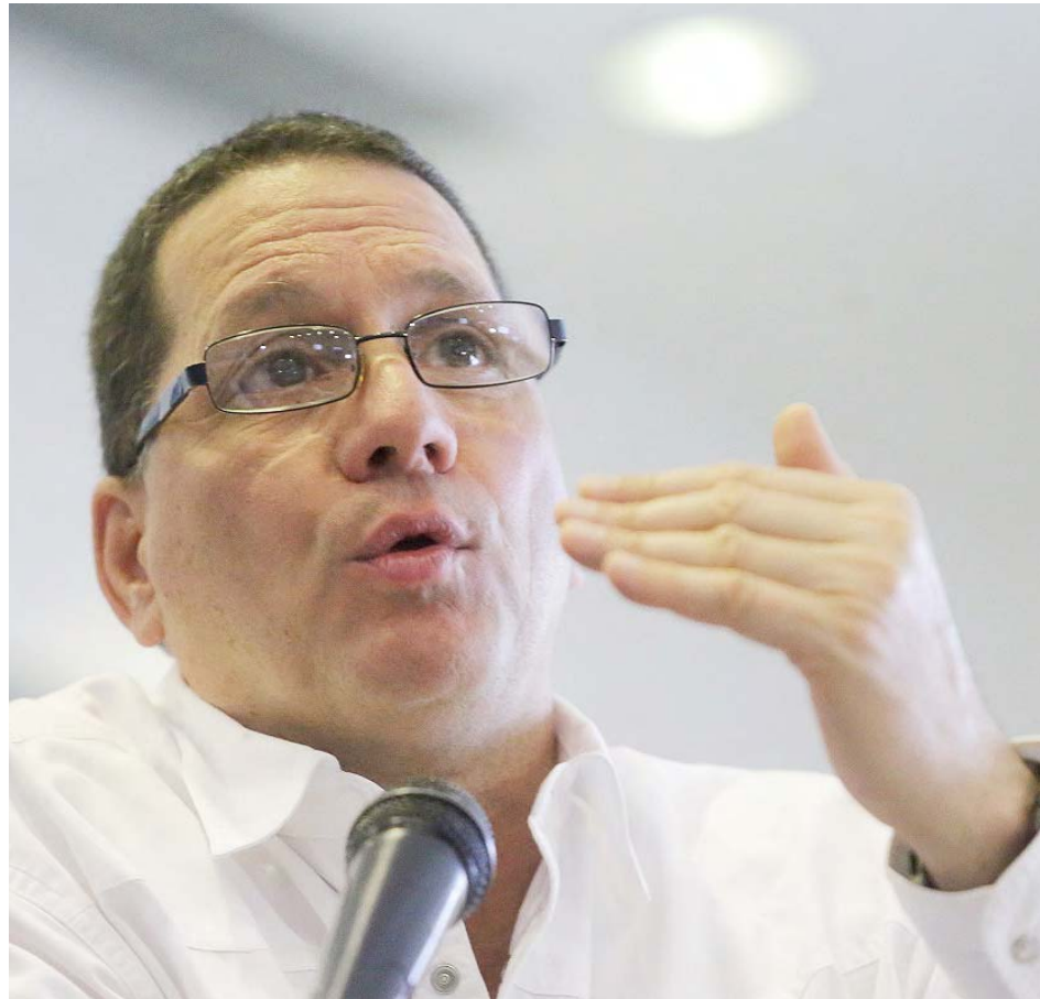
Biden tendrá una mayor sintonía con el sistema capitalista, señaló Farías

“En coherencia con el objetivo principal que siempre ha tenido el imperio norteamericano de expoliar las riquezas del