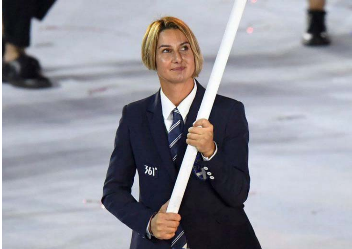
Sofía Bekatorou es una idolo en el país helénico

En declaraciones que recoge CNN y que se dieron durante un encuentro digital organizado la semana pasada por el