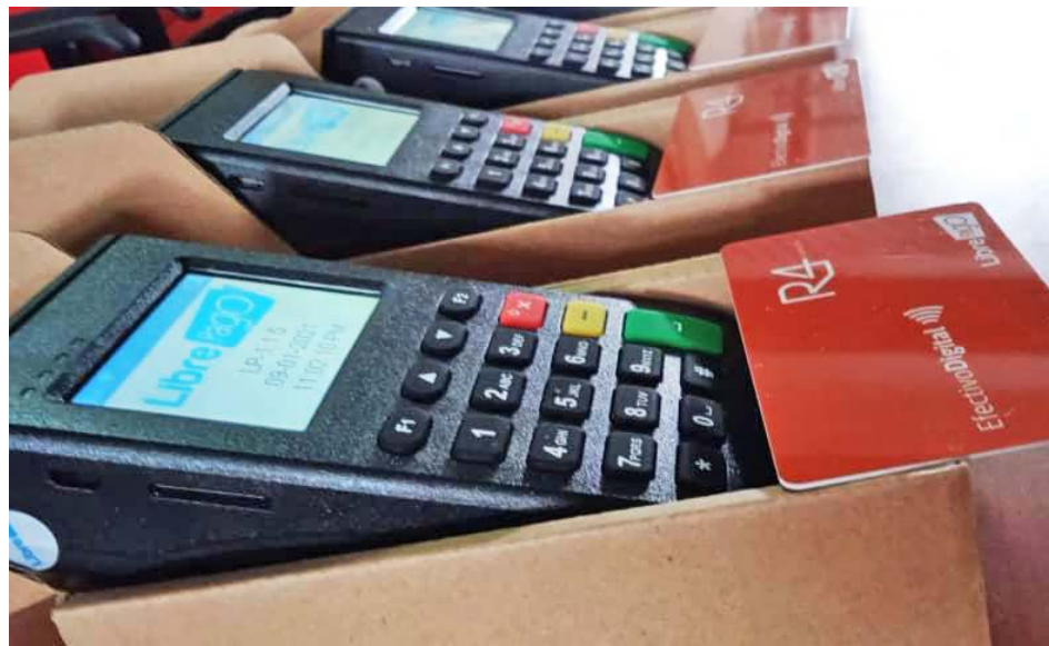
La tarjeta PIM es una alternativa al uso de efectivo en el transporte público

Explico que la plataforma es una iniciativa desarrollada por la empresa Libre Pago, apoyada por Mi Banco para el financiamiento de los puntos de venta