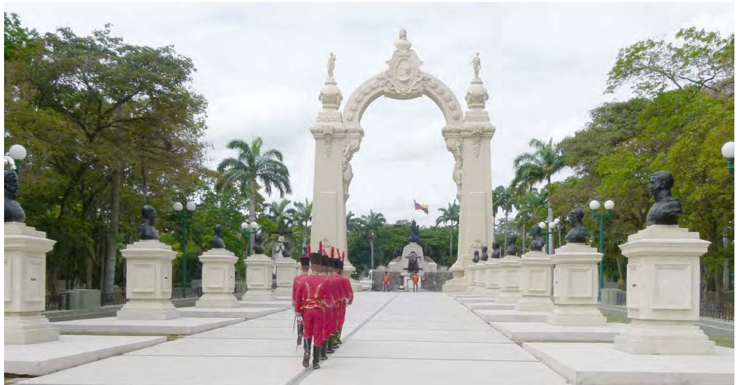
Campo y arco de Carabobo

En los alrededores del campo, fuera del perímetro o valla que rodea el parque dedicado a la Batalla de Carabobo, aunque también en el área interna, se observa el estrago que ha causado el verano que recién se inicia, que ha resecado y achicharrado la grama, la maleza, el monte y el gamelote, este último sobre todo en las inmediaciones externas.