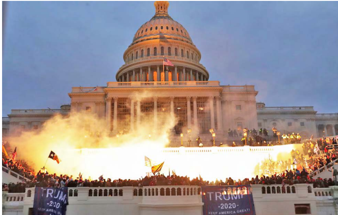
Los republicanos objetaron invocar la vigésimo quinta enmienda contra Trump

La resolución de los congresistas demócratas tiene un solo artículo, “incitación a la insurrección”, que como mo-