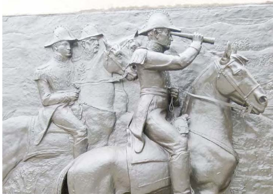
Bolívar en su puesto de comando, relieve

de la FANB, el 28 de diciembre de 2010, en el cuartel Abelardo Mérida, en Maracay, estado Aragua, se anunció el retorno a esa base del viejo batallón de tanques Bravos de Apure, que estuvo allí por muchos años.