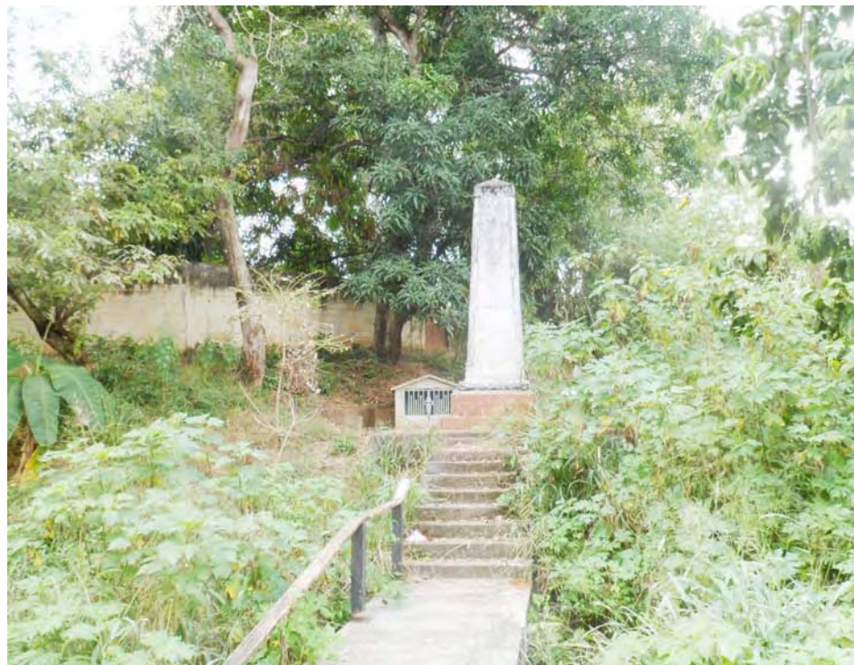
El monolito donde murió Manuel Cedeño está tomado por el monte

Durante la salutación de fin de año del presidente Hugo Chávez a los miembros