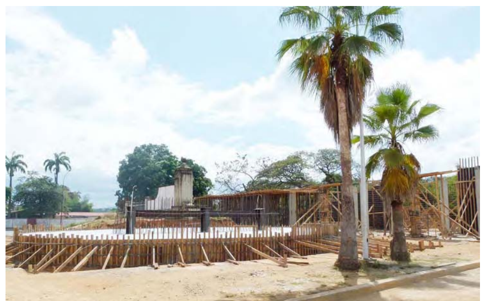
Ya se iniciaron las obras de remodelación del campo y construcción de una nueva entrada con el sable de Bolívar como insignia

Desde finales de 2020, el presidente Nicolás Maduro no ha dejado de aludir a la trascendencia que tiene para Venezuela la conmemoración de los 200 años de la