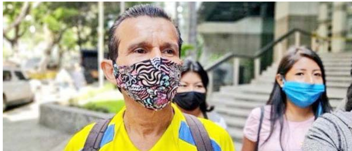
Aplicarán PCR a miembros de las Juntas Receptoras del Voto

Debido a la preocupación de varios líderes políticos, entre ellos, el expresidente Rafael Correa, por un eventual aplazamiento de la fecha de las votaciones, las autoridades electorales aseguraron que el proceso se realizará en la fecha prevista sin ningún contratiempo