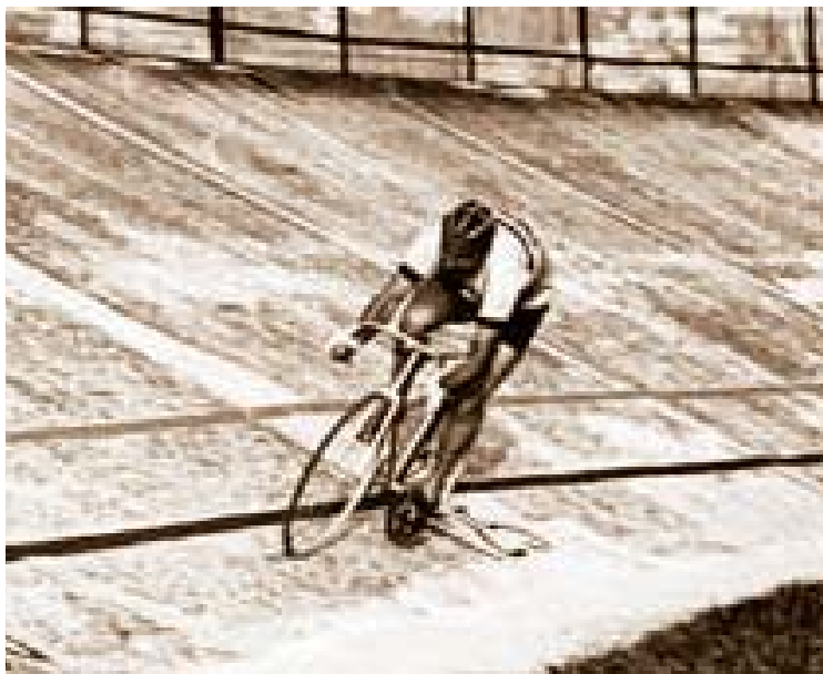
León a pesar de su edad todavía mantiene vitalidad

En la travesía, León recorrió las islas del Caribe y solo se alimentó con sándwiches y Coca Cola hasta llegar a Bermuda, y