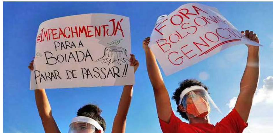
Mientras en Manaus se mueren por falta de oxígeno, Bolsonaro dice que su país vive el "finalcito de la pandemia"

"Fuera Bolsonaro" y "Juicio político" fueron algunas de las consignas de los manifestantes que recorrieron varias ciudades de Brasil para pedir la salida del Presidente