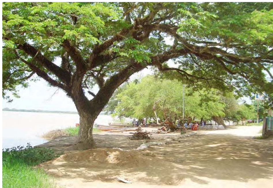
Poblado de Apurito

Agrega el mismo autor que también se tienen referencias de un arreo hecho por el general José Gregorio Monagas en 1846, que llevaba desde el Alto Apure hasta Maturín más de 12.000 reses, que contribuyeron efectivamente a la recu-