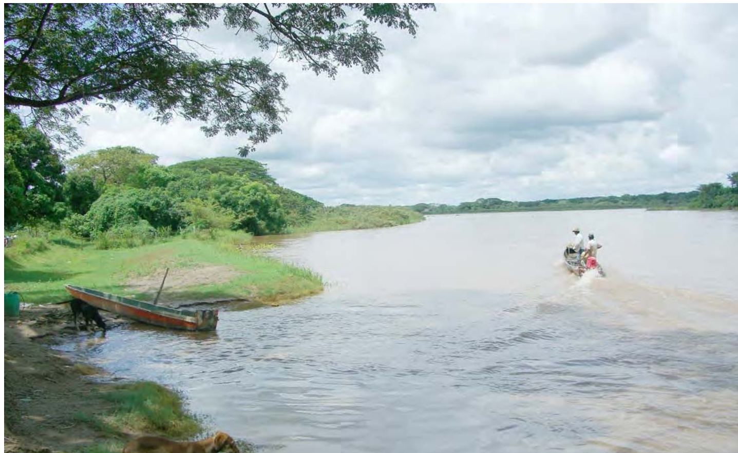
Río Apure al este de Bruzual

Ya antes en 1817, Bolívar, en carta a don Martín Tovar, alude a la importan-