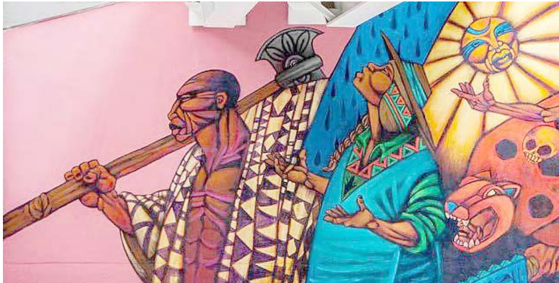
El evento formará parte de la celebración de los 200 años de la Batalla de Carabobo

Desde su nacimiento en 2015 la Bienal del Sur. Pueblos en Resistencia se concibió como espacio contestatario y plataforma para potenciar las artes visuales como eco de las voces, individuales y colectivas, que a través de sus discursos plásticos se comprometen abiertamente con la justicia social, la igualdad, la equidad