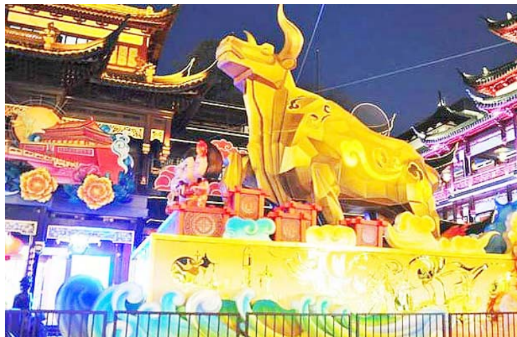
La gala televisiva ha tenido una audiencia superior a los 700 millones de personas

Por otro lado, la televisión nacional coordina la transmisión de la gala por Año Nuevo Lunar, un programa variado, con alta audiencia y devenido