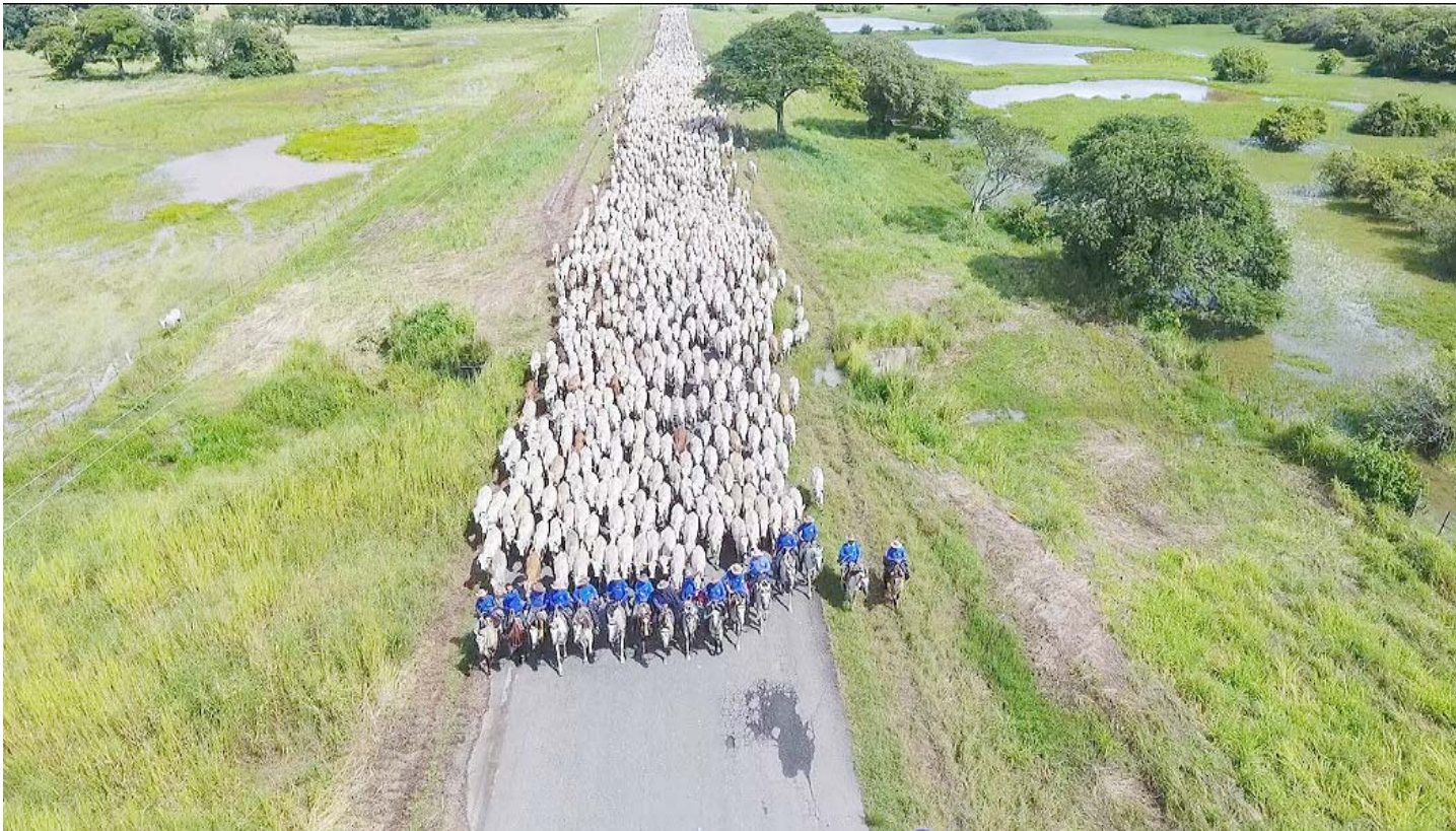
Rebaño de ganado de la empresa Agroflora

La marcha, con 4.000 reses, 2.000 caballos de reserva y 2.500 hombres de tropa, protagonizada por José Antonio Páez y sus llaneros, constituye uno de los episodios memorables de la época de la independencia y de la campaña de Carabobo