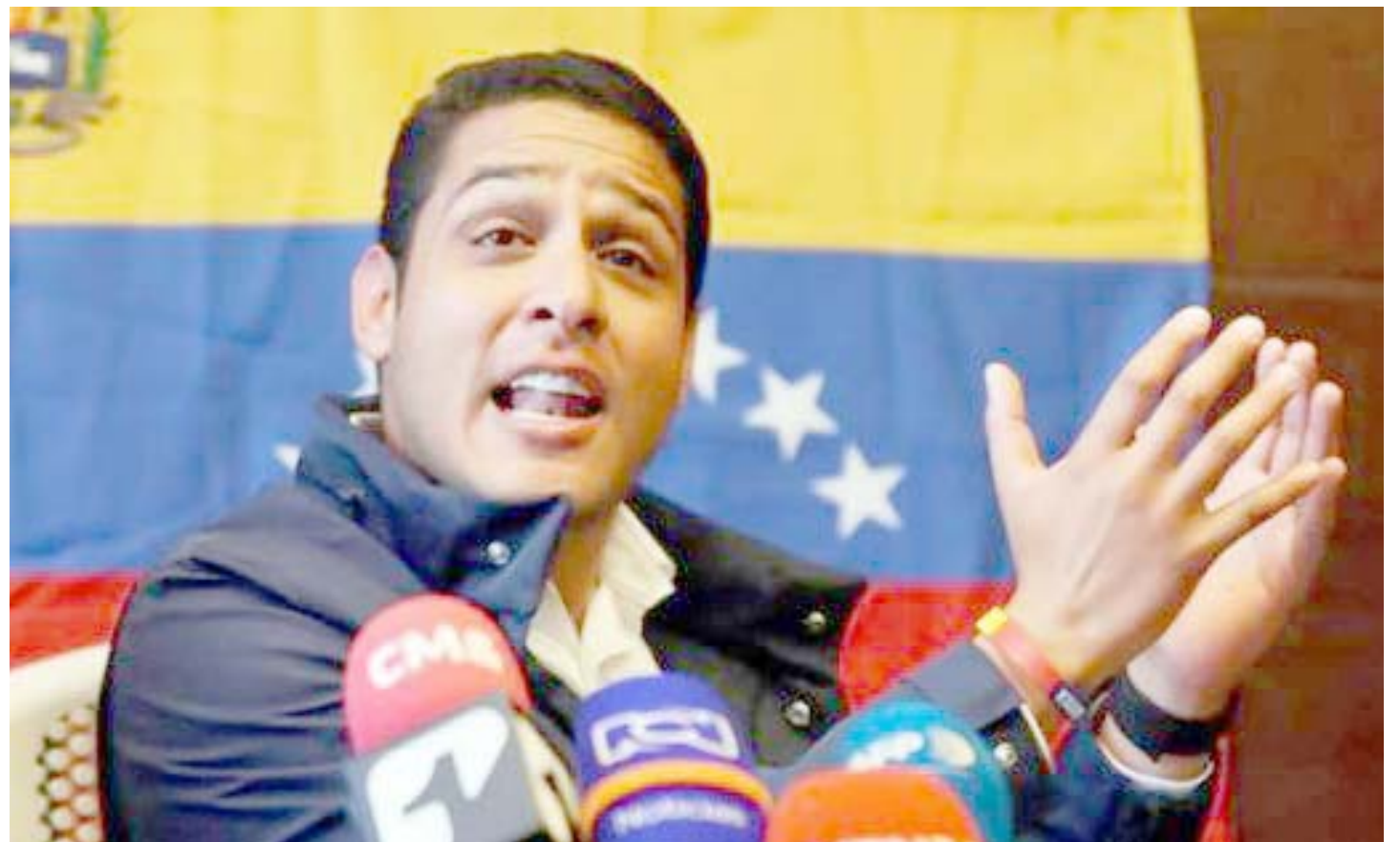
Exdiputado José Manuel Olivares

La cifra mencionada por Olivares la presentó sin evidencia que respaldara esta disparidad con las oficiales; no se puede esperar menos de una oposición acostumbrada a no reconocer ni siquiera los números de los procesos electorales, contra los cuales nunca han presentado respaldo de sus acusaciones de fraude.