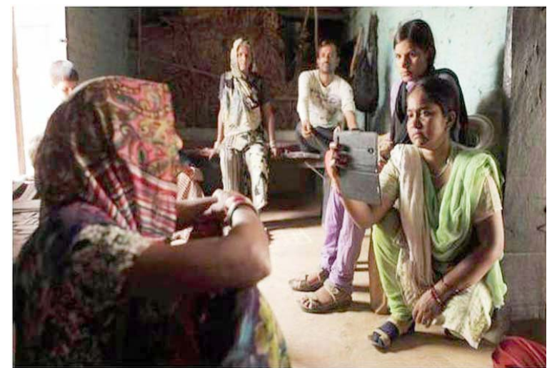
La fiesta audiovisual estrenó en esta edición el programa Pantallas Satélite

La cinta argentina El perro que no calla , de la realizadora Ana Katz, tuvo su estreno en la