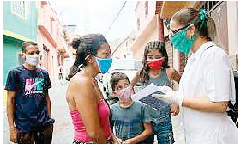
Venezuela implementó el servicio de atención casa por casa con médicos comunitarios

Esta maniobra desesperada de Guaidó y su gente, aunque de absoluta nulidad dentro del territorio venezolano, es un intento por mantener cierta relevancia en lo mediático y justificar de alguna retorcida manera su interlocución con Washington para continuar con las maniobras de saqueo de los recursos y activos del país en el exterior.