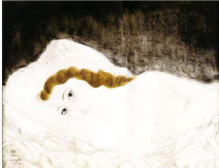
El texto original está inspirado en una obra plástica del maestro japonés Foujita

Abreu, en la interpretación del mismo Giraudoux, ofrece palabras, emociones y pensamientos que buscan dibujar, ante el espectador, la atmósfera de la época con todos sus colo-