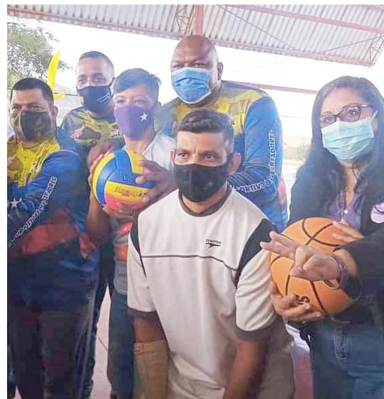
Vargas señala que una cancha es una herramienta de paz

T/ Redacción CO F/ Gobernación Lara Caracas