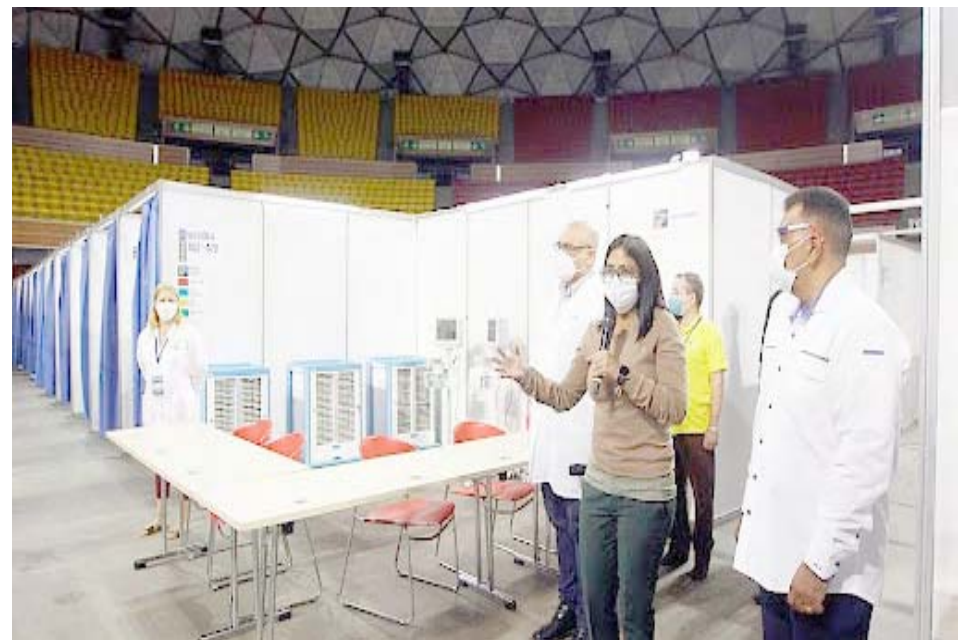
Hospital de campaña en el Poliedro de Caracas con más de 1.000 camas

Olivares también hace mención a una supuesta “improvisación” en el manejo de la pandemia. Nada más lejano a la realidad, ya que desde mucho antes de