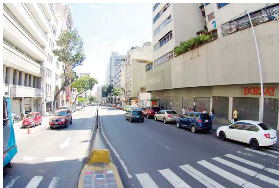
Venezuela fue el primer país de América en aplicar un método (7+7) de cuarentena radical

diente de denuncias fraudulentas con las cuales se sustentan los ataques que se hacen contra la República Bolivariana, tanto en el Departamento del Tesoro, el Grupo de Lima o en algunos sectores de la Oficina de Derechos Humanos de la ONU.