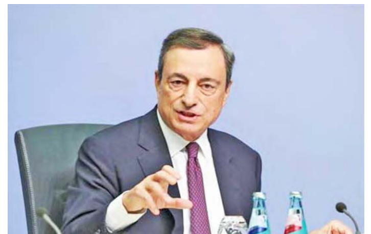
Mario Draghi es experto en manejo de crisis económicasFinal del formulario

De asumir el nuevo gobierno, Draghi deberá enfocarse