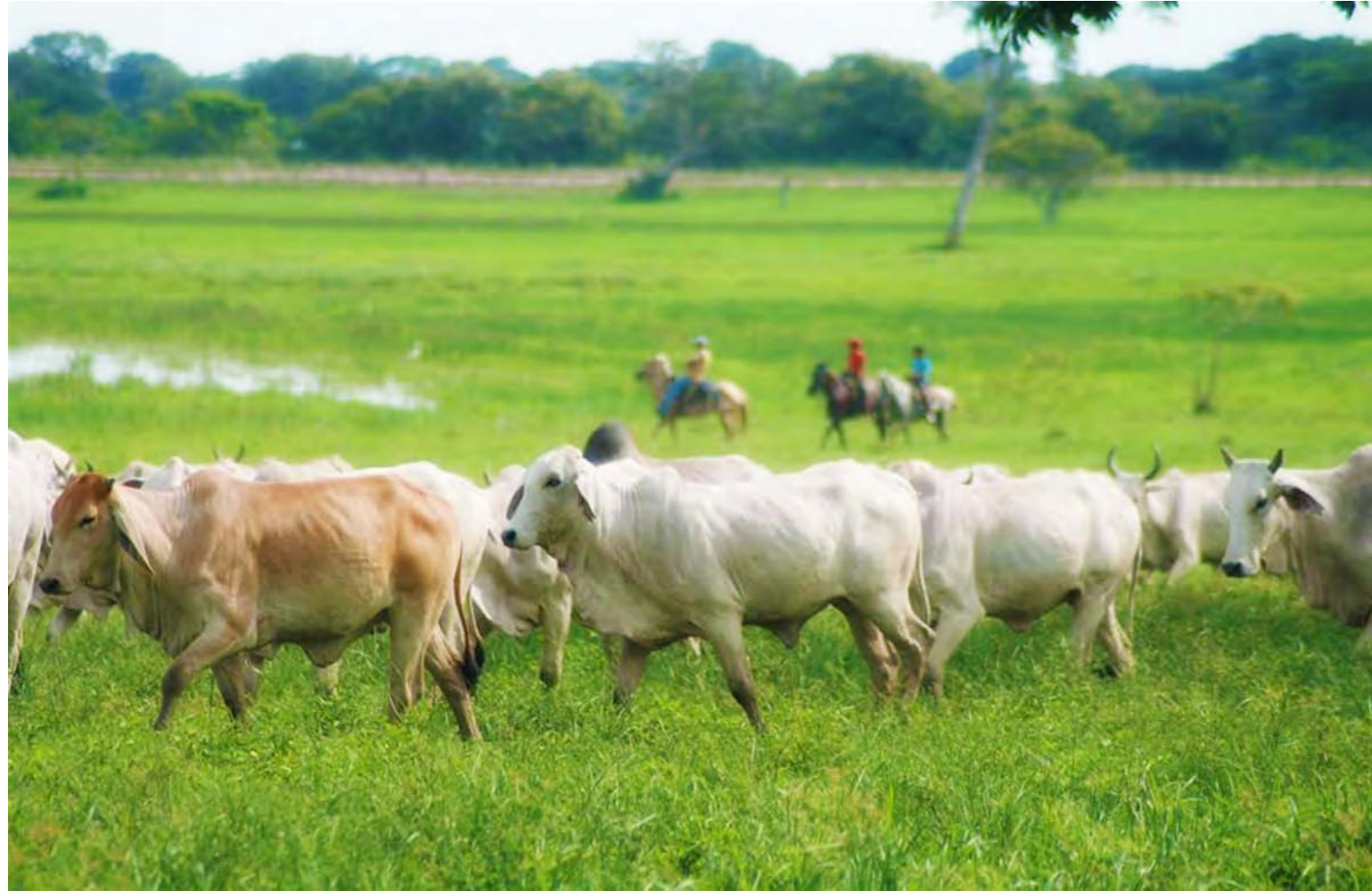
La ganadería apureña apuntala el rebaño nacional

La Corporación Ganadera del estado Apure posee en 22 hatos más de 120 animales, presenta un promedio anual de unas 32 mil vacas preñadas y 27 mil nacimientos. En el hato Matapalo se crían cinco razas puras de carne puestas al servicio del mejoramiento de la ganadería bovina. Apure es el tercer productor de ganadería del país, después de Barinas y Zulia