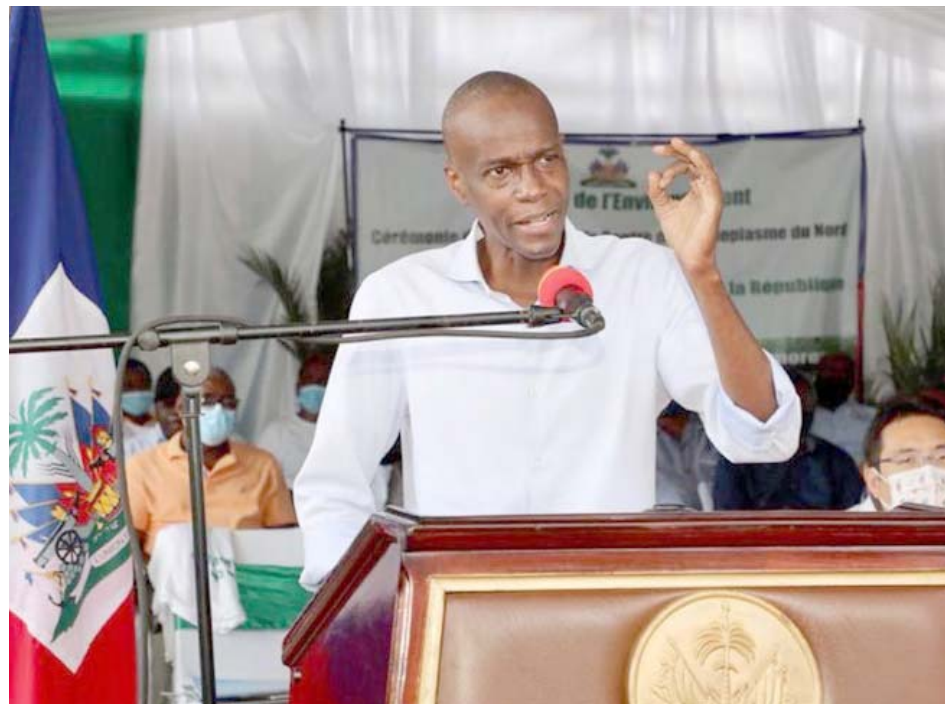
El presidente de Haití, Jovenel Moïse, invitó a la oposición a sumarse a la propuesta constitucional

Mediante las redes sociales, el gobernante haitiano pidió a sus opositores unirse para hacer las “reformas efectivas” a la Constitución de Haití. “Aquí no habrá transición. Me quedan 364 días