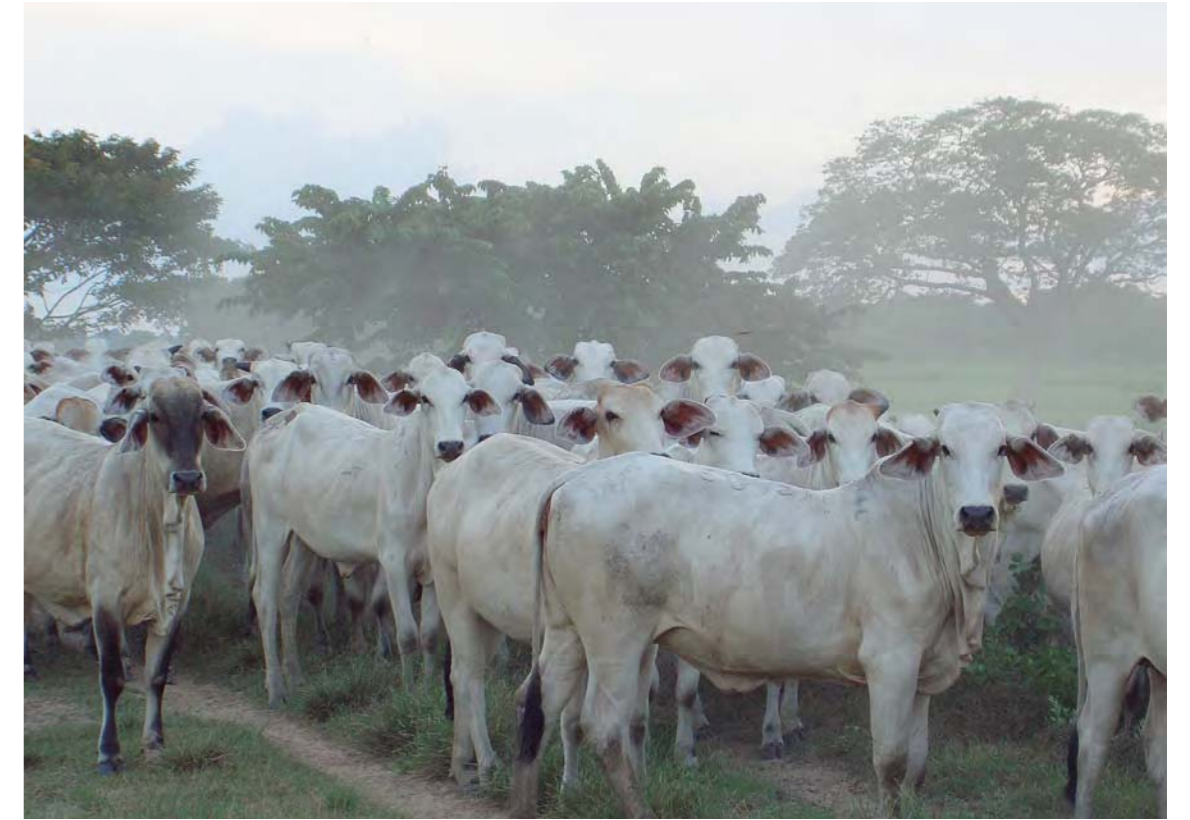
Ganado de El Cedral

“En Apure el promedio es cinco hectáreas por animal y en algunos sitios hasta 20 hectáreas. Es una muestra de la eficiencia porque todo el ganado que aquí se cria está en silo pastoreo”, aseveró el ministro.