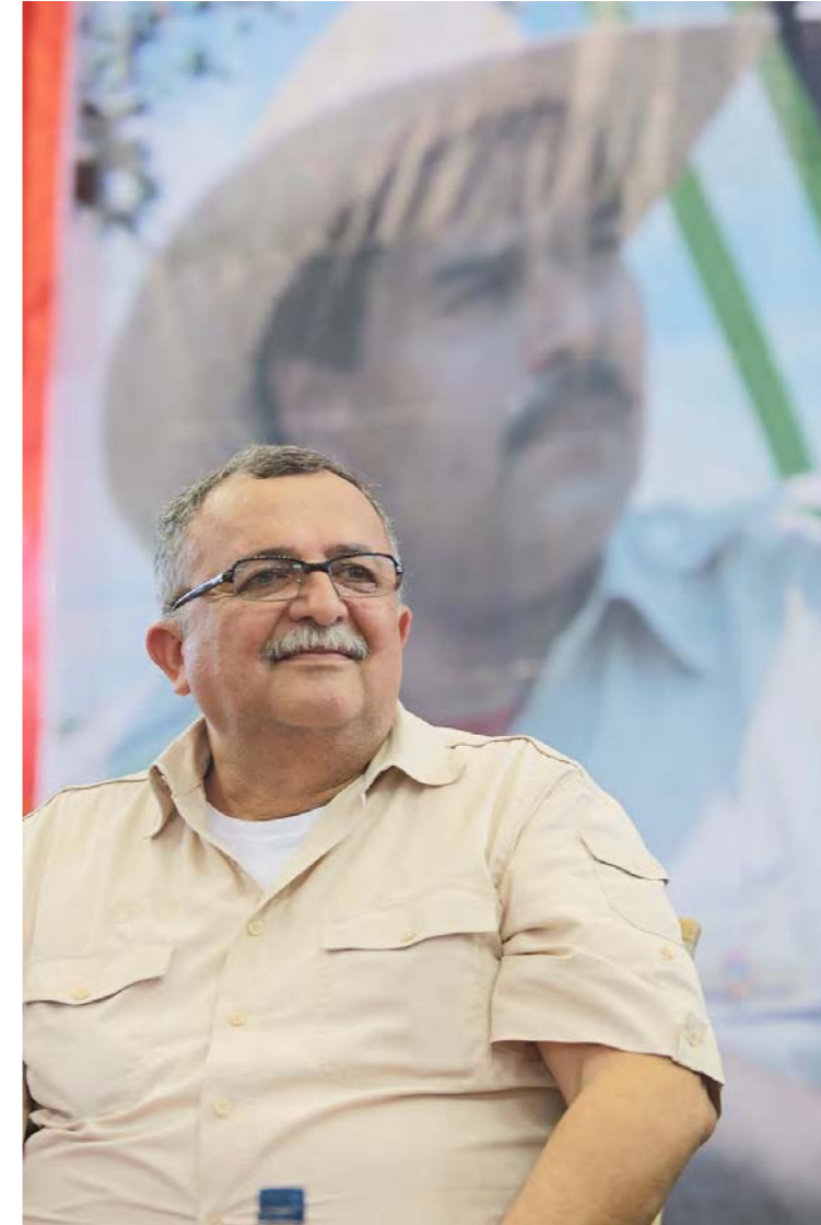
Ramón Carrizález, gobernador del estado Apure

Indicó el presidente de la corporación ganadera apureña que en el hato Matapalo se observaba un estricto control desde el momento en que la vaca es apareada, hasta cuando el becerro nace. Un médico veterinario genetista se encarga de los apareamientos.