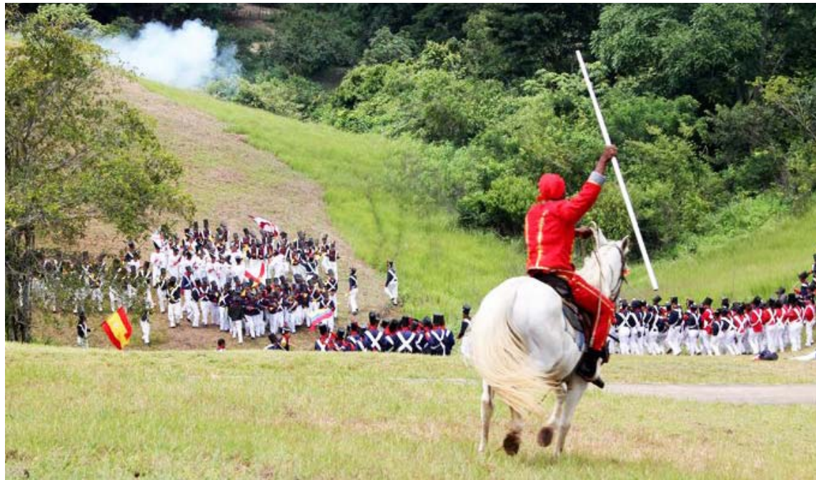
Pueden participar personas con o sin experiencia en actuación

La serie, que está en proceso de preproducción por la Villa del Cine I, estará destinada, en palabras del ministro de Cultura, Ernesto Villegas, a “celebrar