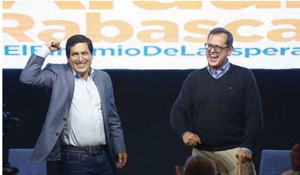
Hay que esperar el conteo del 100% de las actas para saber si Arauz se medirá con Lasso o Pérez

El conteo rápido arrojó que el binomio de la alianza correísta UNES, formado por Andrés Arauz y Carlos Rabascall, alcanzó el 31,74% de la preferencia popular.