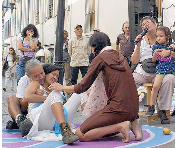
La “tropa cominicallejera” se vale de diversos lenguajes para comunicar

“La nueva normalidad de la comunicación callejera, que es lo que hacemos en Comunicalle, nos impulsa a crear nuevos formatos y a explorar caminos novedosos para las acciones comunicacionales que compartimos en plazas, bulevares, calles y esquinas; respetando y promoviendo las medidas de bioseguridad, sin por ello sacrificar el contacto humano y cálido que