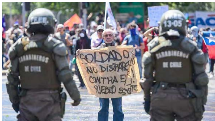
Sectores políticos y sociales de Chile piden la desarticulación de los Carabineros