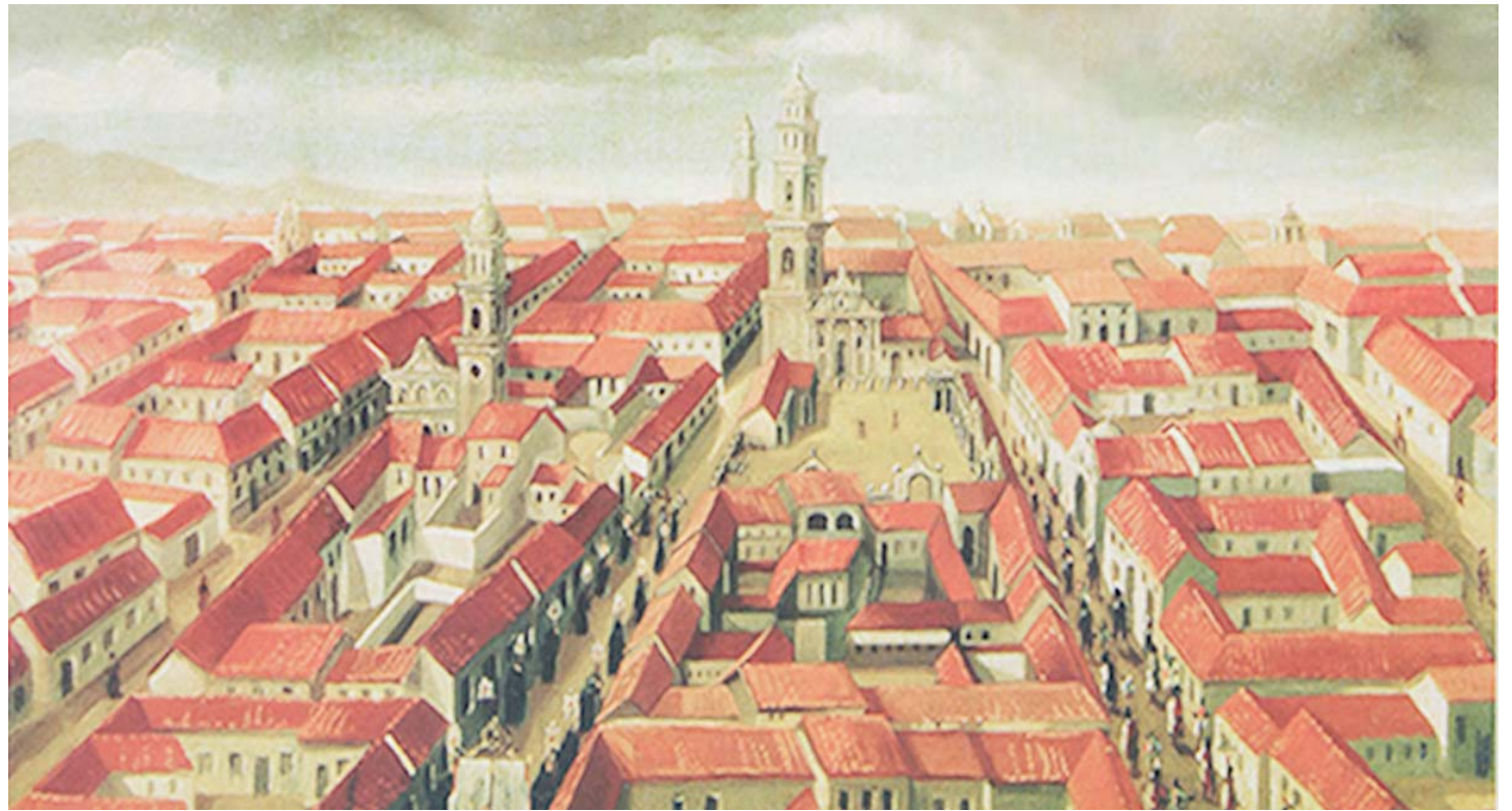
Caracas hacia 1760, pintada por Juan Pedro López

En la proclama del 25 de abril dirigida a los soldados patriotas se refiere a la victoria final y a la obligación de ser más piadosos que valientes: “Soldados: todo nos promete una Victoria final, porque vuestro valor no puede ya ser contrarrestado. Tanto habéis hecho, que poco queda que hacer; pero sabed que el