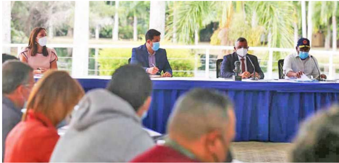
Este fin de semana se abordarán ocho estados del país, precisó Reverol

Por esa razón, enfatizó que la planificación debe ser en conjunto, “trabajaremos para dar respuestas concretas a la población en compañía de los parla-