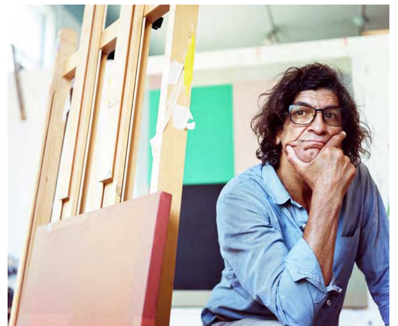
Matheus tiene una larga trayectoria en las artes plásticas

Así, a su interés por la historia de la plástica del