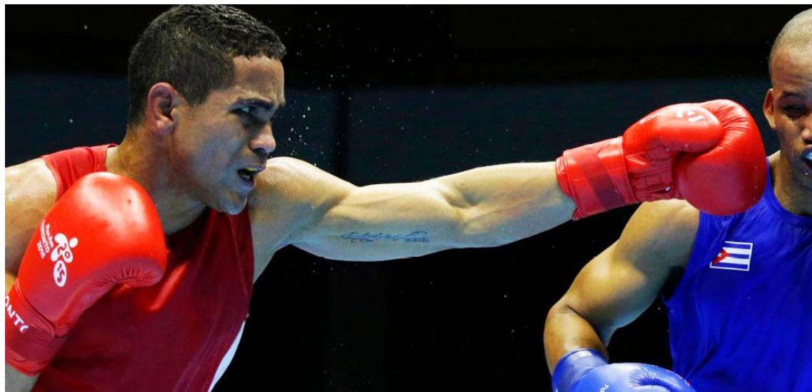
El boxeo siempre es una opción para medallas internacionales

El último clasificatorio, que se iba a realizar en París, Francia, en junio no se realizará. Los 53 lugares de cuota (32 hombres y 21 mujeres) que se planea asignar en el Clasificatorio Olímpico Mundial