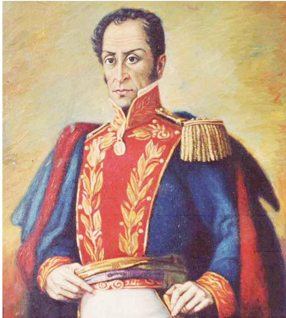
Bolívar demostró una vez más su gran capacidad como estratega

La ruptura de Maracaibo con el gobierno español y su incorporación a la recién creada República de Colombia, (hecho que provocó la ruptura del Acuerdo de Armisticio), la ocupación