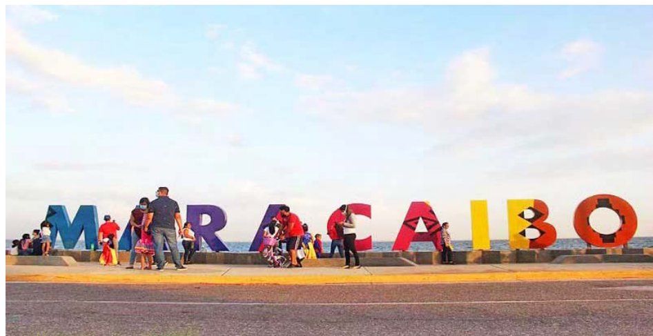
Maracaibo, a pesar de todo, celebró el Carnaval

Agregó que el Día del Amor y la Amistad se dejó sentir en las plazas y parques