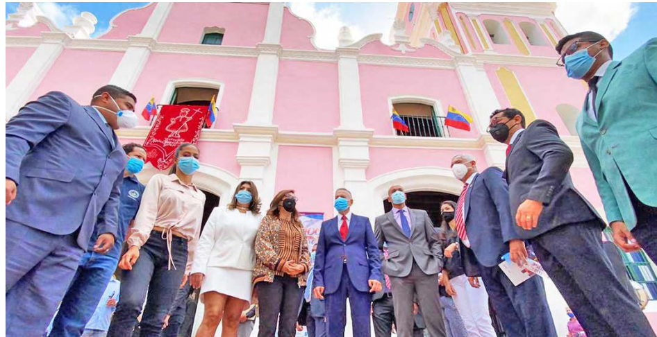
Petare, a pesar de sus problemas, mantiene tradiciones y tiene variadas actividades de recreo y cultura