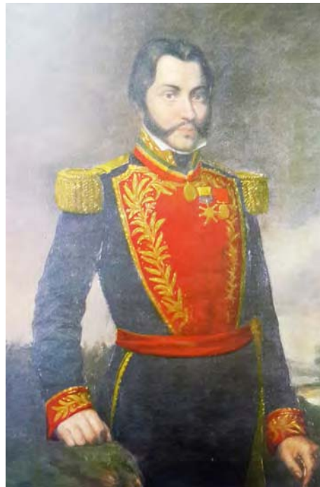
General Francisco Bermúdez

Gobierno os impone la obligación rigurosa de ser más piadosos que valientes”