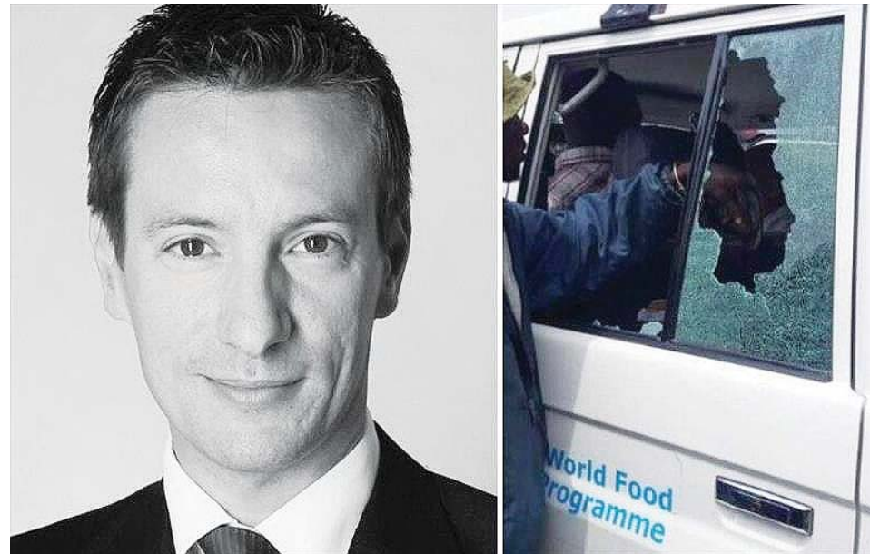
Hasta el momento nadie se ha atribuido la autoría del asesinato del embajador Luca Attanasio

La nota indica que Attanasio y un militar fueron impactados por balas de hombres desconocidos que atacaron un convoy de la Misión de Naciones Unidas en la República Democrática del Congo (Monusco).