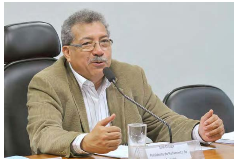
La comisión realizará foros para dar a conocer la verdad del país

“Para nadie es un secreto la forma artera abierta como han conspirado contra la democra-