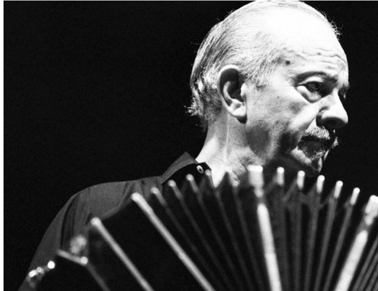
Se esperan otras actividades para recordar al genio argentino a lo largo del año