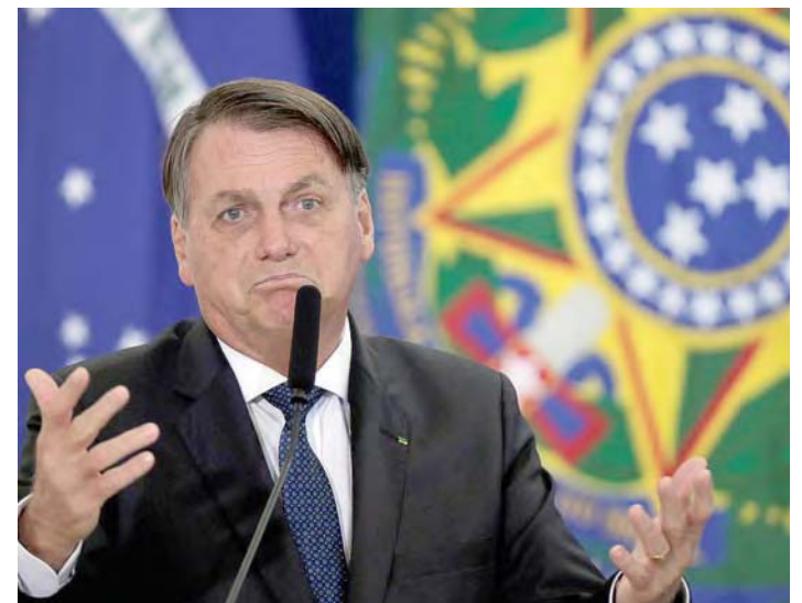
El fiscal general deberá decidir si denuncia o abre una investigación

Por otra parte, médicos especialistas en infecciones denunciaron que sufren presiones por parte de partidarios de Bolso-