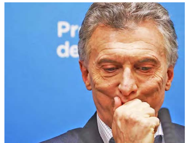
Fernández dijo que Macri endeudó a Argentina sin la aprobación del Congreso

En su discurso, el Mandatario recordó que el actual