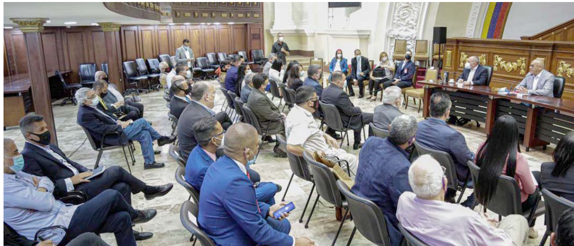
Partidos políticos están dispuestos a participar en jornada electoral, señaló Rodríguez

T/ Leida Medina Ferrer-Deivis Benítez F/ Presidencia AN Caracas