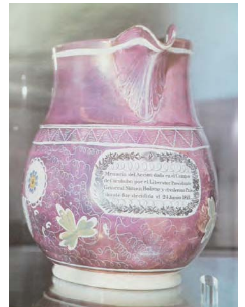
Vasija conmemorativa de la Batalla de Carabobo