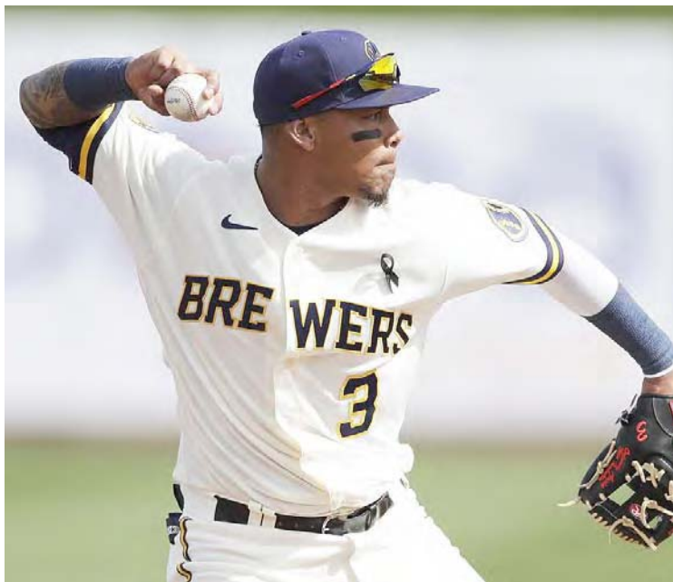
La corpulencia de Arcia parece influir en su cambio de posición

Arcia nunca ha jugado en la antesala en las mayores. En los cinco años de experiencia, precisamente en 538 encuentros, solamente posee una actuación como jardinero y dos más como lanzador. Por último, existe la posibilidad que ambos jugadores se alternen las posiciones en algún momento de la zafra 2021.