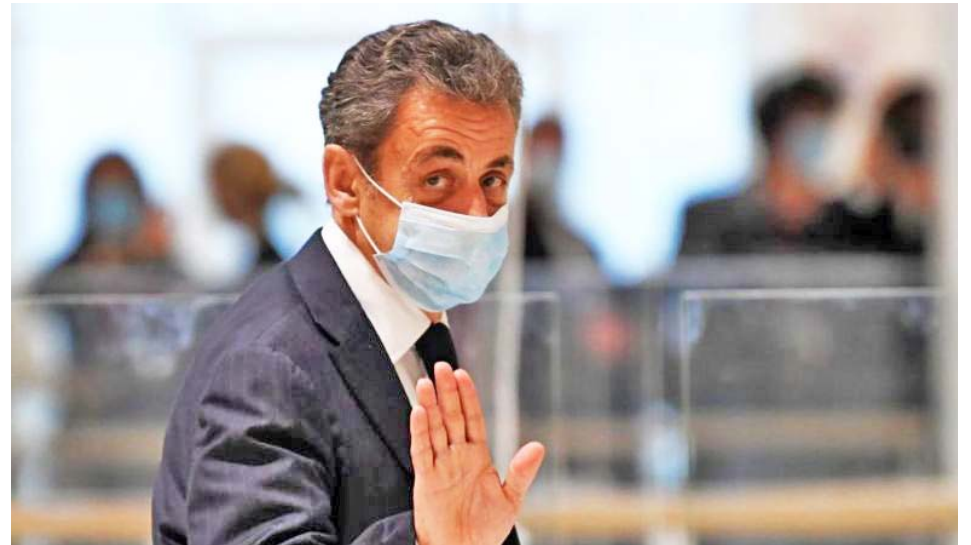
La sentencia acaba con la aspiración de Sarkozy de ser candidato presidencial

Con este caso, la trigésima cámara correccional del Tribunal de París sentó un precedente excepcional al condenar con severidad a un exjefe de Estado que aspiraba a ser el hombre presiden-