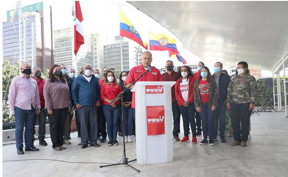
El PSUV hará las reuniones cada semana de flexibilización, informó Cabello

Cabello señaló que este Congreso “lo haremos en homenaje a nuestro comandante Hugo Chávez. Allí estaremos re-