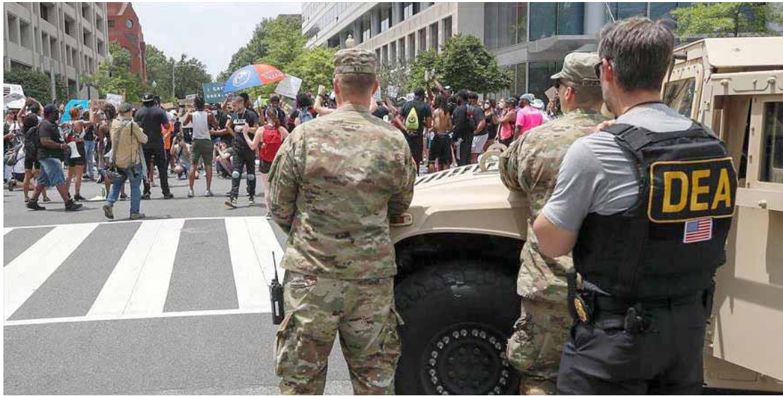
Racismo en la DEA de EEUU: llaman "monos" a los negros

Según el especialista en EEUU el racismo es utilizado para marginar a colectivos y mantener a la sociedad dividida en Estados Unidos