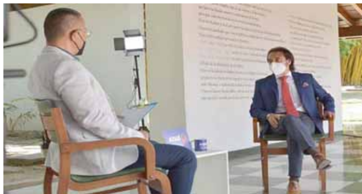
La entrevista fue muy amena

Dijo que cada vez que le toca hablar de la situación de Venezuela en España hace la misma