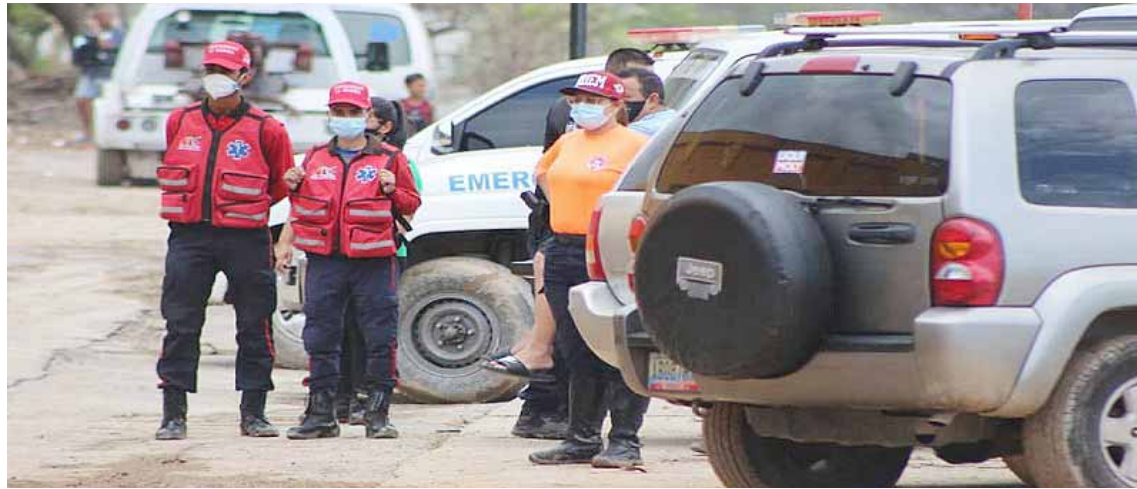
Funcionarios de seguridad están pendientes las 24 horas

En un video publicado en la cuenta de la gobernación en Twitter @Gob_Vargas, se indicó que los bomberos permanecen activos y se hacen trabajos de limpieza desde la noche del sábado 13 de marzo.