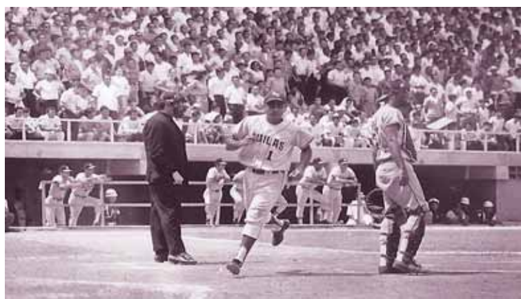
Águilas del Zulia alzó el vuelo en la LVBP en 1969

T/ Redacción CO