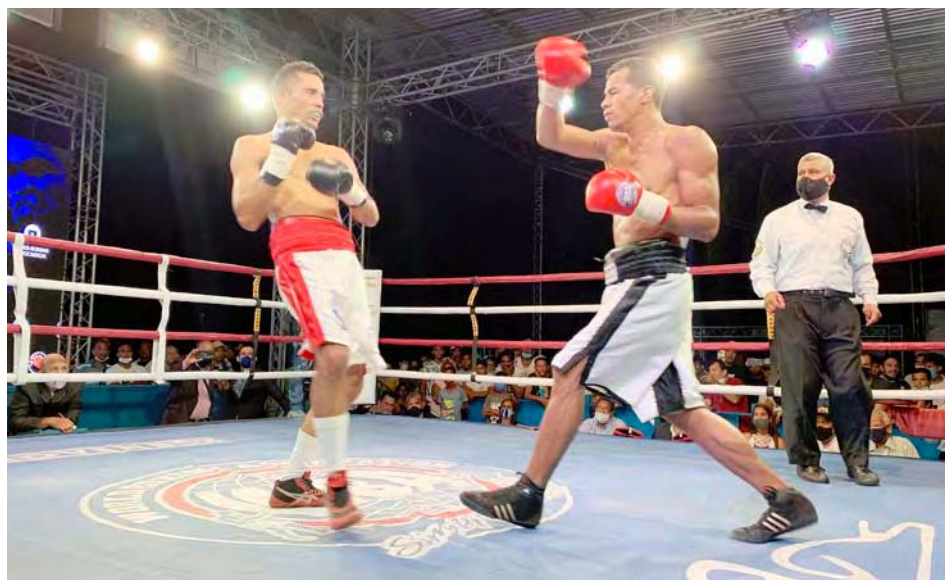
Los combates fueron muy reñidos