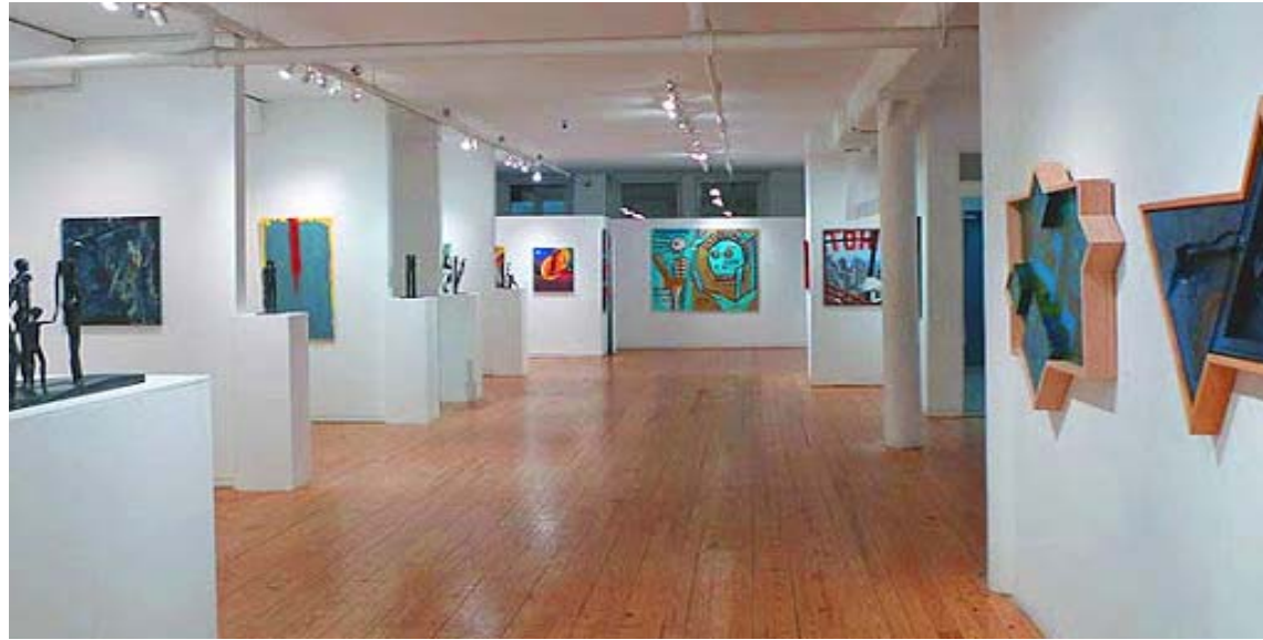
El evento generará una muestra que tendrá lugar en julio

El evento forma parte de las celebraciones de los 500 años de la primera circunvalación al globo terráqueo, de la que se tenga registro, emprendida por Fernando de Magallanes y Juan Sebastián Elcano. Una hazaña que redefinió para siempre las formas de concebir, percibir y visualizar el mundo. Una trave-