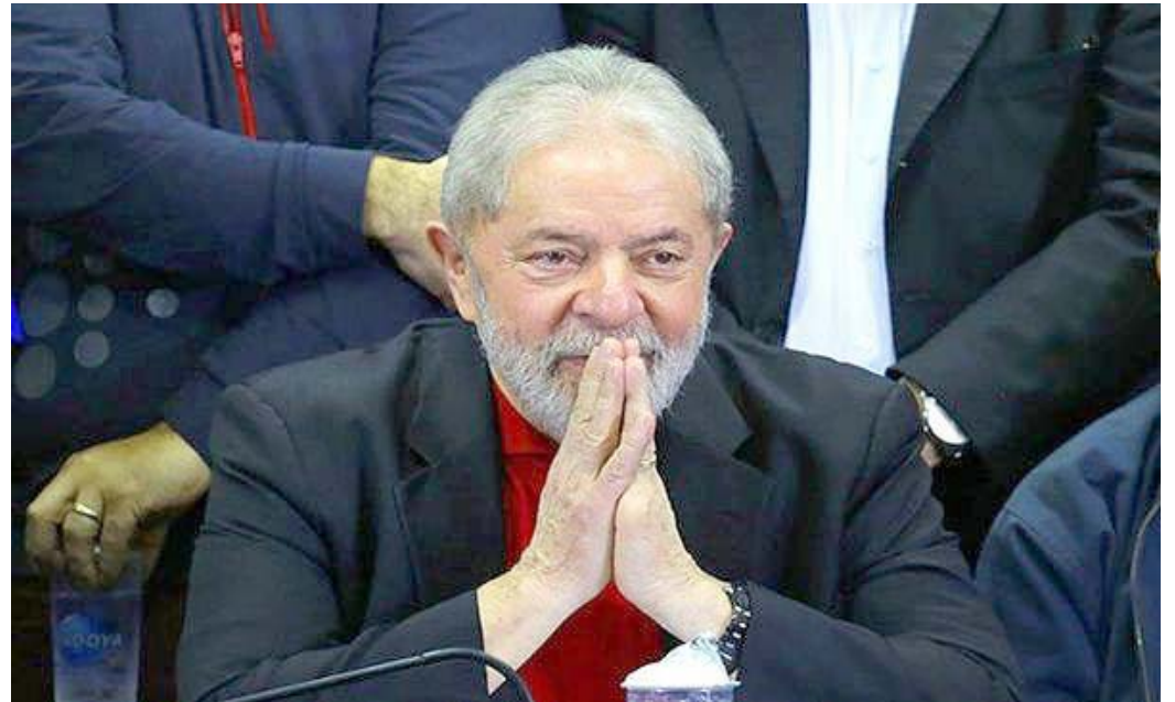
El juez de la Suprema Corte declaró nulas todas las decisiones dictadas por el Juzgado XIII Federal de Curitiba

Fachin declaró “incompetente” al 13er Tribunal Federal de Curitiba en los casos del triplex Guarujá, una hacienda en Atibaia y el relacionado con la sede y