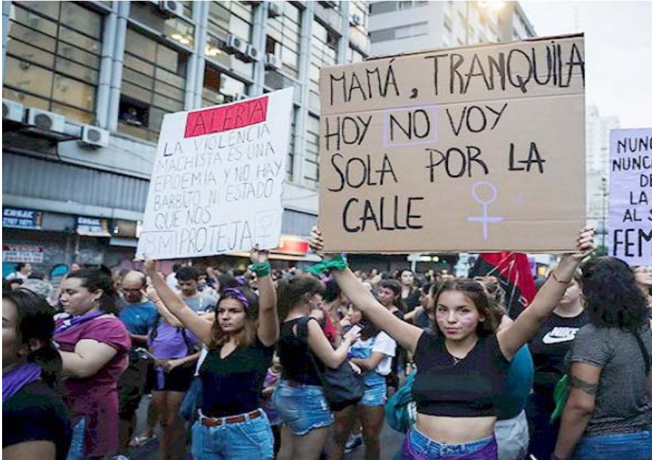
En su Día las mujeres latinoamericanas reclamaron sus derechos

Despenalización del aborto, igualdad de género y justicia en casos de violencia machista, fueron las demandas expresadas por las mujeres al celebrar el Internacional de la Mujer en varios países de América Latina