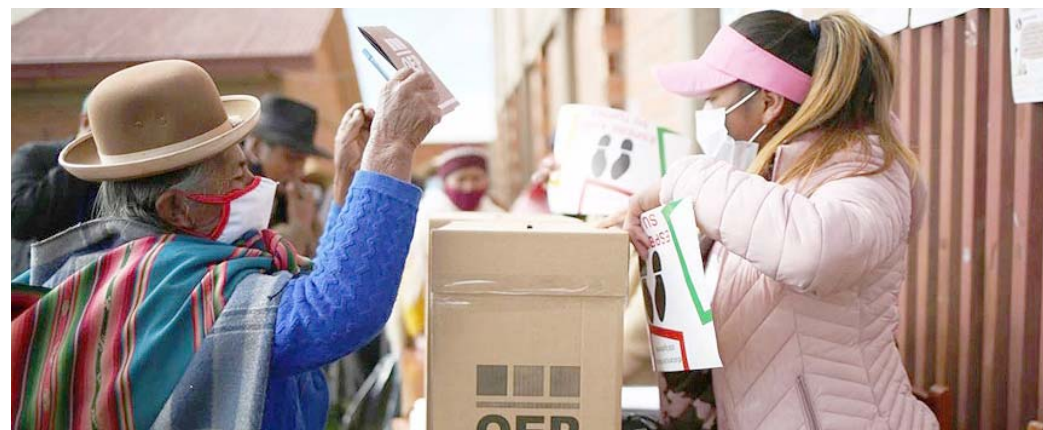
En Santa Cruz, Tarija y Beni triunfaron candidatos de partidos de la oposición