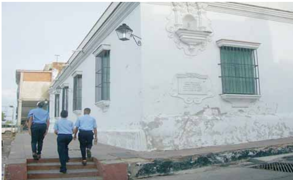
Casa del Correo del Orinoco en Ciudad Bolívar

tropas republicanas se mostraban impacientes en el mismo sentido”.