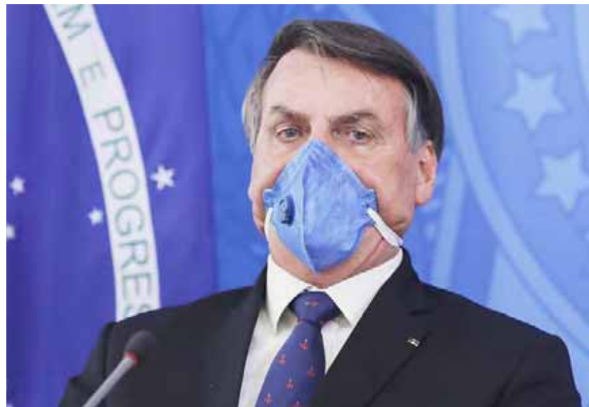
Organizaciones sociales consideran que Bolsonaro está promoviendo una tragedia humanitaria

Destacan que la pandemia ha provocado la pérdida de vidas y dificultades económicas y ha afectado de manera desproporcionada a las comunidades afrodescendientes, indígenas y a los más pobres