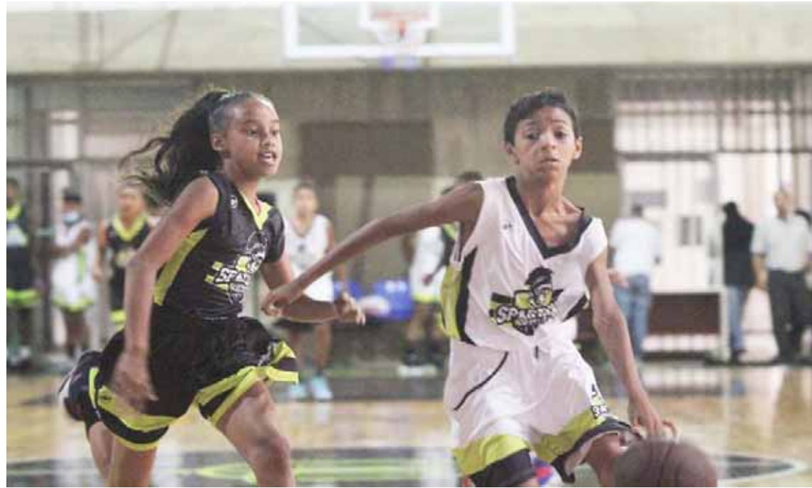
Un juego entre chamos reinauguró la cancha