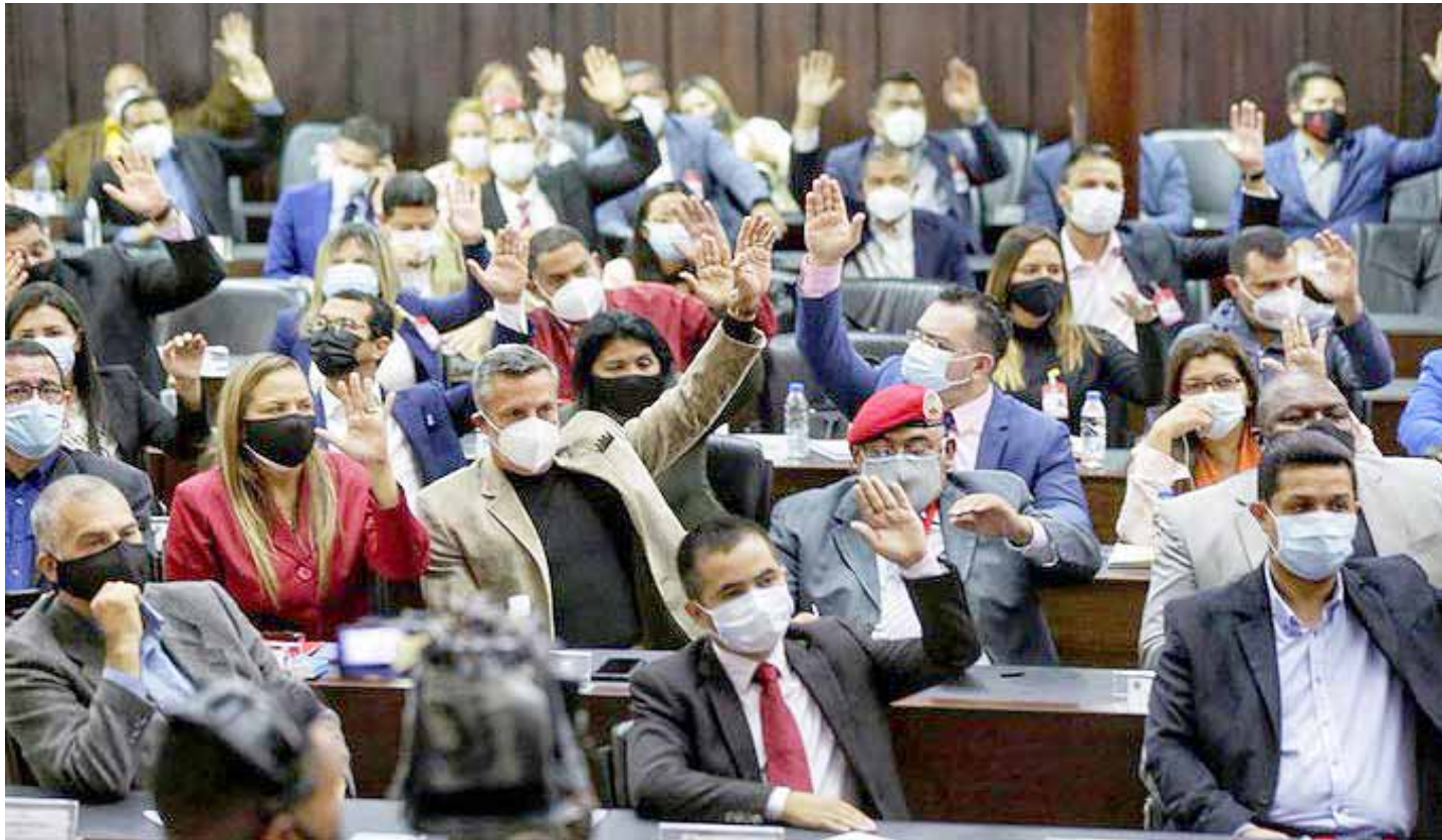
Prosigue proceso con los 74 candidatos seleccionados, señaló Rodríguez

Esta medida se debe a diversas causas, en particular a la pandemia de Covid-19, que impidió a varias personas presentar la documentación en el lapso estipulado