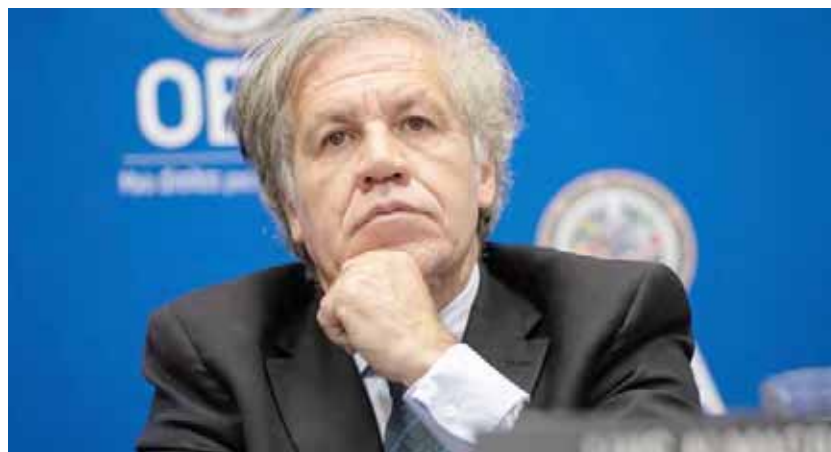
El gobierno boliviano denuncia que Luis Almagro de manera persistente interfiere en asuntos internos del país

T/ Redacción CO-Telesur F/ Cortesía agencia La Paz