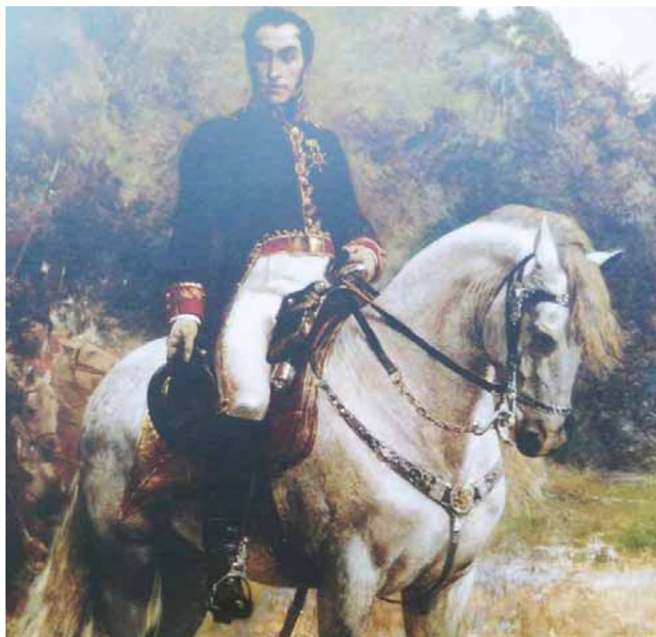
Bolívar en Carabobo, cuadro de Arturo Michelena

En uno de estos interesantes análisis publicado bajo el encabezado “Cartas de un Patriota”, “Sobre la cesión de las Floridas”, se habla de que en España se planteó vender tierras en América, entre ellas Margarita y la provincia de Guayana, con el fin de conseguir dinero para reconquistar las colonias insurrectas.