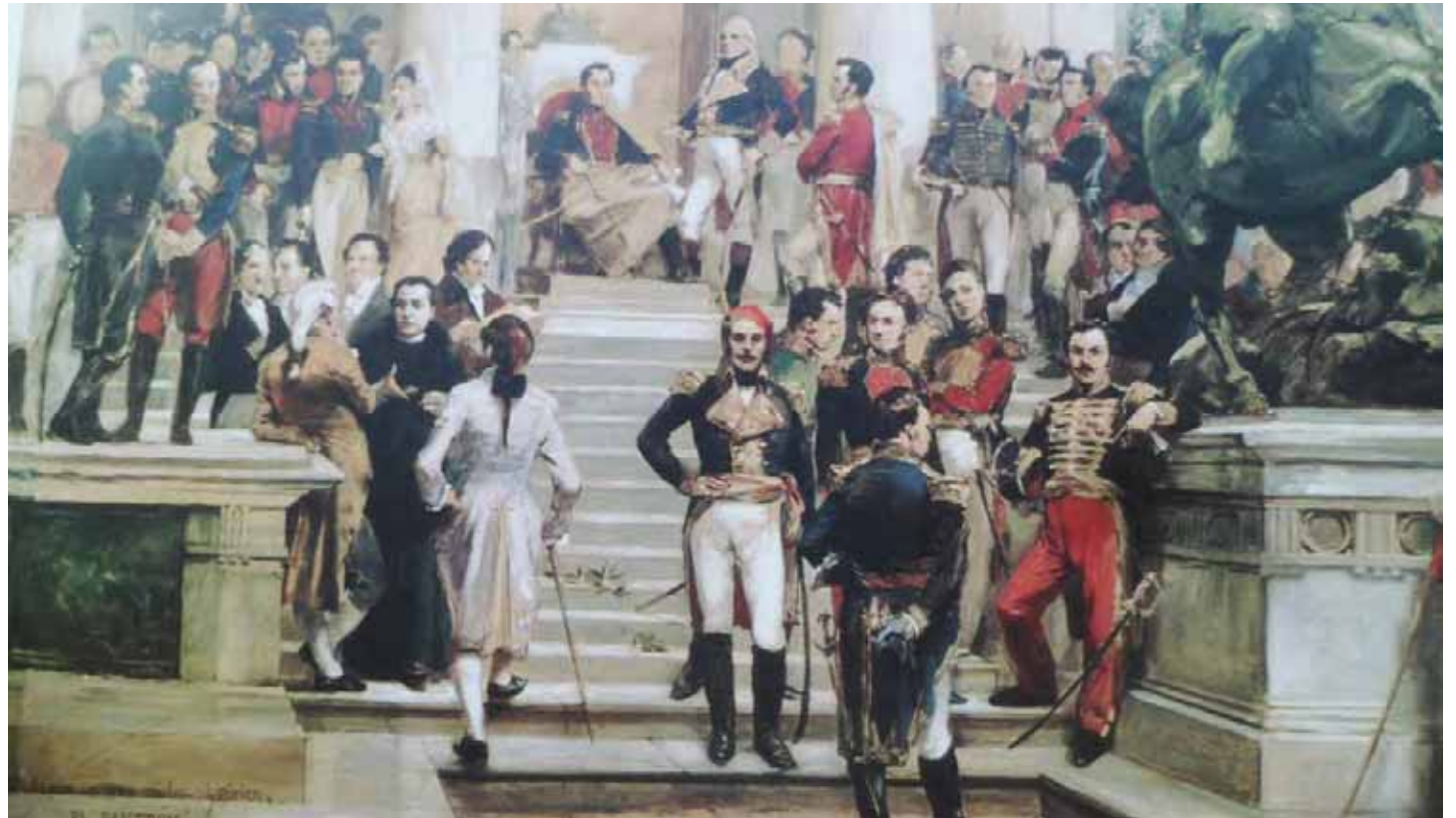
Panteón de los héroes, pintura de Arturo Michelena

El periódico angostureño, hoy una fuente viva de primera mano, además del seguimiento que hizo del proceso de la guerra de independencia, ocupó sus páginas con comentarios, noticias y análisis de las ideas de la época, incluyendo debates sobre los hechos políticos, la situación de España, los movimientos de Pablo Morillo, jefe de las tropas españolas en el suelo criollo, pero también incluía noticias de interés como, por ejemplo, la campaña de vacunación contra la viruela en Angostura, o la curiosa información proveniente de Europa de un carro que se mueve a vapor. También publica poemas y composiciones que exaltan los triunfos bolivarianos.