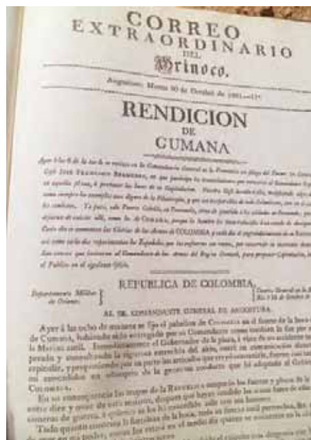
La rendición de Cumaná reseñada en número extra

El sábado 9 de diciembre se anuncia la toma de Carúpano, ocurrida el 25 de noviembre. El 20 de enero de 1821 se publica que en Guayaquil, las tropas unidas al pueblo proclamaron la independencia, mientras que el sábado 3 de febrero de 1821, el Correo del Orinoco reporta la