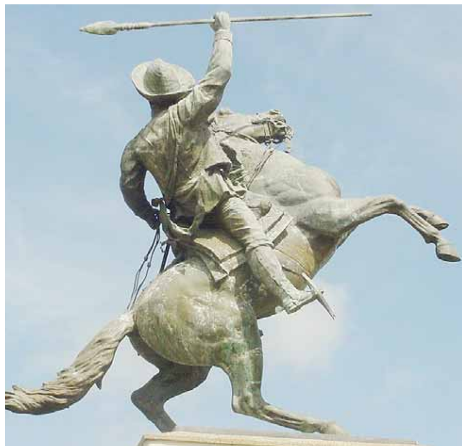
Estatua de Páez en San Fernando

Más adelante asevera: “La importancia del Caballo Criollo venezolano se basa en la incorporación a su genoma de la rusticidad producida por un proceso cercano a 500 años de selección natural, pues poco o nada hemos hecho nosotros.