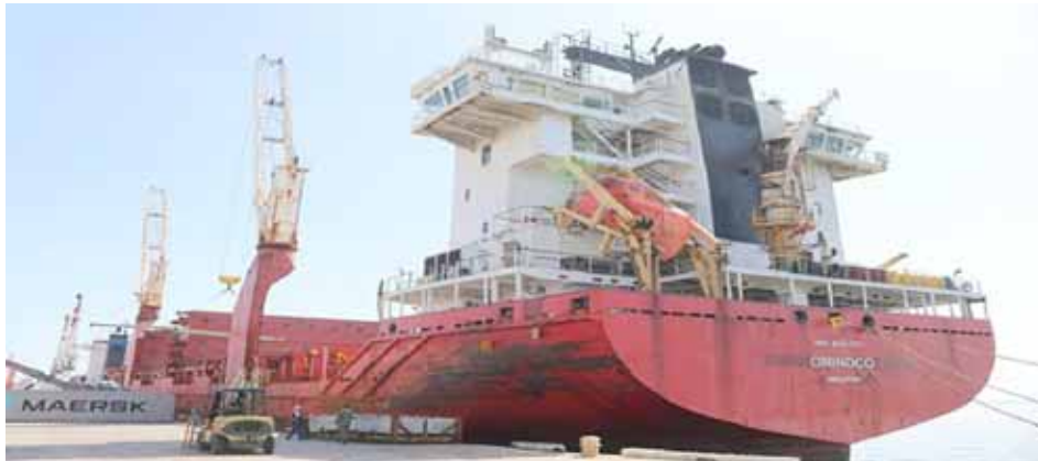
Bolipuertos trabaja fuerte todos los días del año