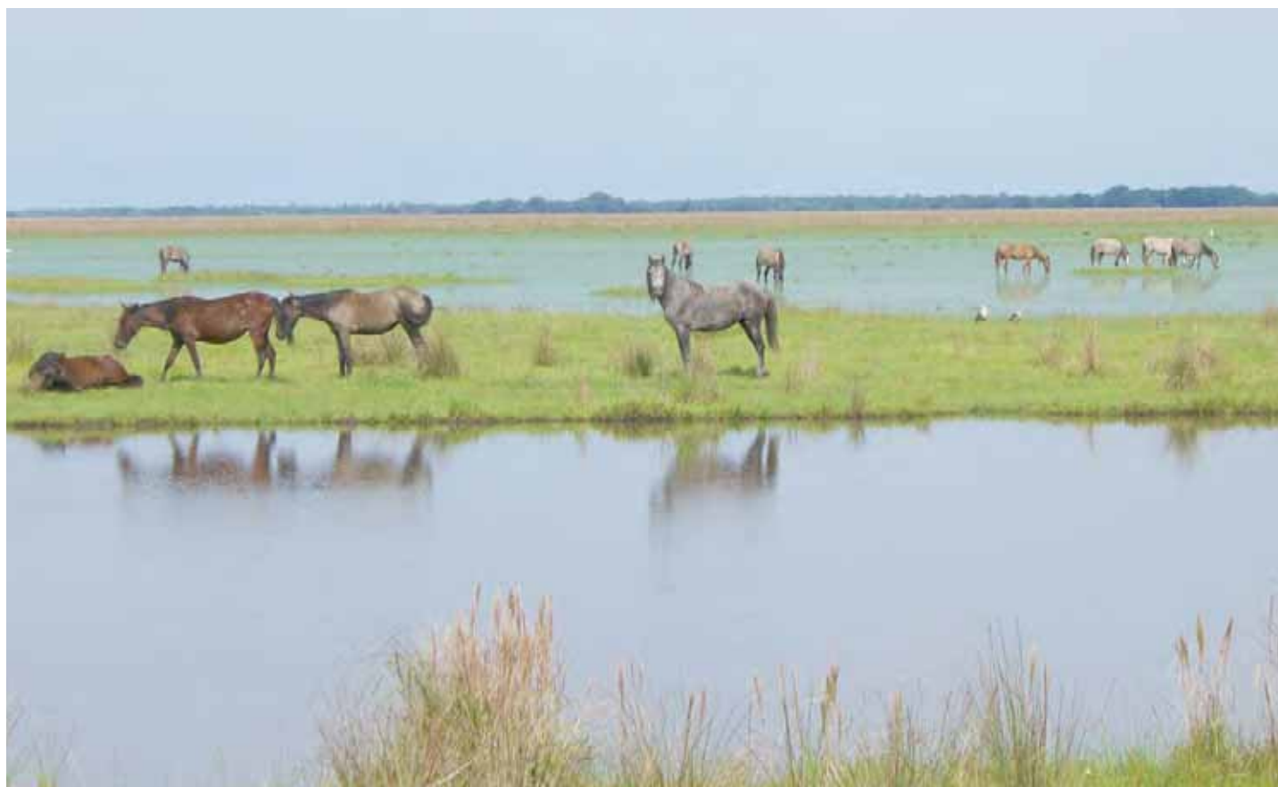
Caballos en los módulos de Mantecal

ción del petróleo y la sustitución del motor animal por el motor a gasolina. “Sus años dorados pasaron ya”, sostiene.