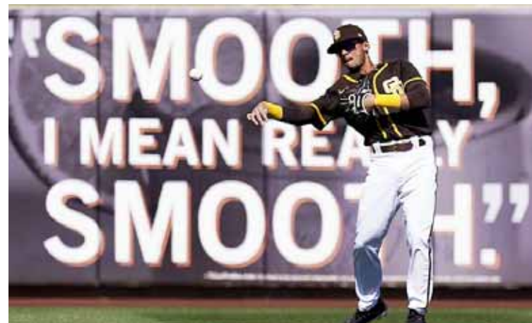
El prospecto ha mostrado versatilidad en el terreno