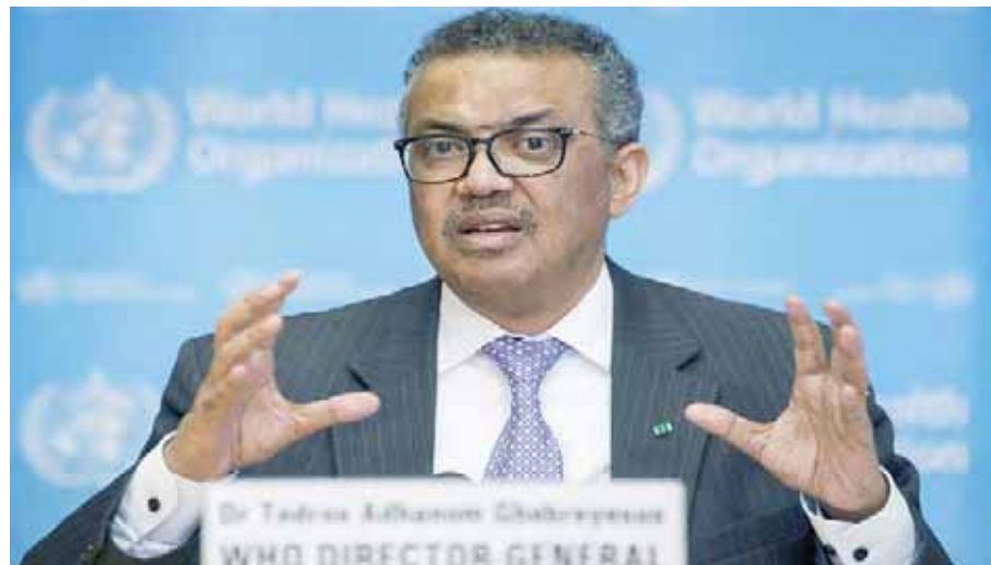
Concluyen que el virus llegó a los humanos a través de la cadena alimentaria en frío

“Se necesitarán más datos y estudios para llegar a conclusiones más sólidas”, advirtió el jefe del organismo. En cuando a la hipótesis de la fuga de laboratorio, dijo que aunque el equipo concluyó que era la menos probable, el asunto requiere más investigación potencialmente con misiones adicionales.