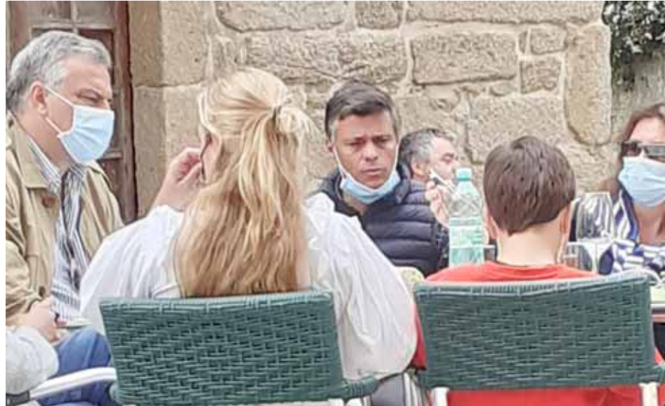
Leopoldo López fue multado por violar las medidas sanitarias

Los controles que la policía de Cambados hace con motivo del coronavirus arrojaron la tarde de ayer una sorpresa, la identificación del líder opositor venezolano Leopoldo López mientras comía, sobre las 15.30 horas, en la terraza de un bar de la villa del albariño. Los agentes se acercaron a uno de los locales que se encuentran en el entorno de Fefiñáns, donde había tres mesas ocupadas. Las dos primeras lo estaban por vecinos de Cambados, pero en la tercera había dos parejas y varios niños. Al pedirles la documentación fue cuando se percataron de que se trata-