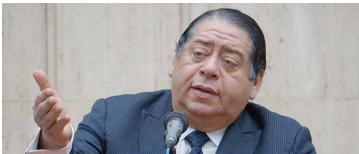
Entre las propuestas destaca la enmienda de los artículos 110 y 111 de la Constitución