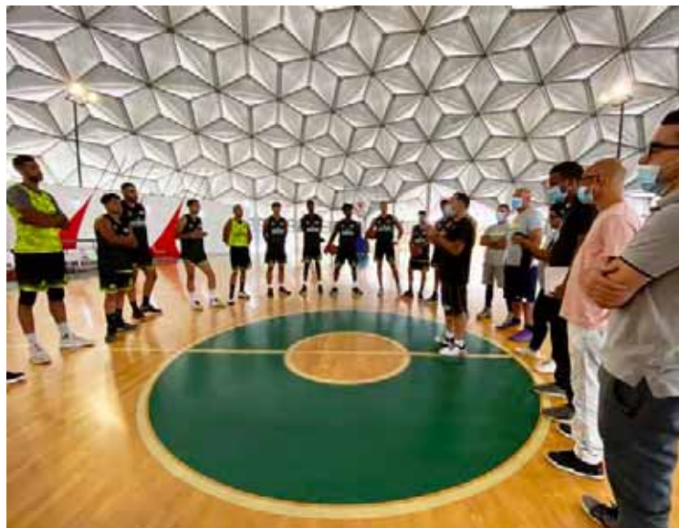
Nuevos talentos y veteranos se mostrarán en esta campaña