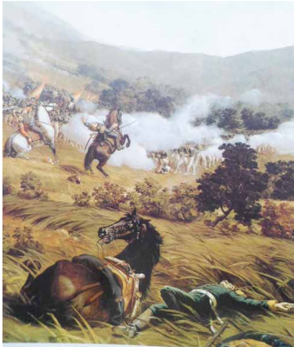
Escena de la Batalla de Carabobo, pintura de Martín Tovar y Tovar

El caballo, ese que estuvo en la Batalla de Carabobo y acompañó a nuestros soldados a lo largo de la guerra de independencia contra España, ocupa uno de los cuarteles del escudo nacional, aunque algunos sostienen que ese animal de blancura sin una pizca de mancha, con ese porte como para comandar desfiles pomposos no es el mismo de Carabobo, de Mucuritas, de Vuelvan Caracas, de Ayacucho, ni el que montó Juan José