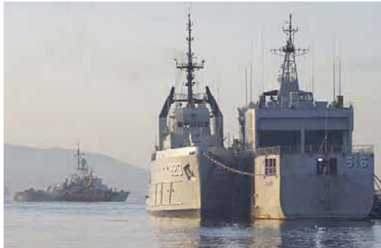
Buques de la Armada de Indonesia durante la búsqueda del submarino

Militares indonesios difundieron las imágenes captadas por un vehículo operado por control remoto que muestran los restos del submarino hundido KRI Nanggala (402), que desapareció esta semana cerca de la isla de Bali cuando se preparaba para realizar un simulacro de torpedeo.