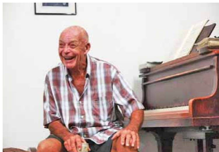
Weil tiene otros discos emblemáticos creados en la década de los setenta

Y no dice mentiras este caballero con más de ocho décadas de existencia, pero sigue tan vital desde que llegó al país hace 64 años. Este disco de jazz fusión que marcó pauta en el género cuando salió en 1971, fue relanzado por Olindo Records, un sello discográfico con base en Londres y Caracas que se interesa por hacer memoria y rescatar las producciones que han sido piezas fundamenta-