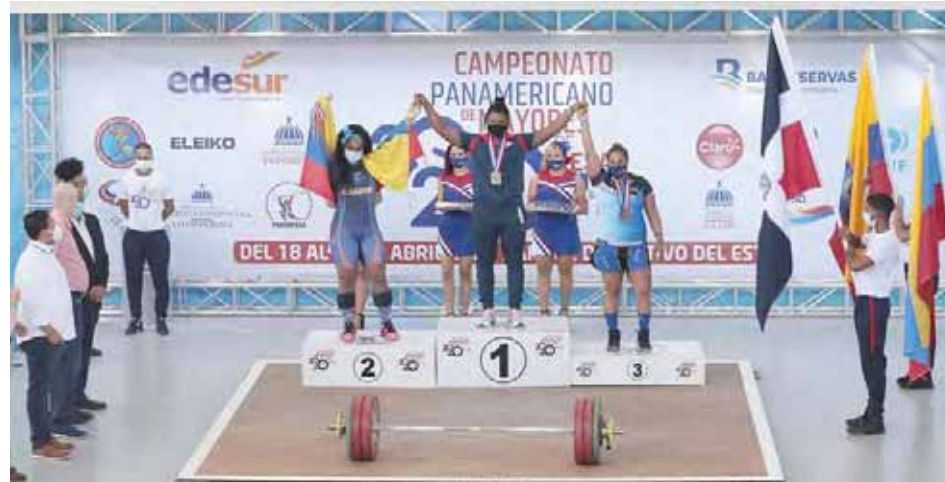
Venezuela se montó en el podio varias veces

“Me siento muy contenta con el resultado. En el arranque siempre me había mantenido entre 105 y 106 kilos, y aquí pude hacer 109, y en el envión, aunque