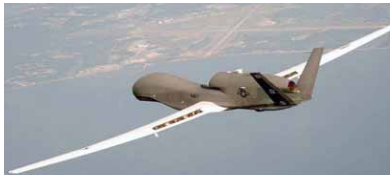
La OTAN y Estados Unidos siguen estimulando el conflicto entre Moscú y Kiev

Conforme al reporte, el Ejército ruso aplicó unas contramedidas electrónicas muy poderosas para