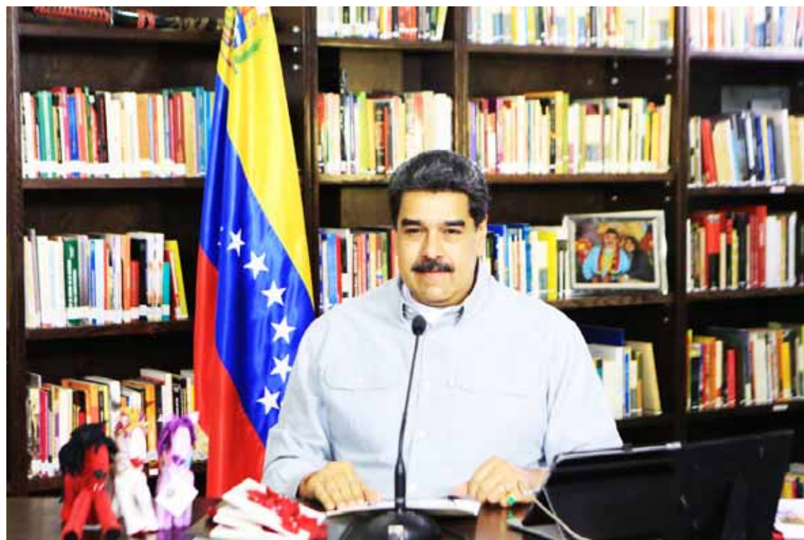
El presidente Maduro considera que la oración ayudará a la paz para Venezuela

Eso sí, recordó que “la pandemia está cruda, y que nadie puede cansarse de cuidarse, que nadie se rinda. “Aparentemente tenemos controlada esta segunda ola, pero no es así. Tenemos el método 7+7, que ha funcionado muy bien. Cada país