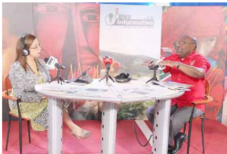
Se ha pretendido desvirtuar la verdad, destacó Díaz