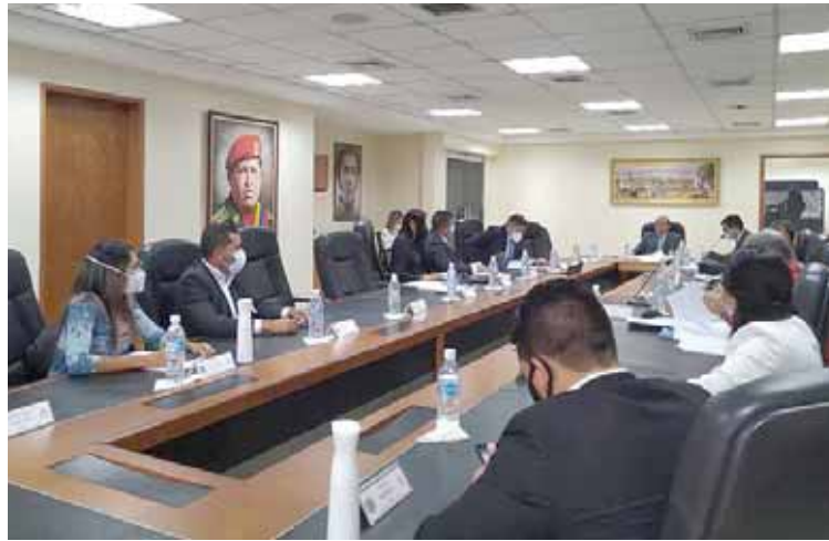
La AN diseña sistema integral que permita atacar la corrupción

T/ Leida Medina Ferrer F/ Presidencia AN Caracas