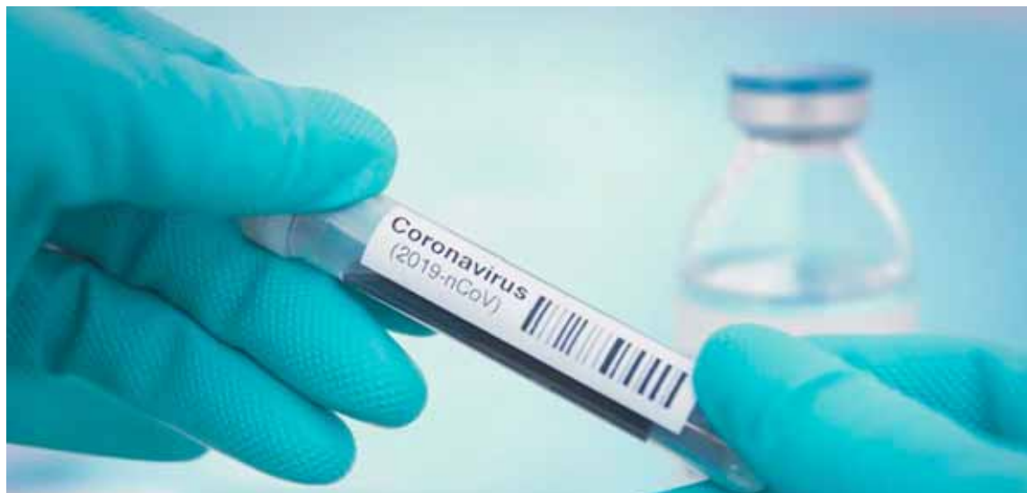
Las variantes del coronavirus más conocidas son la británica, sudafricana y brasileña

“Llevamos años diciendo que la ubicación no debe ser el nombre del patógeno. Estamos trabajando en el desarrollo de una nomenclatura para cada variante. Sin embargo, pensaba que iba a ser fácil, llevamos dos meses para lograrlo, si bien esperamos anunciarlo muy pronto”, aseveró.