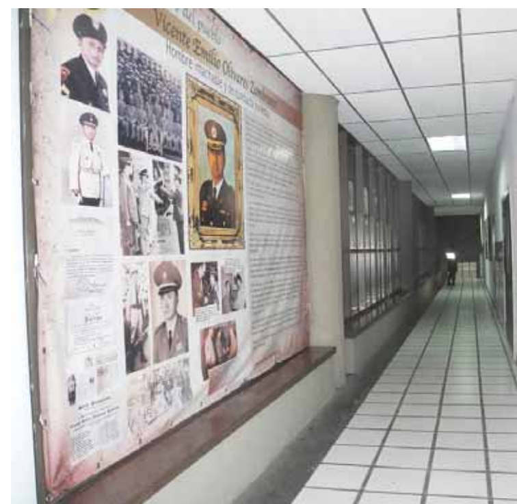
En el museo cuenta con visitas guiadas, cursos y talleres de formación

Para ser parte de esta maravillosa iniciativa de los integrantes del CPNB y acceder a las visitas guiadas, actividades formativas y conocer la histo-