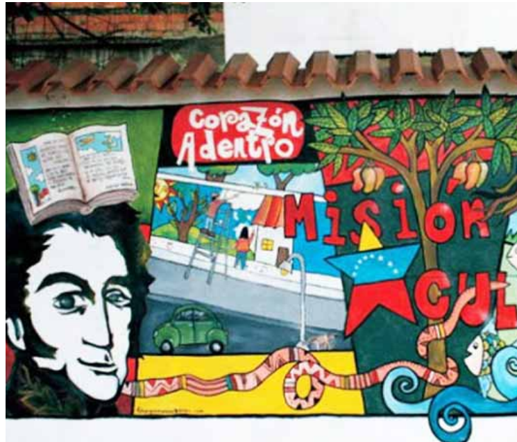
La Misión Cultura Corazón Adentro cumple 13 años

Precisó la coordinadora que a pesar de los necesarios ajustes en el quehacer de los instructores de arte durante la pan-