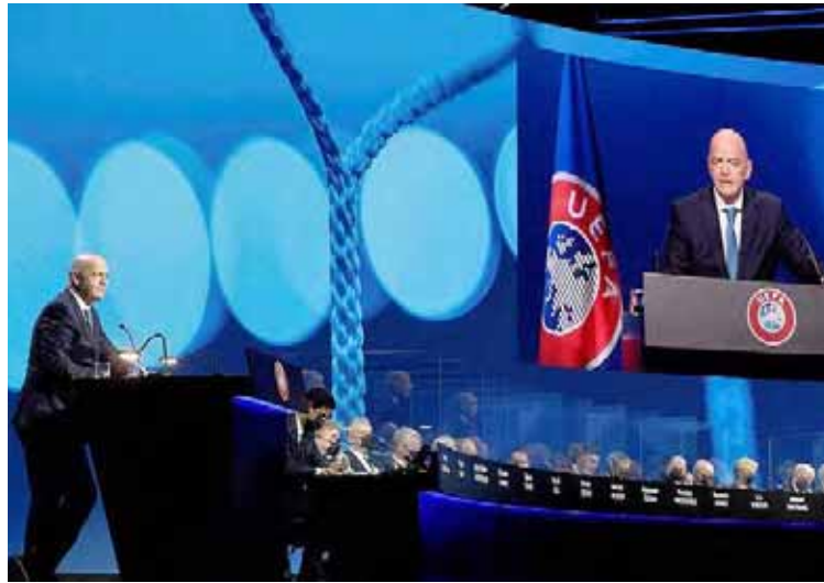
El presidente de la FIFA, Gianni Infantino

Desde que se anunció la creación de la Superliga europea, formada en principio por 12 clubes,