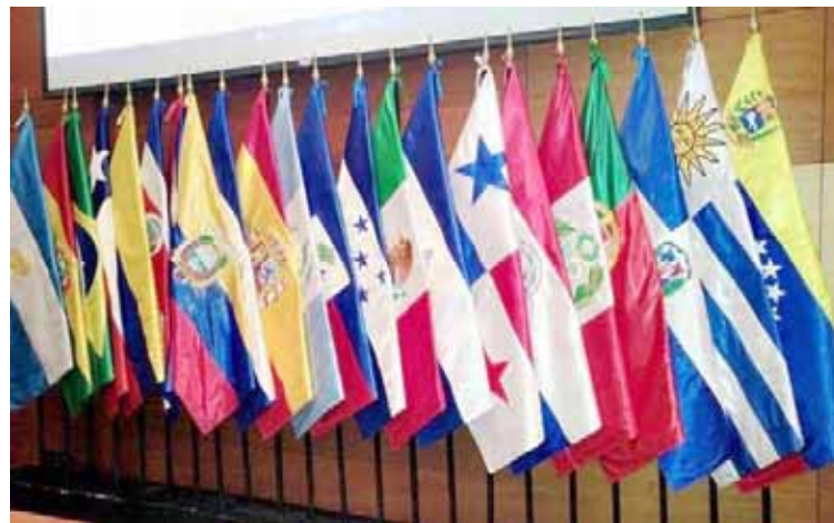
La mayoría de los presidentes de América Latina participarán de forma virtual

T/ Redacción CO-AFP-Telesur