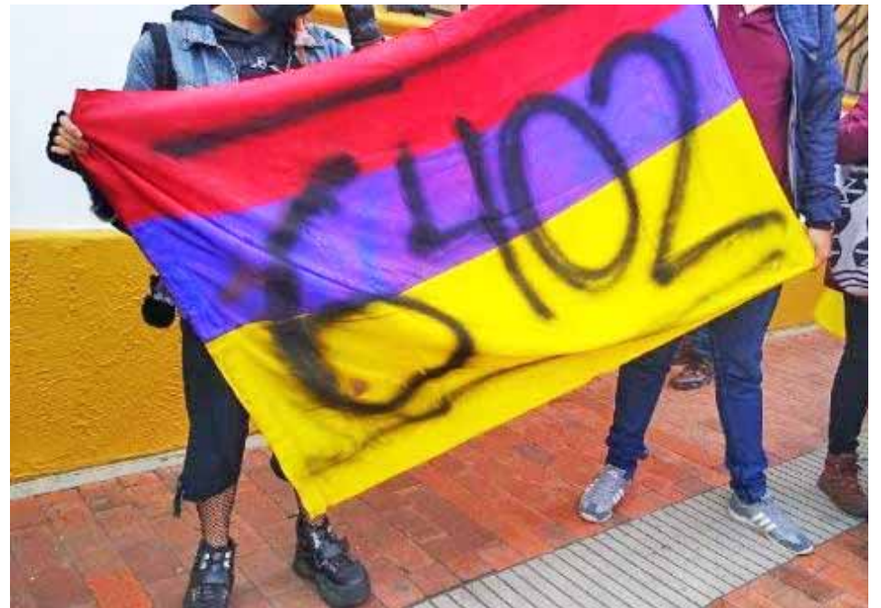
La violencia ocurre en territorios donde operan organizaciones criminales y no hay presencia militar

Según el sondeo del Instituto de Estudios Peruanos (IEP) y publicado en el diario La República, el 41,5 por ciento