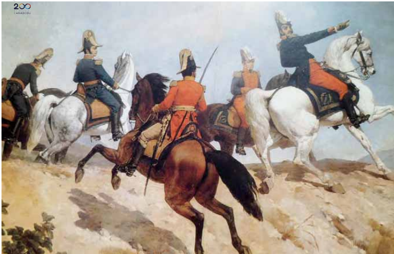
Bolívar en Carabobo con su estado mayor, óleo de Martín Tovar y Tovar