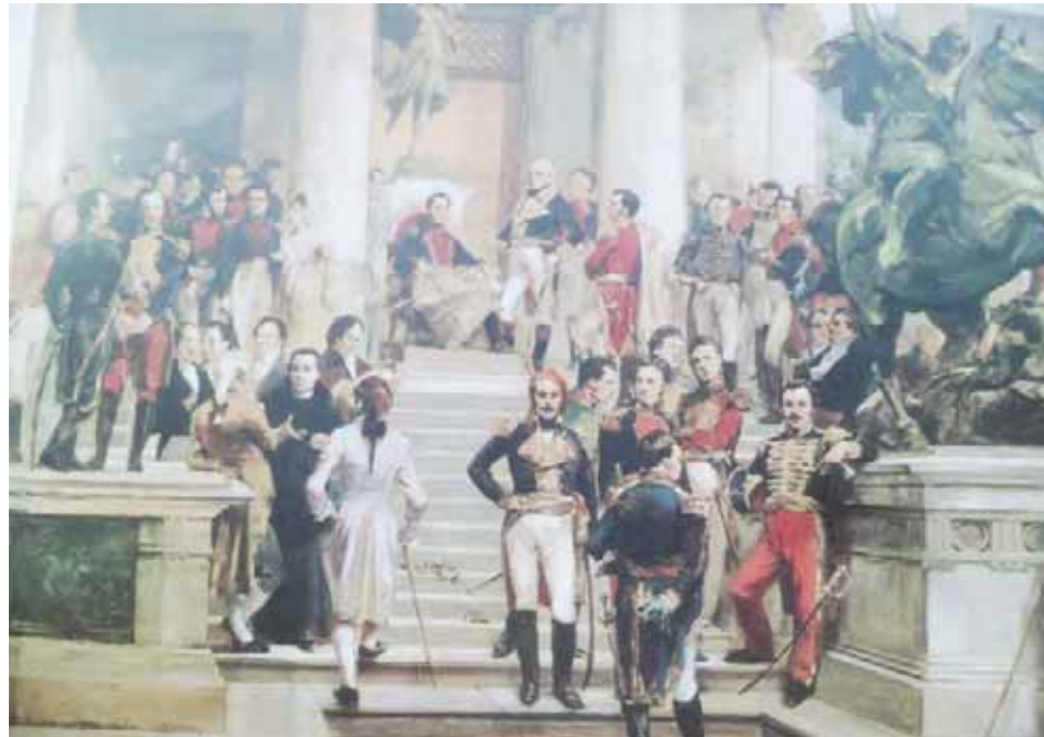
El Panteón de Los héroes, cuadro de Arturo Michelena

Liévano Aguirre asienta que “hasta ese momento decisivo, impresionado por confusos anhelos de grandeza, Bolívar imaginó vagamente algunas veces la posibilidad de emprender obra tan colosal como la de libertar a su patria; pero siempre la propia insignificancia de su posición redujo ese anhelo a la calidad de simple sueño, de esos que agradablemente iluminan nuestra fantasía. Pero ahora, el natural optimismo de su carácter y la embriaguez que le dominaba en la proximidad de aquellos sitios impregnados de historia destruyen los últimos temores sobre su propia impotencia, y su voluntad, lanzada con seguridad hace