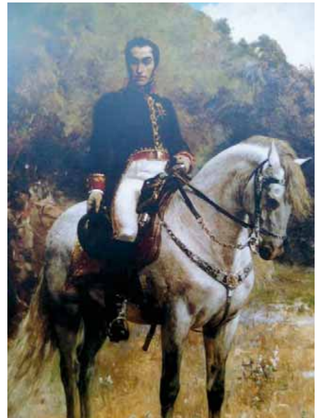
Simón Bolívar de Arturo Michelena

El Libertador en 1895 se comprometió en Roma a liberar a Venezuela del yugo español