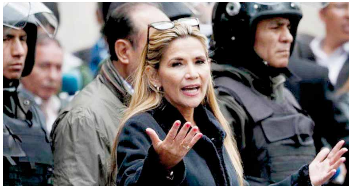
El sistema penitenciario rechazó la solicitud de Añez para ser trasladada a una clínica