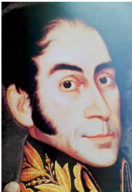
El Libertador, patillas, ojos penetrantes

cima conversan sobre la sucesión de las civilizaciones, su apogeo y su declinación a través de los siglos...”