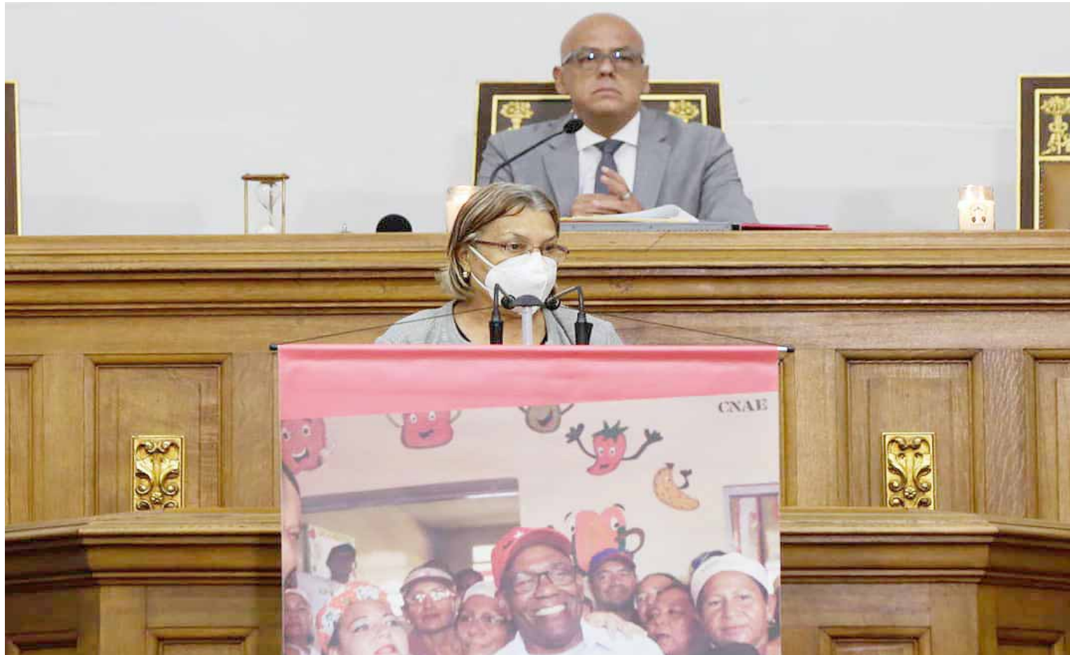
Aristóbulo Istúriz es un ejemplo de lucha, enfatizó Requena

El presidente del Parlamento Nacional, Jorge Rodríguez, anunció que se conformará una Comisión Especial, presidida por la parlamentaria Tania Díaz, para recabar el acervo histórico, político, cultural y de gestión del profesor Istúriz