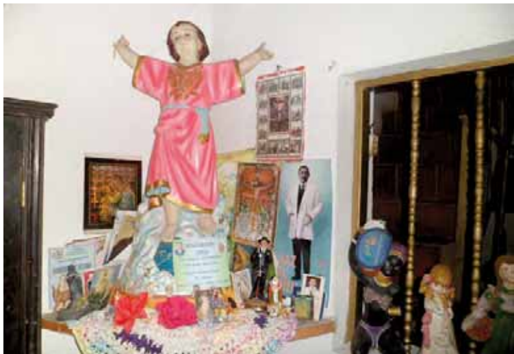
En la mayoría de los hogares venezolanos no falta el altar con la figura del santo