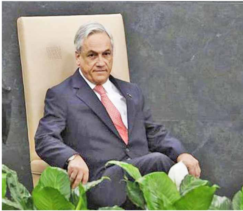
Las organizaciones sociales piden justicia ante los crímenes cometidos por el Gobierno de Piñera

Mediante un comunicado los denunciantes afirmaron que “los homicidios, la tortura, los traumas oculares, mutilaciones y pérdidas de visión, las lesiones graves, las detenciones arbitrarias, cometidas por agentes estatales en contra de miles de habitantes, representan violaciones masivas graves y sistemáticas de los derechos humanos”