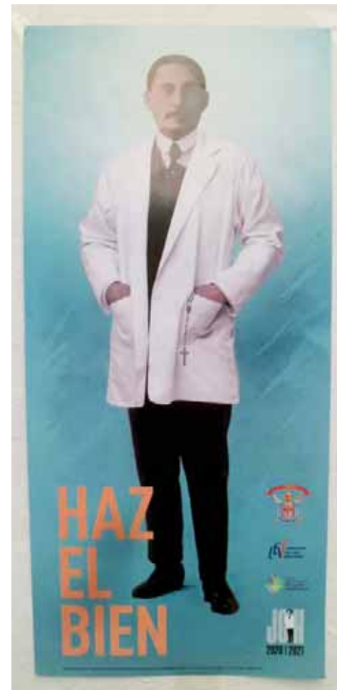
La iglesia venezolana presentó la imagen de José Gregorio Hernández

La ceremonia de beatificación del “santo de los pobres” ha levantado gran expectativa en Venezuela