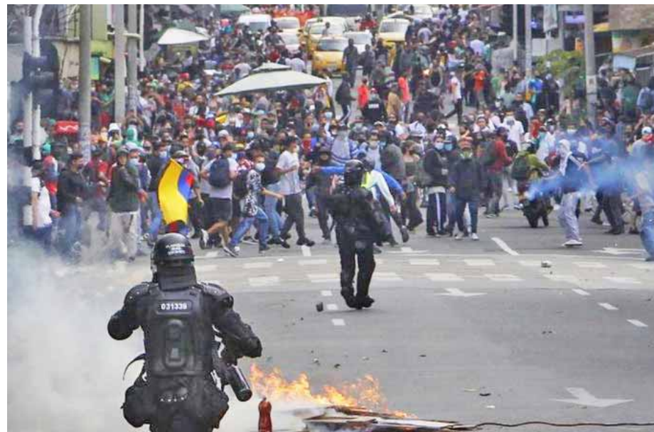
En Colombia continúan las protestas contra el paquetazo impulsado por el presidente Iván Duque

Los sindicatos también anunciaron que marcharán el 1 de Mayo, Día Internacional de los Trabajadores, en las ciudades que no estén bajo confinamiento