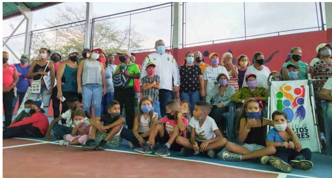
Los niños serán los principales beneficiados