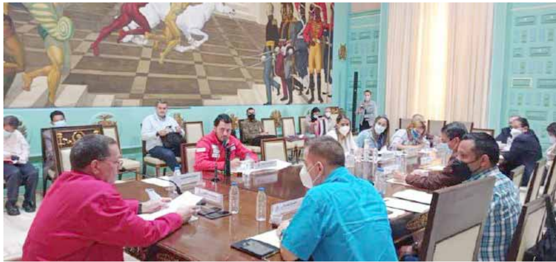
Es necesaria una legislación que regule el comercio electrónico, estimó Faría

T/Leida Medina Ferrer