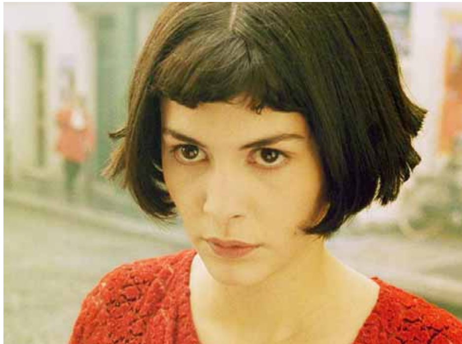
Ofrecerán también una exhibición de los títulos preferidos por el público

La selección de películas incluye temáticas muy variadas como biografías e historia, en la que se inscribe la película invitada, Resistencia, tercera producción del director venezolano Jonathan Jakubowicz, sobre una faceta que poca gente conoce de Marcel Marceau, quien antes de convertirse en estrella de la mímica, ayudó a numerosos niños huérfanos a escapar de los nazis. El filme cuenta con un reparto internacional en el que destacan: Jesse Eisenberg, Clémence Poésy, Matthias Schweighöfer, Félix Moati, Bella Ramsey y Ed Harris.