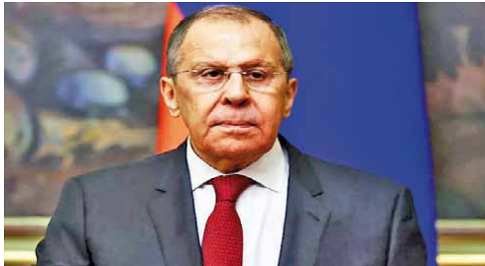
“No nos queda otra opción, sino responder con hostilidad”, dijo el canciller ruso Serguéi Lavrov.