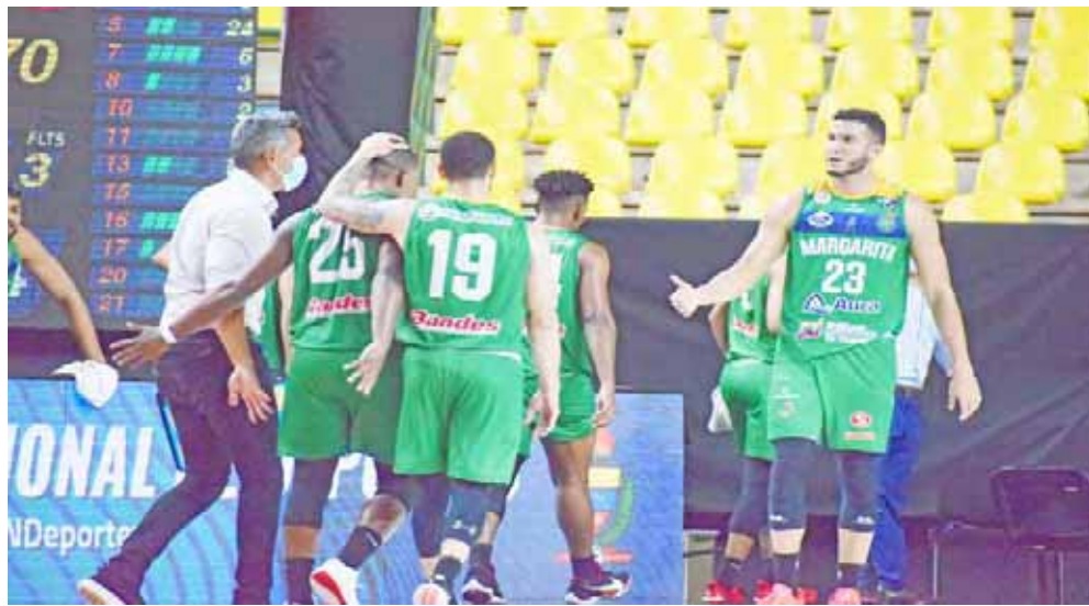
Los insulares muestran un gran juego de conjunto.

Cocodrilos de Caracas se medirá contra Bucaneros de La Guaira