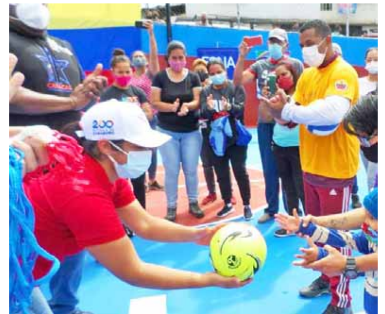
La práctica del deporte debe llegar a cada rincón del país

Recordemos que el Plan Caracas Patriota, Bella y Segura incluye la recuperación de