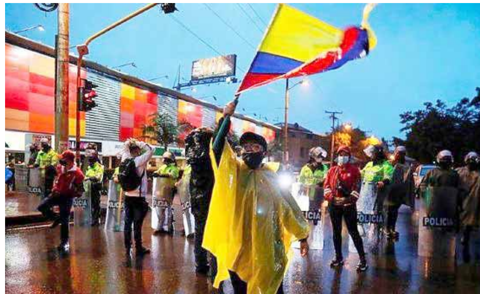
En varios países se han realizado marchas en apoyo al pueblo colombiano y en rechazo a la violencia

También se sumó al repudio de los actos represivos, la Oficina para América y el Caribe de la Federación Democrática Internacional de Mujeres, y la vicepresi-