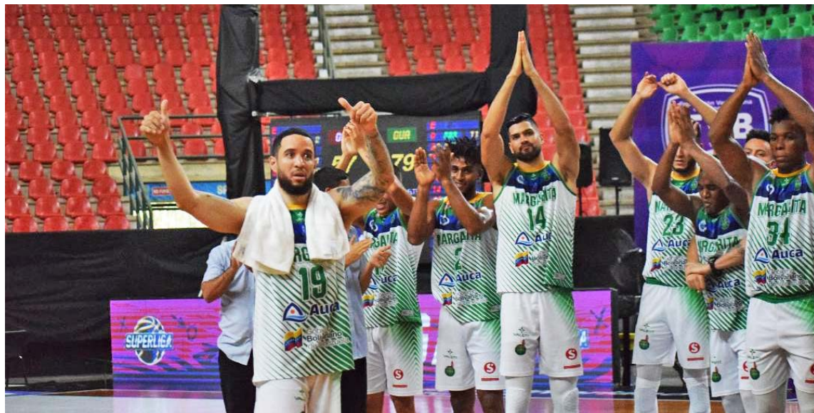
Los insulares celebraron su merecido arrase

Por si fuera poco, aumentó a 20 su colección de éxitos en ronda regular (contando los cuatro que dejó durante el primer certamen de este torneo), dejando atrás las 19 que impuso Marinos de Oriente en la temporada 1991, todas en una misma zafra y todavía record en un solo torneo.