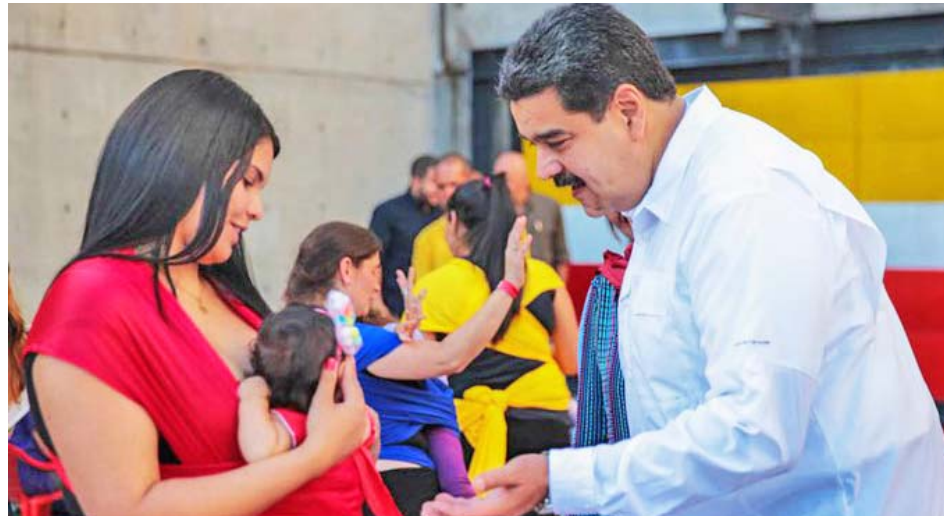
Maduro considera que la clase obrera “debe estar siempre unida”

“En el siglo XXI estamos con grandes tareas para seguir enfrentando el neoliberalismo y sus tendencias inhumanas discriminatorias que explotan a los pueblos del mundo y que han hundido a países de nuestro continente, que han ocasionado que el despertar de los pueblos se sienta con mayor fuerza”, resaltó.