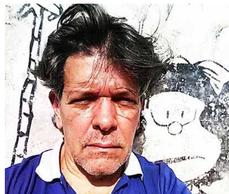
Se realizarán actividades para niños, talleres para adultos y otras más