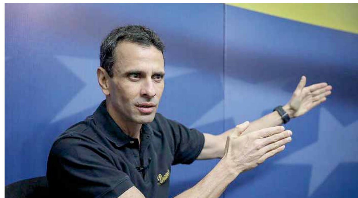
Según Henrique Capriles la oposición está en su momento más crítico en 22 años

El interés del Gobierno nacional en sumar la mayor cantidad de actores políticos a los canales institucionales, aun siendo adversarios, tiene valía si proporciona más argumentos para denunciar a los agentes extranjeros que siguen promoviendo el conflicto beligerante y el asedio multifactorial en el país.