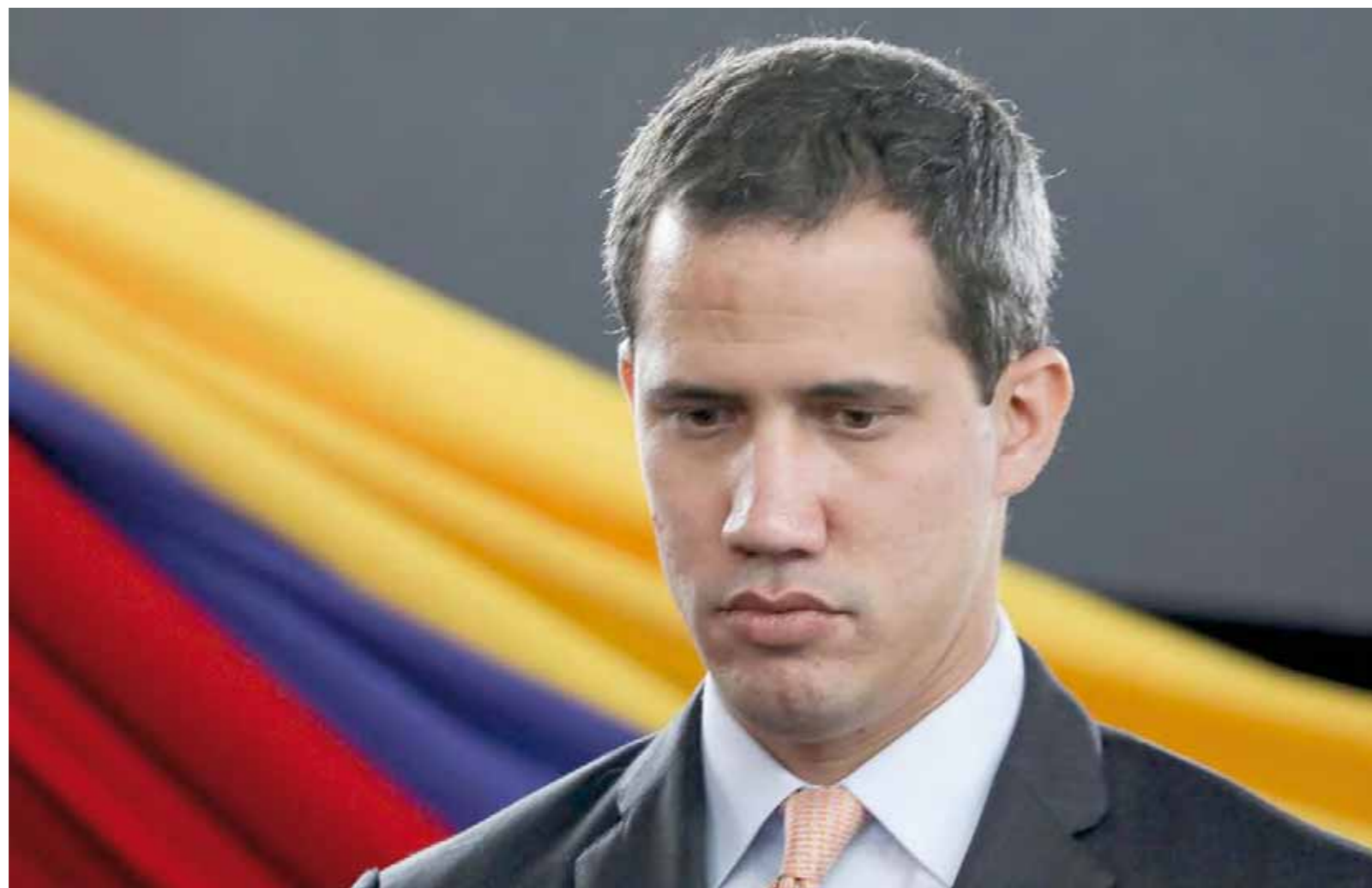
Exdiputado Juan Guaidó

Henrique Capriles Radonski, dirigente del partido Primero Justicia, en una entrevista para el periódico español El País, expone específicamente el error que cometió el antichavismo al apostar a salidas inconstitucionales,