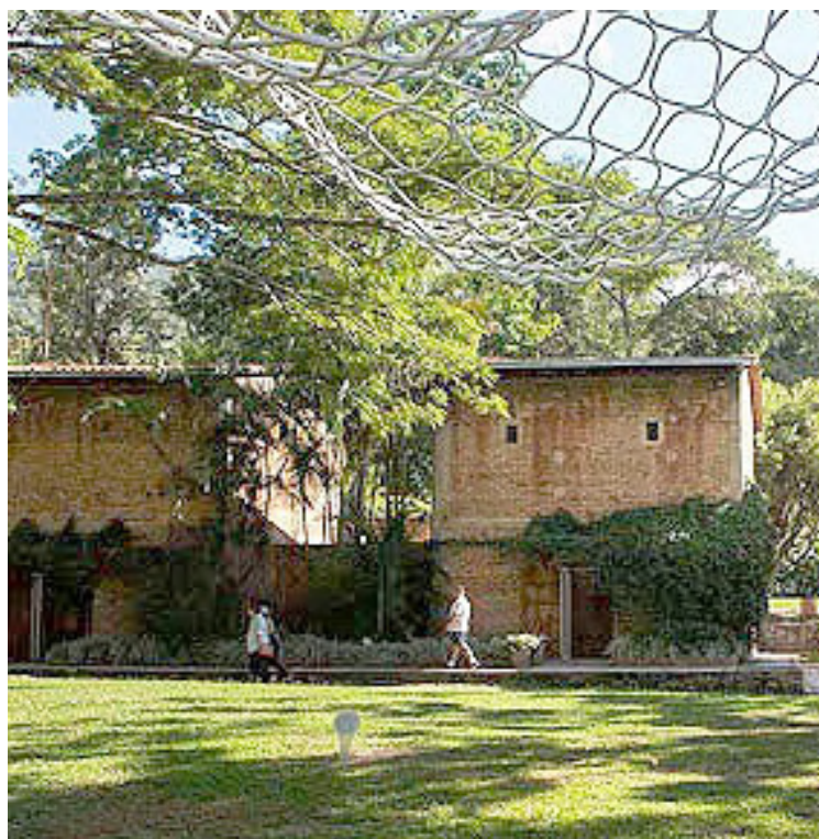
La exposición gratuita se iniciará a finales de junio en el Parque Cultural de La Trinidad

En el conjunto de propuestas “nos encontramos, tal y como lo propone el argumento del concurso, con nuevos mapas y representaciones: formas diversas de relatar la historia, aparición de lugares extraviados, revelación de otras geodestas e identidades en el surgimiento de ámbitos nunca vistos, originales modos de aproximación y de una nueva navegación, los cuales ahora se levantan como un soporte