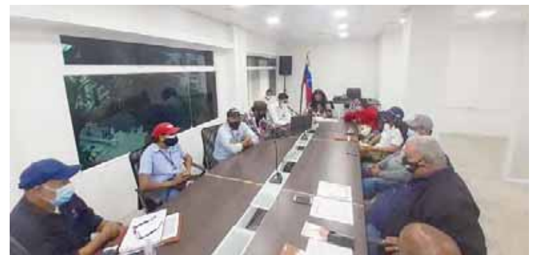
Trabajadores del sector eléctrico apoyan conver a Petros prestaciones sociales

Una de las peticiones más sentidas de los trabajadores, destacó, está vinculada a las propuestas que ha generado el Ejecutivo Nacional con respecto a las nueve líneas de trabajo,