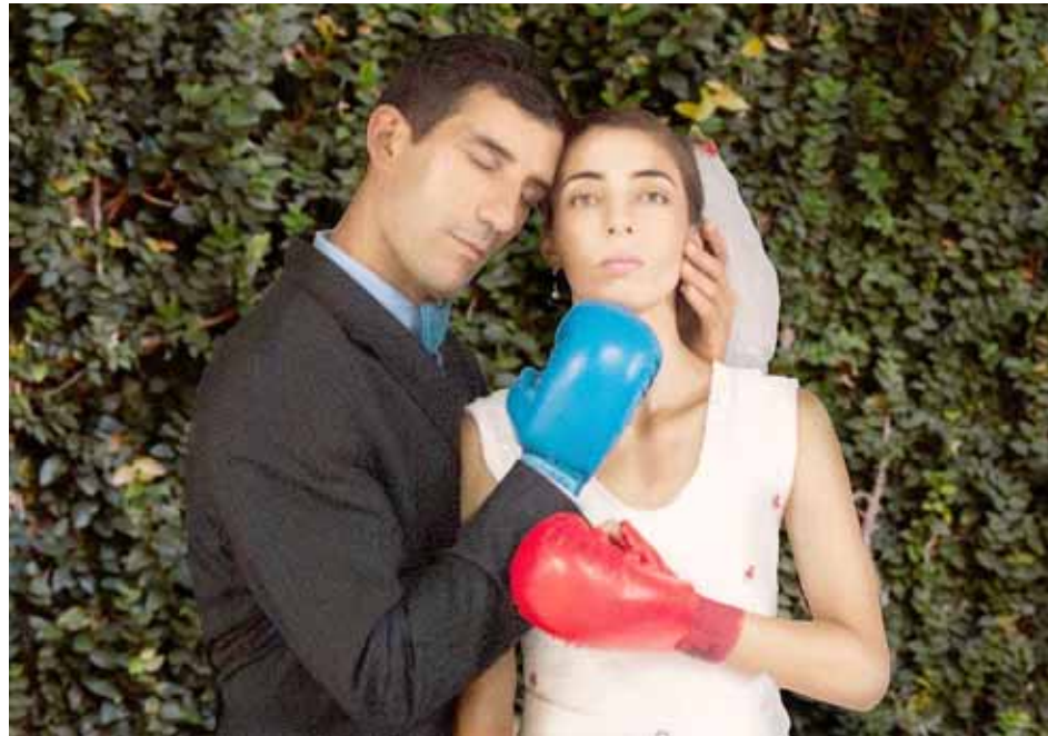
Los intérpretes debieron aprender sobre boxeo para esta propuesta

“Cuando se está en un mundo donde no están penados los golpes bajos, el chantaje, los abusos ni la falta de piedad, lo que queda es luchar o acostumbrarse.