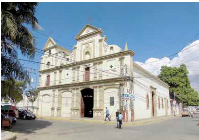
Iglesia de San Pablo en Tocuyito