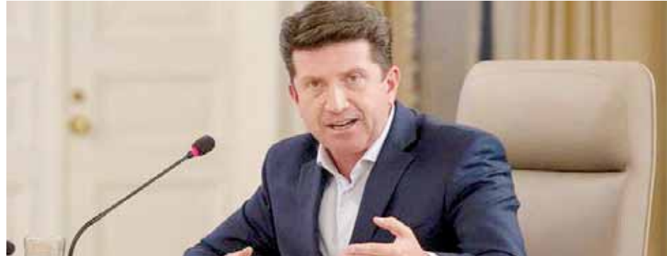
Legisladores consideran que es responsable de los abusos de soldados y agentes del Esmad contra el pueblo

T/ Redacción CO- Agencia Rusia Today