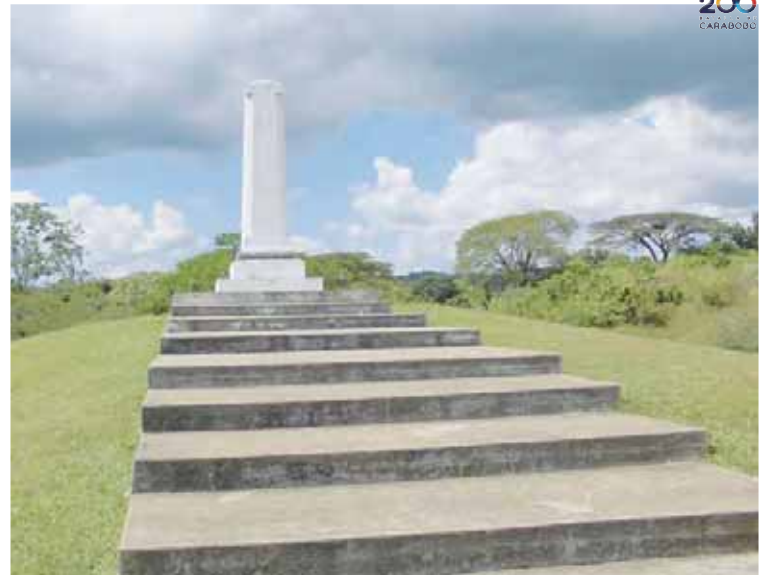
Monolito donde murió el Negro Primero en el campo de Carabobo

En una ponencia titulada “Rasgos socio-antropológicos del Negro Primero” (En el marco del traslado simbólico de sus restos), presentada durante un simposio realizado en Tocuyito, estado Carabobo, el profesor Omar Ydler describió a Pedro Camejo, “El Negro Primero”, como “fornido y vigoroso, for-