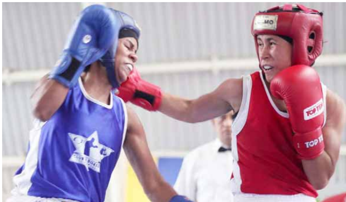
Grandes púgiles nacionales y foráneos han pasado por este certamen