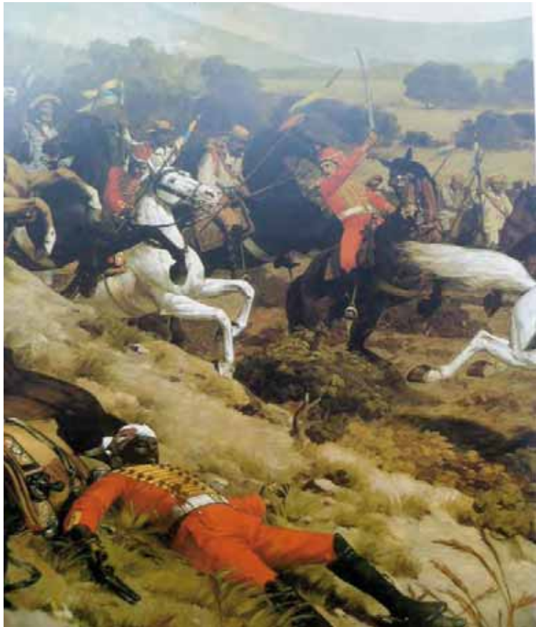
Detalle del mural de Martín Tovar y Tovar

Echenique observó que con la entrada del Negro Primero al Panteón se le rinde homenaje igualmente al llanero y al pueblo apureño, cuyos aportes a la causa de la independencia son incuestionables. Camejo se convirtió en el primer apureño en ocupar un espacio en el recinto sagrado del Panteón Nacional.