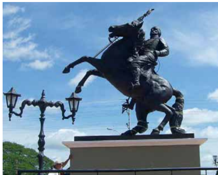
Estatua del Negro Primero en San Juan de Payara

“El día de la batalla”, narra Páez, “a los primeros tiros, cayó herido mortalmente, y tal noticia produjo después un profundo dolor en todo el ejército. Bolívar cuando lo supo, la consideró como una desgracia y se lamentaba de que no le hubiese sido dado presentar en Caracas aquel hombre que llamaba sin igual en la sencillez, y sobre todo, admirable en el estilo peculiar en que expresaba sus ideas”.