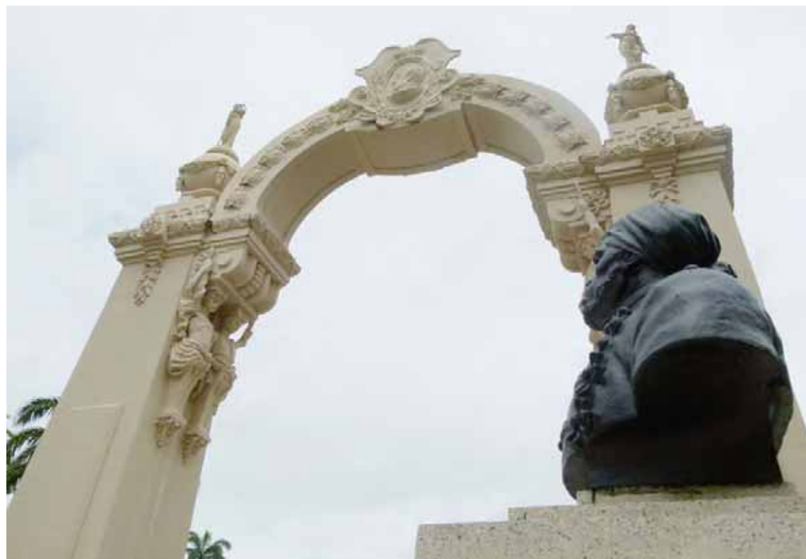
Busto del Negro Primero en el campo de Carabobo

En el bajo relieve del monumento a Carabobo, se muestra en primer plano el cuerpo de Pedro Camejo caído del caballo,