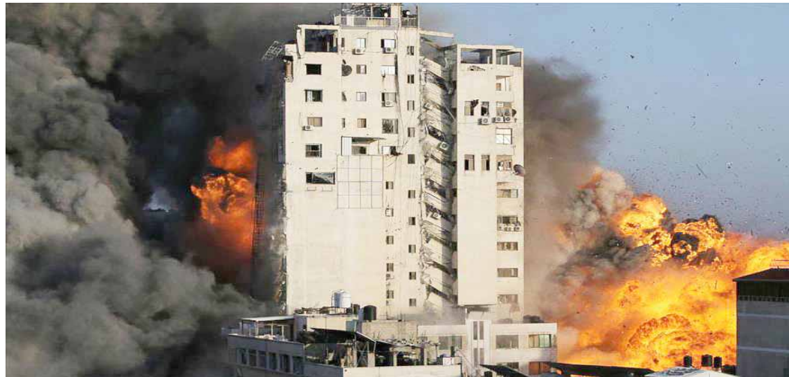
La escalada de violencia ha dejado más de 200 palestinos muertos y edificaciones destruidas

Con 24 votos a favor, 14 abstenciones y nueve en contra, el Consejo de Derechos Humanos de las Naciones Unidas aprobaron una resolución contra Israel y la creación de una comisión que investigue la escalada de violencia contra la Franja de Gaza que ha dejado más de 200 palestinos muertos y edificaciones destruidas