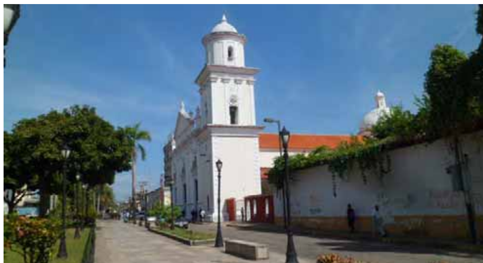
Catedral de San Carlos

mos” o a los “heridos en la serie de combates que habrán de presentar al enemigo”.