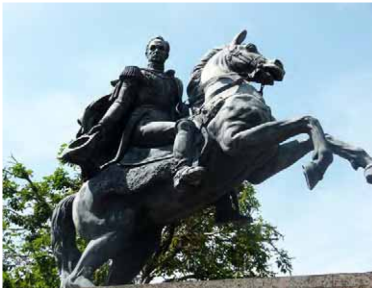
Plaza Bolívar de San Carlos