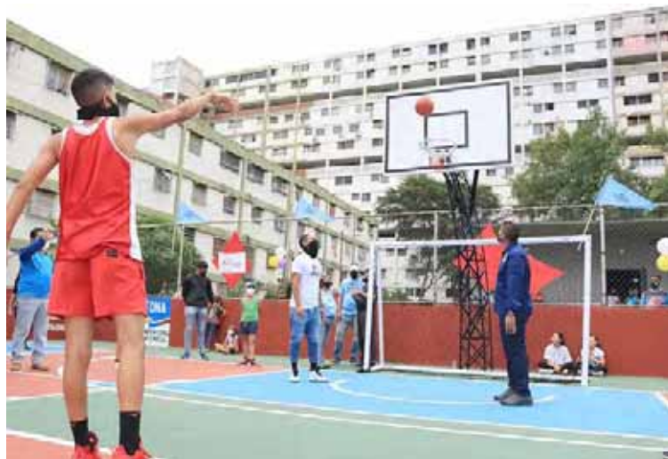
Las comunidades caraqueñas poco a poco tienen aptas sus canchas

El Fona junto al Movimiento por la Paz y la Vida rehabilitaron estos espacios que pueden ser disfrutados por niños, niñas, jóvenes y comunidad general en Bloque 2 de Propatria y Nuevo Horizonte, parroquia Sucre; sector Tinajitas, parroquia La Pastora; Bloque 22, Bloque 17 y Bloque 39, parroquia 23 de Enero; sector López Méndez, parroquia San Bernardino; Escuela Edel y Parque Maracaibo, parroquia El Recreo; sector La Charneca y sector Mamón Helicoide, parroquia San Agustín y las cuatros del IMCA de San Martín, parroquia San Juan.