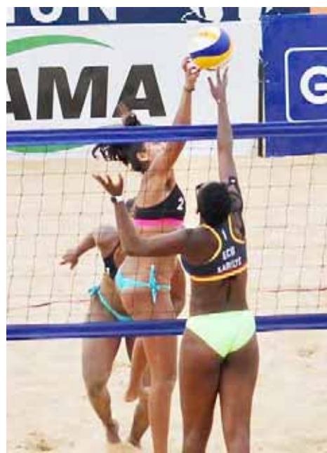
La dupla de chamas estuvo muy acoplada