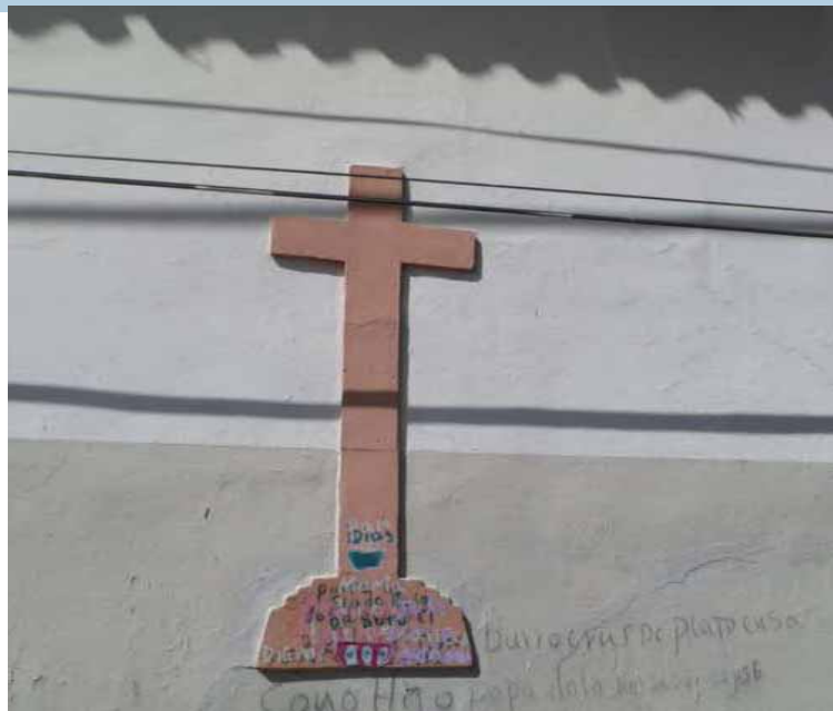
La cruz en el paredón de fusilamiento

Indica Echenique que en la hoja de vida de la esposa de “Negro Primero” se anotan varios hechos resalantes, tales como el haber actuado como “tropera”, cocinando para los soldados, lavando ropa, cargando armas y pertrechos para las huestes de Páez, y, también, haber ayudado en el cuidado de heridos y parturientas en el famoso sitio conocido como “La Mata del Paridero” (en el decir de un escritor apureño contemporáneo), en los méda-