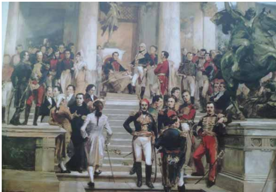
El Panteón de los héroes, obra de Arturo Michelena

En San Carlos, según versiones locales, Bolívar se hospedó en “La Blanquera”, un viejo caserón colonial ubicado al oeste de la ciudad, no muy lejos del centro. Allí habría delineado lo que sería la ofensiva final contra el ejército realista. Sin embargo, otros historiadores han negado que Bolívar se haya