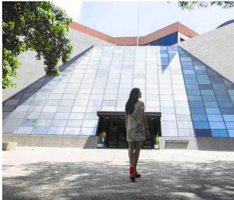
La participación es libre y gratuita