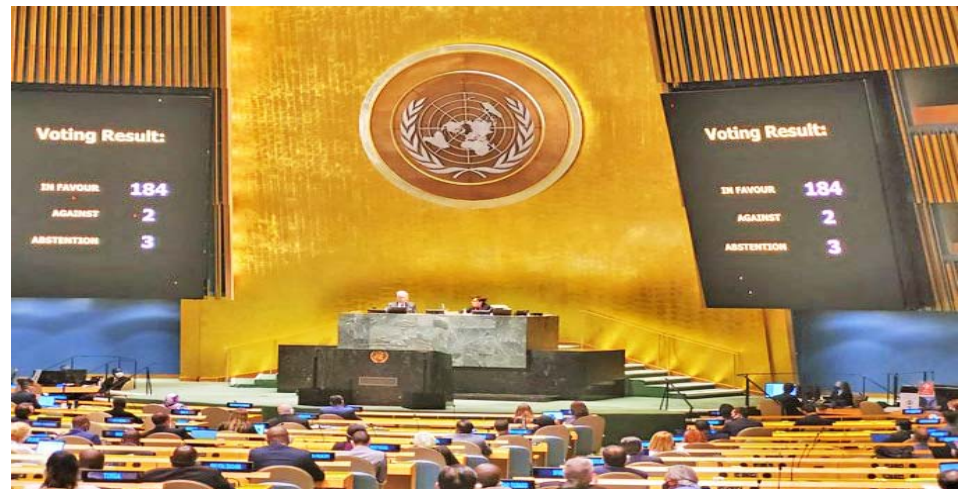
Desde 1992 la ONU respalda la petición de la comunidad internacional de poner fin al embargo

Como una “gran victoria del pueblo cubano, de la justicia y de la verdad”, calificó el canciller de Cuba, Bruno Rodríguez esta votación alcanzada en la ONU.