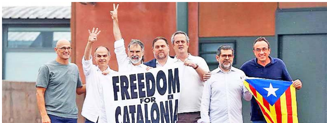
Los líderes del proceso independentista de Cataluña salieron en libertad ayer