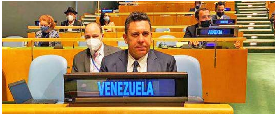
Venezuela apoyó la resolución contra la política hostil de EEUU hacia Cuba

Durante la sesión programada para debatir el bloqueo económico aplicado por el país imperial a Cuba, el diplomático venezolano argumentó que la medida es un crimen de lesa humanidad que niega el derecho a la soberanía nacional, así como la diversidad política, económica y cultural del planeta