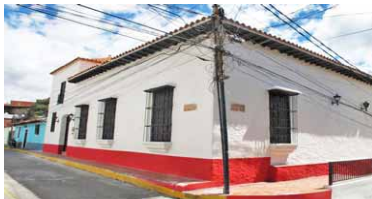
El Museo Bárbaro Rivas es punto de encuentro cultural

En el contexto de la celebración de los 400 años de la fundación del pueblo Petare (el 17 de febrero de 1621), el Museo de Arte Popular Bárbaro Rivas, institución adscrita a la Fundación José Ángel Lamas de la Alcaldía del Municipio Sucre, ha preparado la exposición Expresiones de Diálogo. La muestra de 23 Artistas Petareños será inaugurada este miércoles 9 de junio, desde las once de la mañana, observando siempre las medidas de bioseguridad.