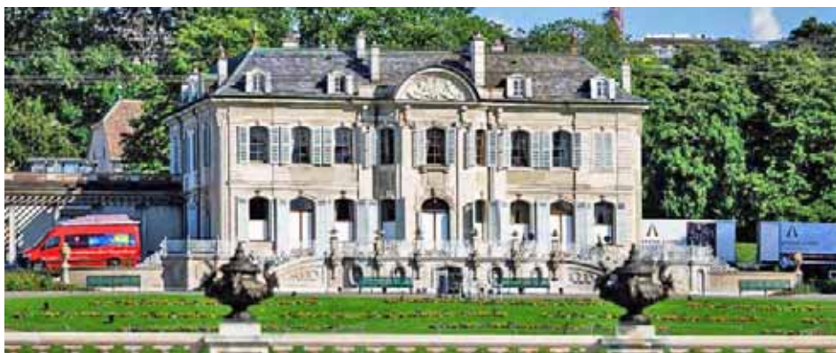
Villa La Grange, será la sede de la cumbre

T/ Redacción CO-Telesur