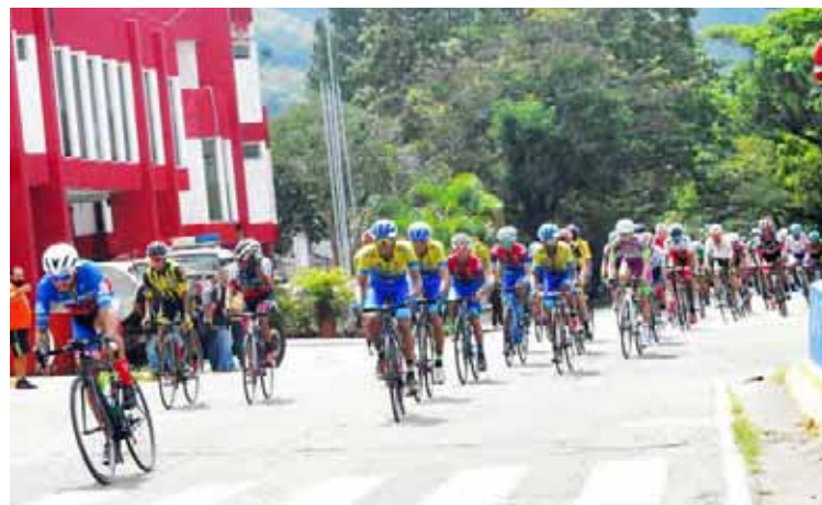
Llueva, truene o relampaguee va la justa