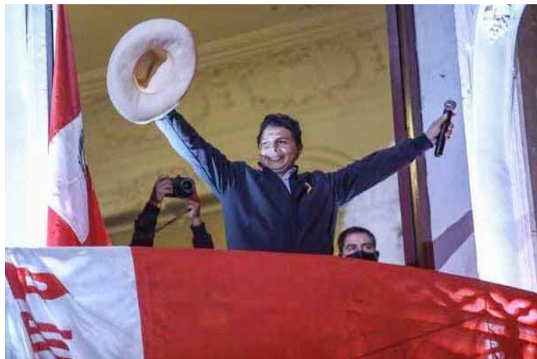
Fue determinante el voto de la población rural para el triunfo de Pedro Castillo

Con el 50.12 por ciento de los votos instó a sus contrincantes a aceptar los resultados electorales y no sumergir al país en un mar de incertidumbre