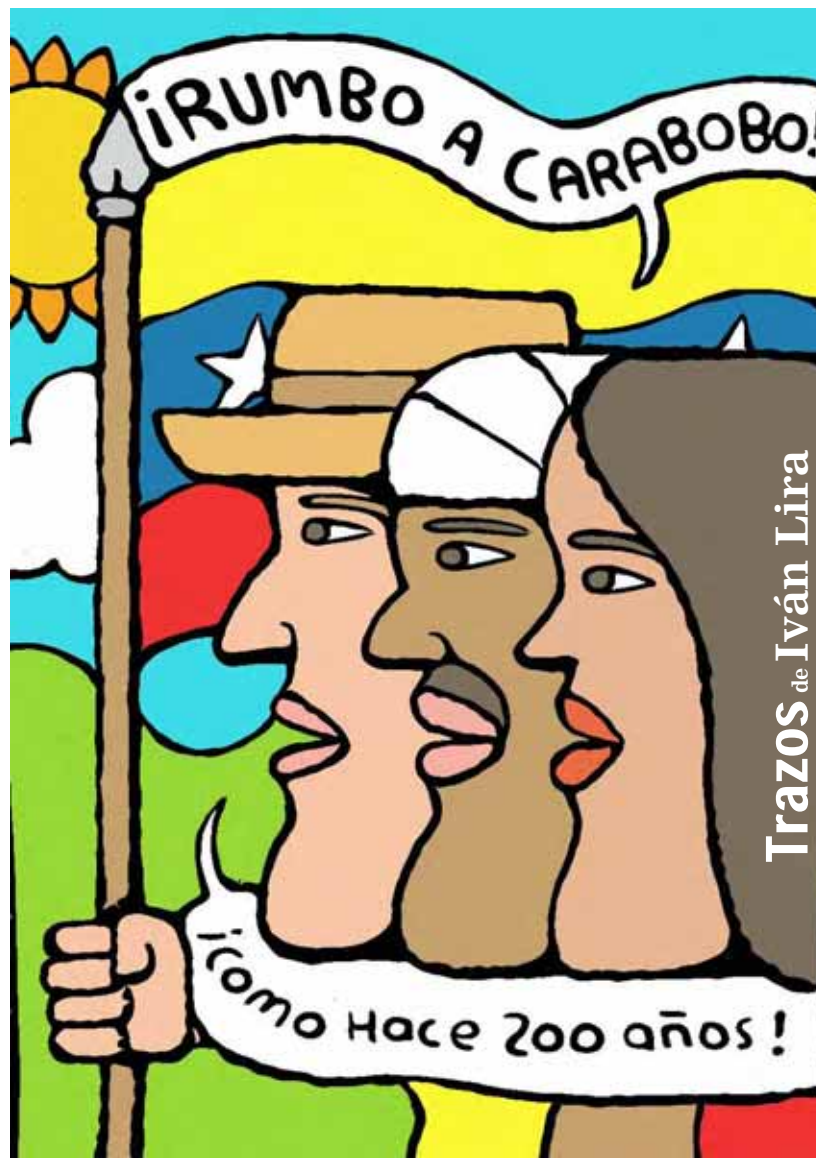
Trazos de Iván Lira