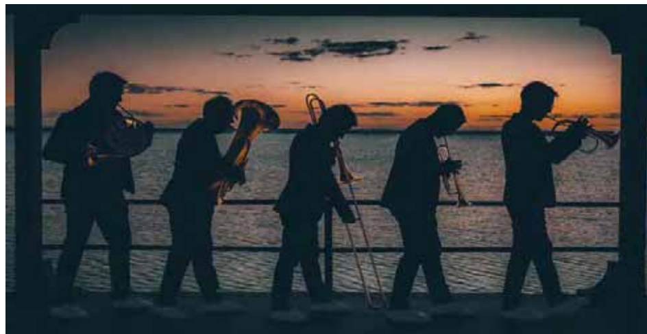
La versión está inspirada en una interpretación de Los Sinvergüenzas

También se incorporan al video, para acompañar los créditos, unas tomas adicionales de los integrantes del quinteto