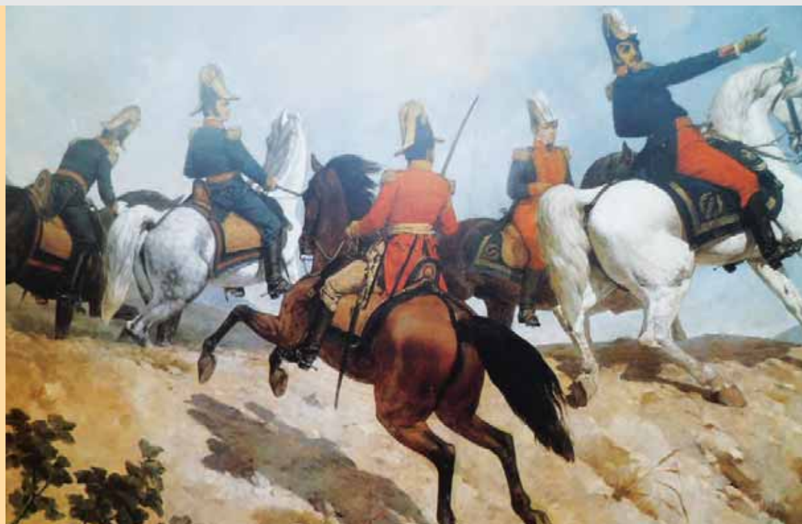
Bolívar y su estado mayor, detalle ,pintura de Martín Tovar y Tovar