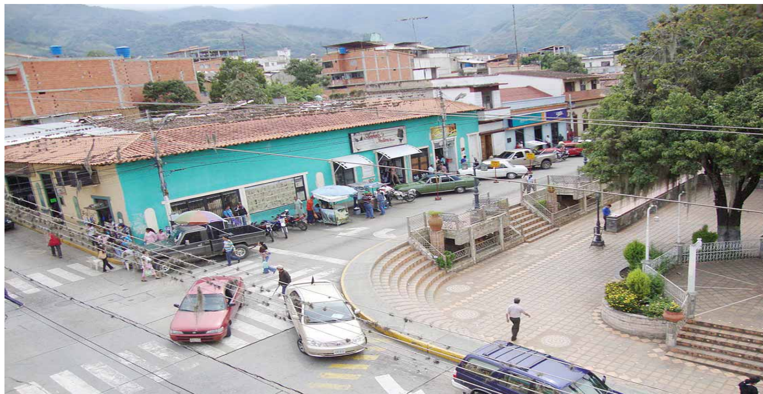
Centro de Boconó