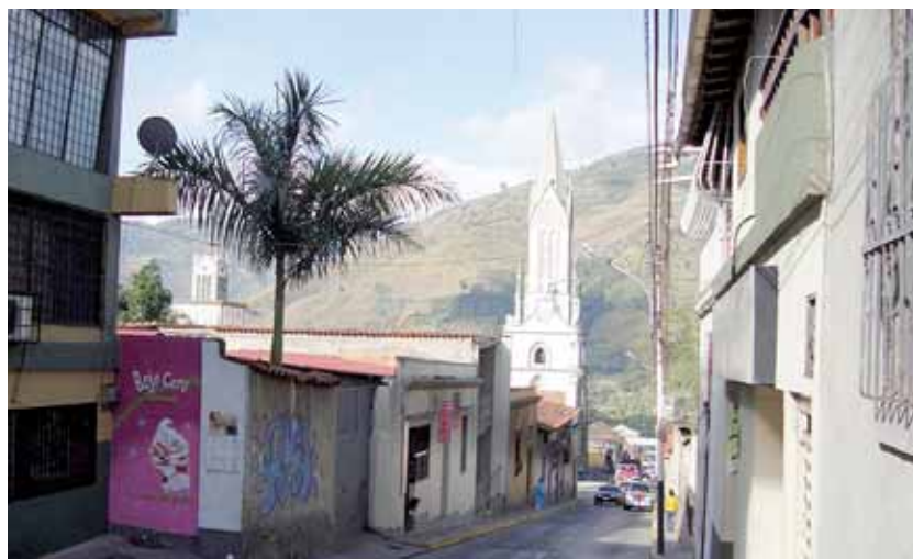
Iglesia de San Alejo