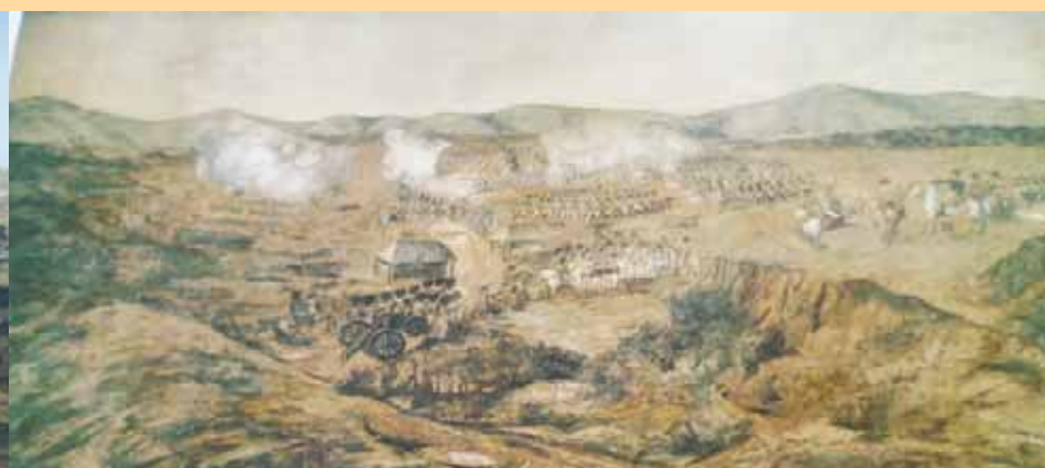
Pintura de Pedro Castillo en una de las paredes de la Casa Páez, en Valencia