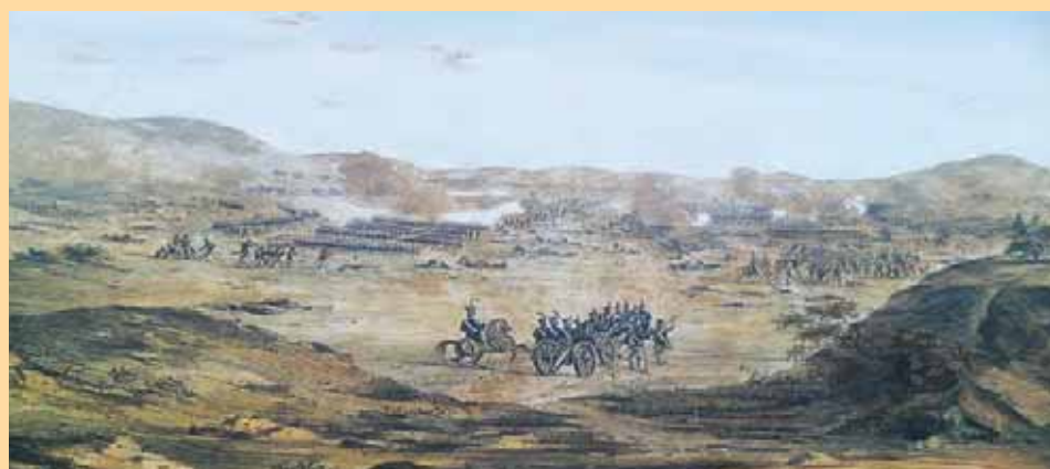
Litografía sobre papel hecha por Ambrose Louis Garneray