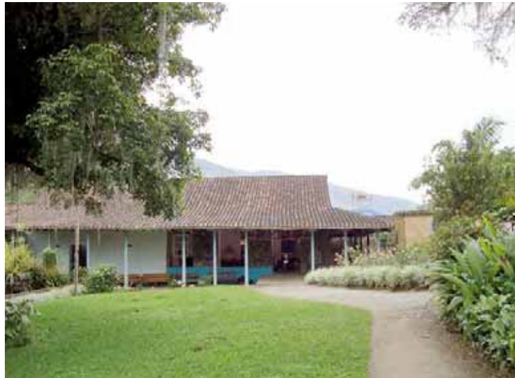
Museo de la ciudad

Dice el General Daniel Florencio O'leary en sus memorias: "deseando el Libertador inspeccionar él mismo la demarcación de los límites del armisticio en la jurisdicción de ambos contendores en la provincia de Barinas y visitarlos los acantonamientos del ejército, durante la tregua, salió de Trujillo por la vía de Niquitao a este fin". En Boconó y sus pueblos se quedaron los batallones, era buen clima y buen trato y no habían peligros de las llamadas fiebres de las tierras calientes que transmitían los mosquitos y que tanto diezmaron las tropas en conflicto; durante los meses siguientes: enero, febrero y marzo de 1821 fueron muchos los acontecimientos; en Niquitao se estableció la maestranza