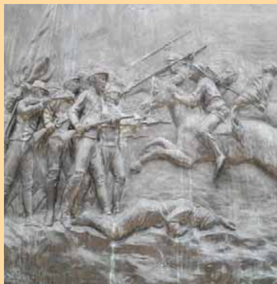
Carga de lanceros, Monolito de Valencia