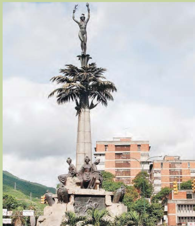
Estatua de la India, en la redoma de El Paraíso