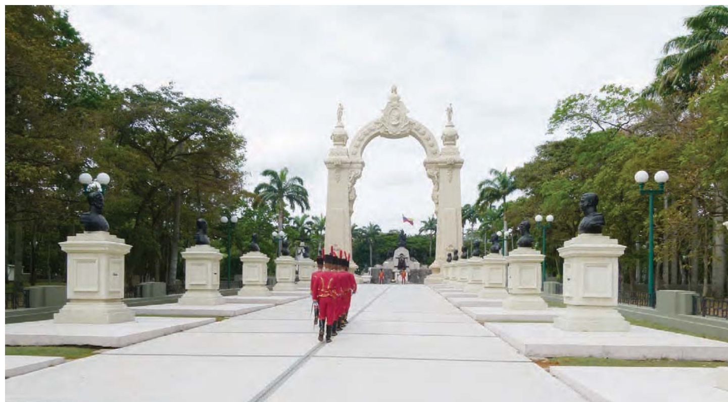
Campo de Carabobo

En cuanto al silencio de la derecha, ya sea histórica, política, económica o religiosa, que se observa actualmente, en re-