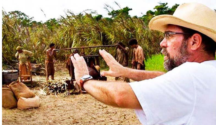
Con distintas manifestaciones artísticas se recuerda nuestra independencia