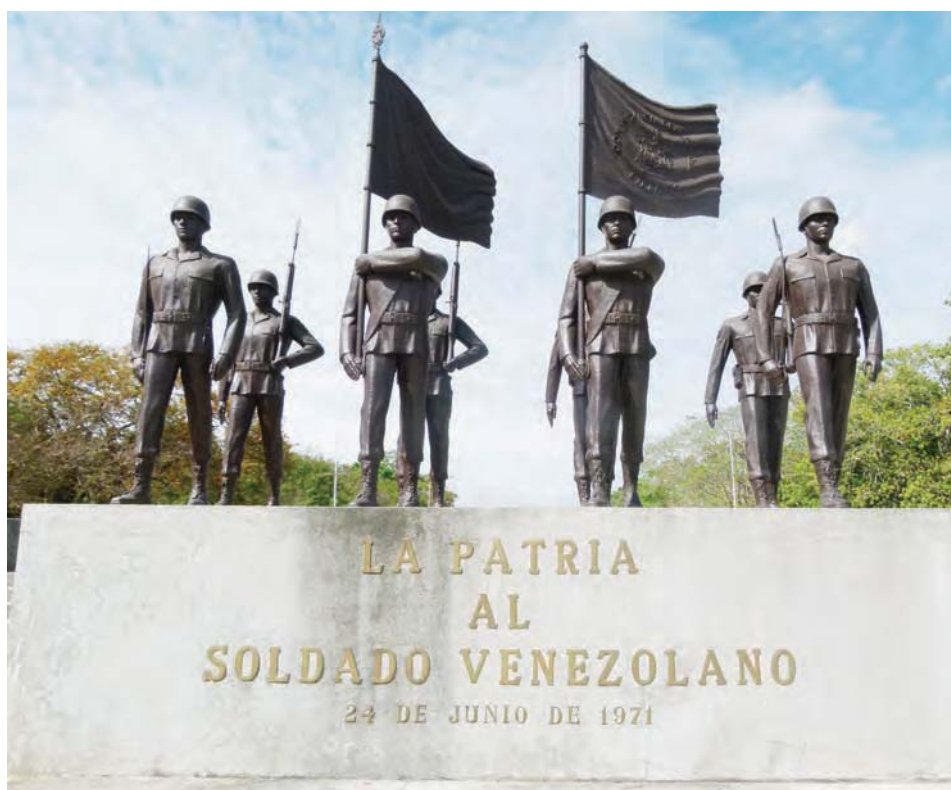
Monumento homenaje al soldado venezolano, Campo de Carabobo