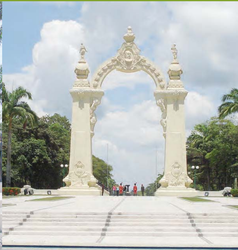
Arco de triunfo