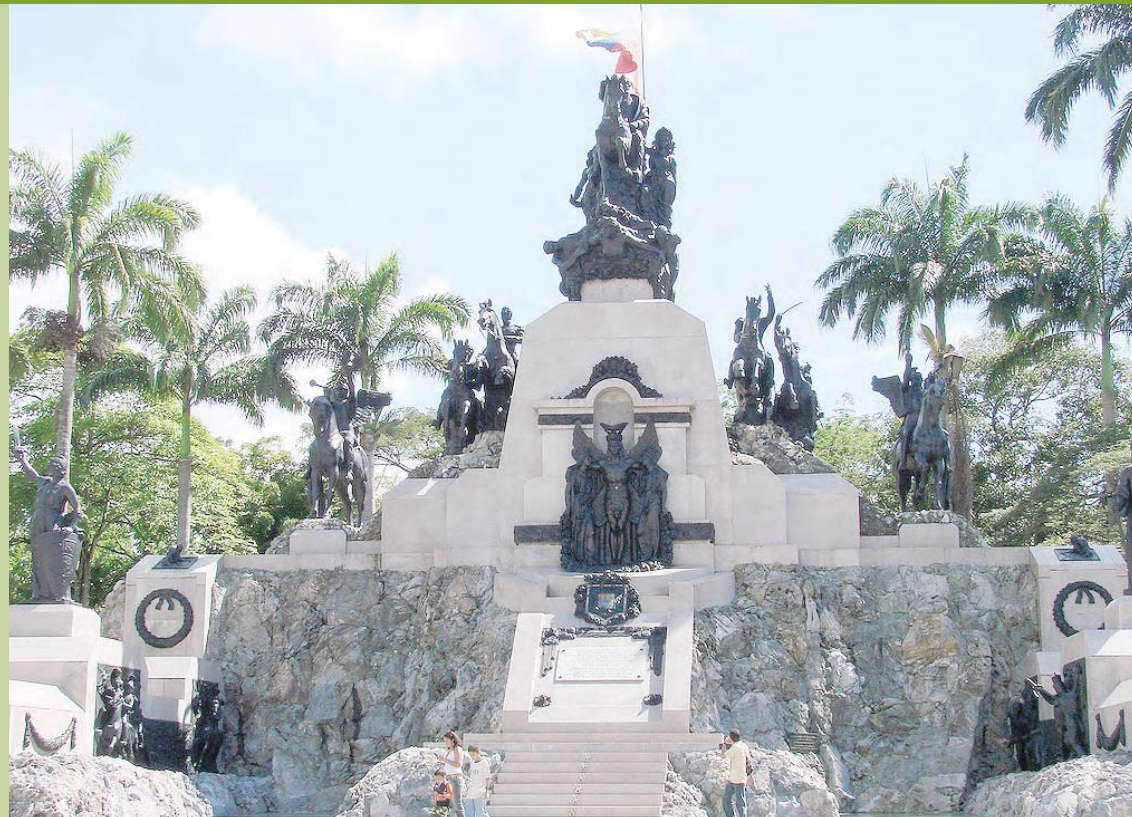
El Altar de la Patria, en el Campo de Carabobo