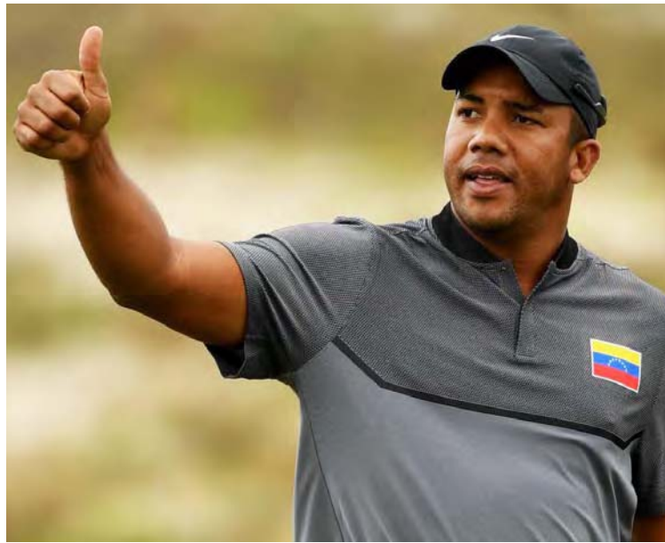
Vegas es oriundo de Monagas

“Tengo que descansar un poco, para poder dar lo mejor en los play offs y luego en los Olímpicos que es lo que viene en mi agenda”, agregó el venezolano.