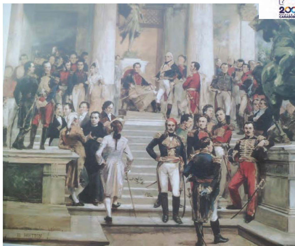
Panteón de los héroes, pintura de Arturo Michelena

también que es la campaña de liberación de Venezuela y el nacimiento político de la República de Colombia, porque el parte del 25 de junio de 1821, firmado en Valencia por Bolívar, no menciona a Venezuela. Lo que sí es cierto es que así como la Gran Colombia no existió sino como un recurso metodológico conceptual de los historiadores para distinguir una de otra, es decir la de Bolívar de 1819 fundada por Bolívar por ley fundamental y la de 1860 cuando el Nuevo Reino de Nueva Granada adopta el nombre de Colombia, es un recurso tardío, a posterior de la experiencia. Sería bueno rastrear desde cuando se habla en términos de campaña de Carabobo. De igual manera, cuando revisas algunos autores de la Campaña Admirable te das cuenta que era la Campaña de Occidente liderada por Simón Bolívar, de Cúcuta a Caracas, y la Campaña de Oriente, liderada por Santiago Mariño, de Chacachacare a Barcelona, Carúpano, Irapa, pero el calificativo es tardío. Así mismo el nombre de Campaña de Carabobo. Dos datos curiosos es que hubo dos batallas de Carabobo, una, la primera, el 28 de mayo de 1814, en las sabanas de Carabobo. Allí Bolívar y Mariño hicieron morder el polvo de la derrota a las fuerzas del capital general Juan Manuel de Cagigal.