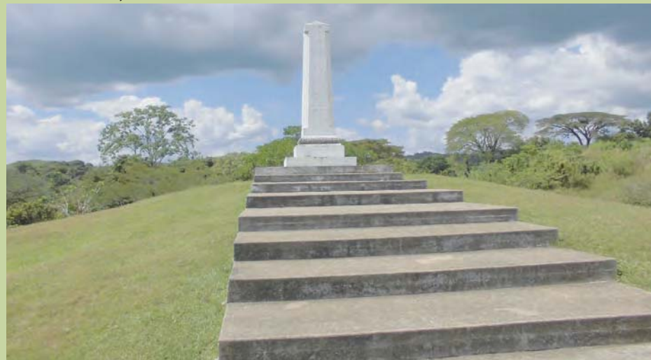
Monolito donde murió el Negro Primero