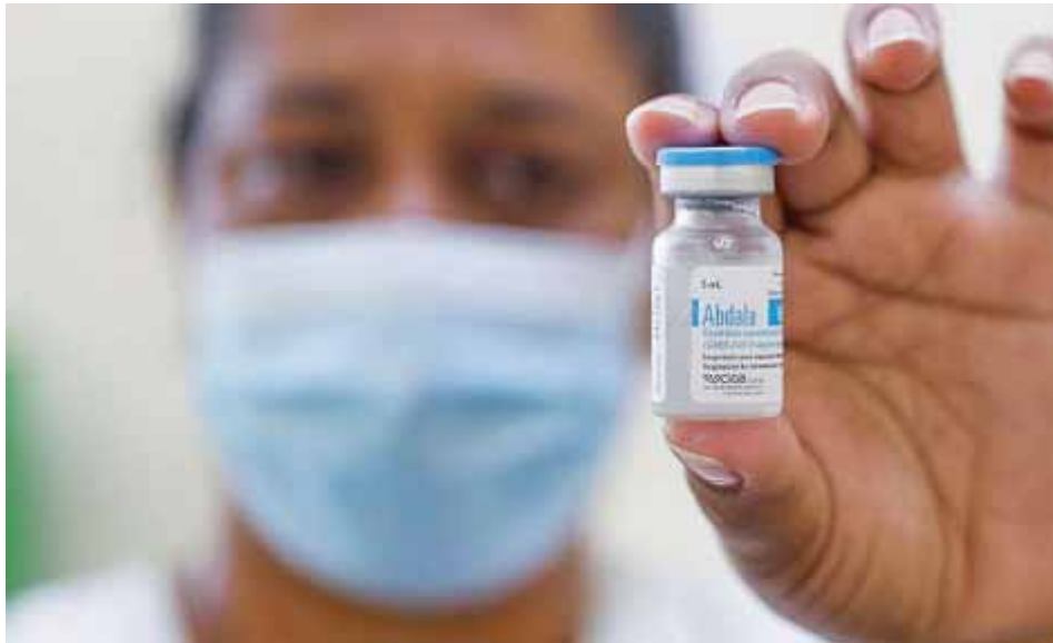
Una profesional de la salud muestra una dosis de la vacuna cubana Abdala