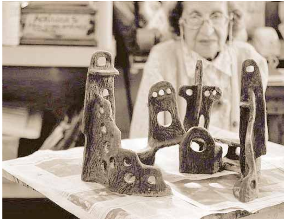
Gran lugar del alba es una pieza muy atractiva para los niños.

Una versión pequeña de la obra que Delozanne había creado en los años 80 del siglo pasado, cuando su línea creativa ya estaba profundamente influencia-