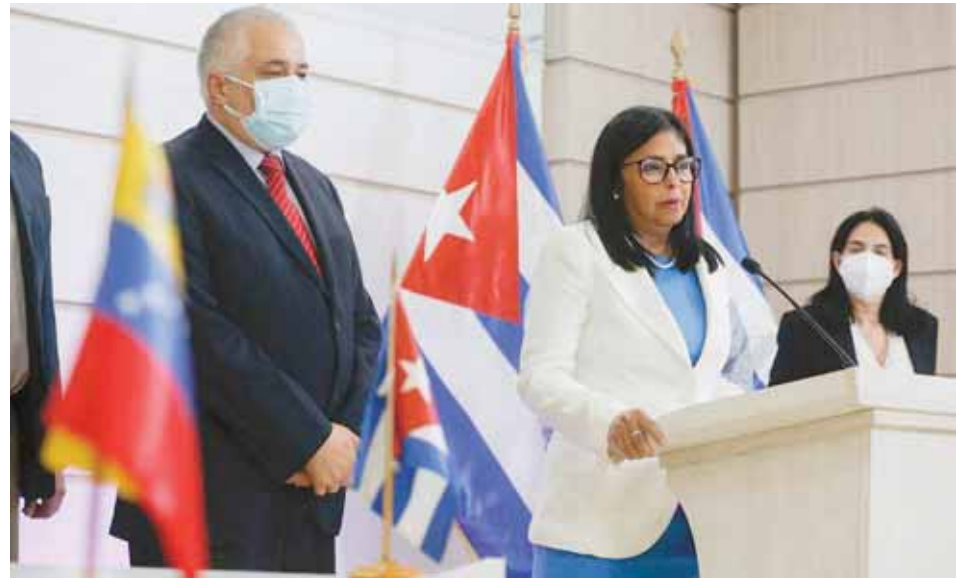
Vicepresidenta Delcy Rodríguez acompañada del embajador de Cuba, Dagoberto Rodríguez, anuncia la llegada del primer lote de vacunas Abdala

La imperio que el éxito de la campaña de vacunación en Venezuela, con una extensión al resto de la región de América Latina y el Caribe mediante la ALBA_TCP exponga las fallas del sistema privado que deja en manos de las corporaciones las decisiones para abordar la crisis sanitaria que produjo la pandemia