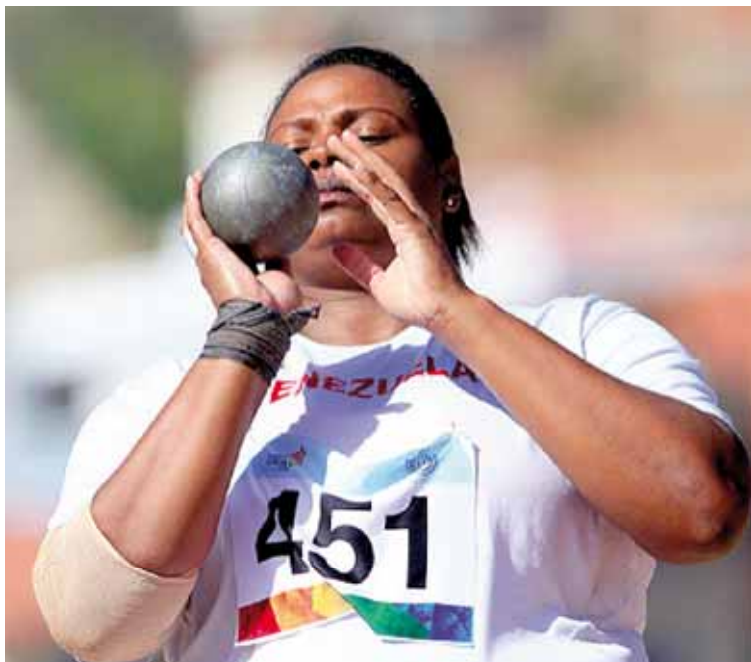
A los 36 años se va para Japón