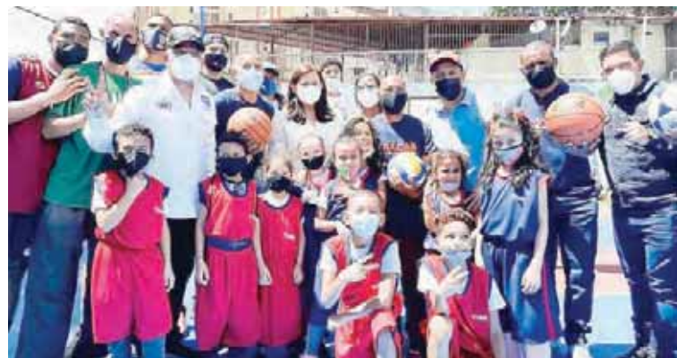
La población caraqueña cuenta con canchas repotenciadas.

T/ Redacción CO