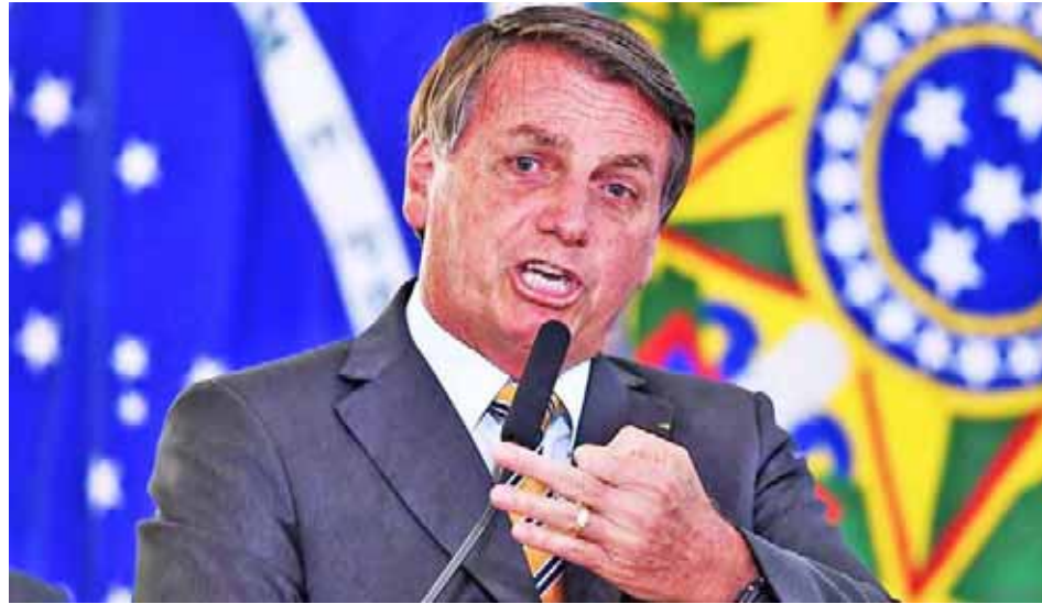
Irregularidades en la compra de la vacuna sustentan la solicitud

T/ Redacción CO- Agencia RT