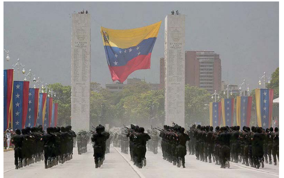
Todo está listo para el desfile militar del 5 de julio

Aseguró el vicepresidente sectorial Vladimir Padrino López