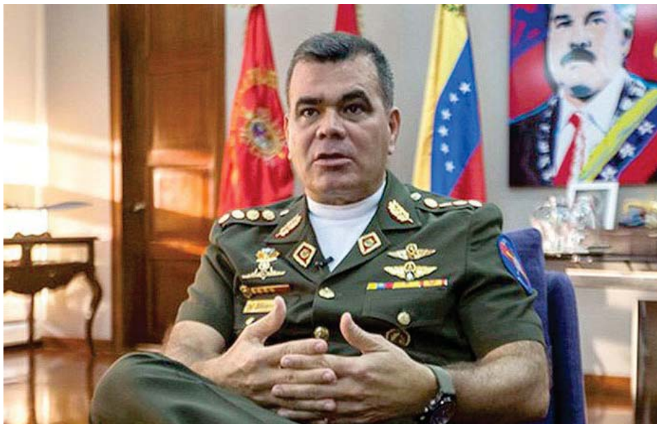
Vladimir Padrino López