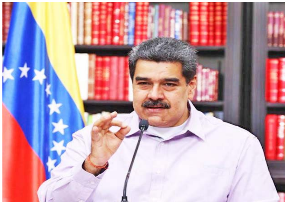
Maduro fue enfático en su justo reclamo contra el COVAX

Sin embargo, en comparación con el promedio de 25 casos por cada 100.000 habitantes, los estados con mayor tasa de contagio acumulado son La Guaira, con 104 pacientes; Yaracuy y Cojedes, con 83 cada uno; Nueva Esparta (56), Barinas (48), Monagas (46), Apure (40), y Mérida (34).