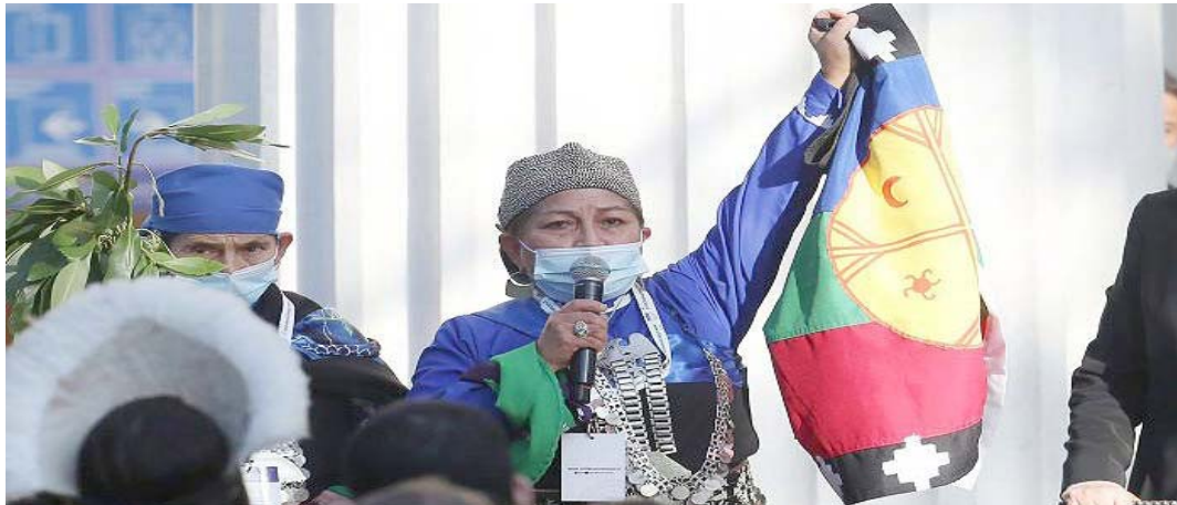
Los constituyentes tendrán entre nueve y doce meses para escribir el nuevo texto constitucional