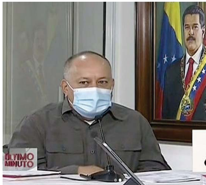
Cabello y el presidente Maduro leyeron cifras del proceso interno del PSUV