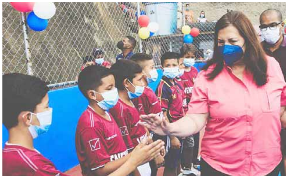
La almiranta Meléndez compartió con la muchachada

Recordó que estos ascensos son partes de los 12.341 funcionarios ascendidos al grado inmediato superior, de los cuales 12.160 corresponden a ascensos ordinarios y 181 a ascensos extraordinarios; aparte que 5.335 recibieron acreditación por experiencia como Técnico Superior Universitario y se graduaron 4.193 funcionarios del curso básico del Servicio