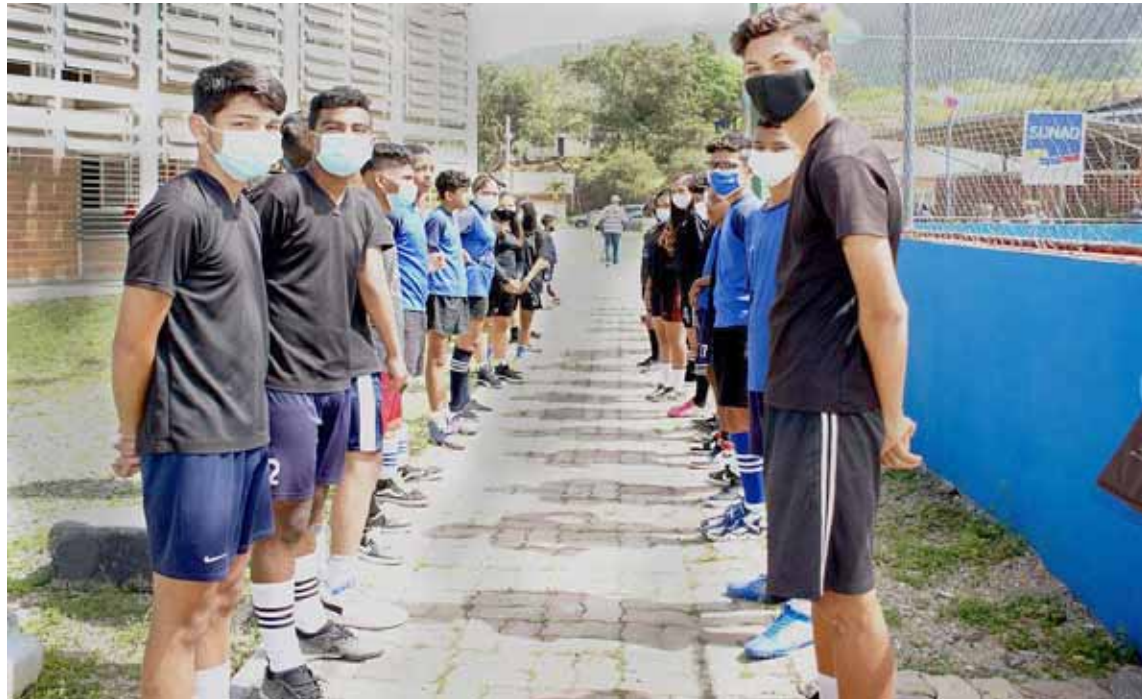
Los jóvenes tienen un espacio para practicar varias disciplinas

Recordó el multipropósito que se logra alcanzar cuando se recupera este tipo de canchas, que no solo son para actividades deportivas y culturales: “Hay que ir más allá del cemento, la pintura y las cabilas, es importante articular con el Punto y Círculo de los sectores en aras de reforzar las