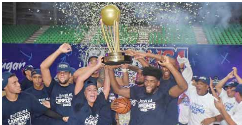
Spartans quiere llevarse otro cetro a su casa

“Queremos agradecer a las Federaciones Nacionales, sus Ligas y Clubes por el gran esfuerzo en la realización de la XXV edición de la Liga Sudamericana de Clubes. Somos conscientes que los