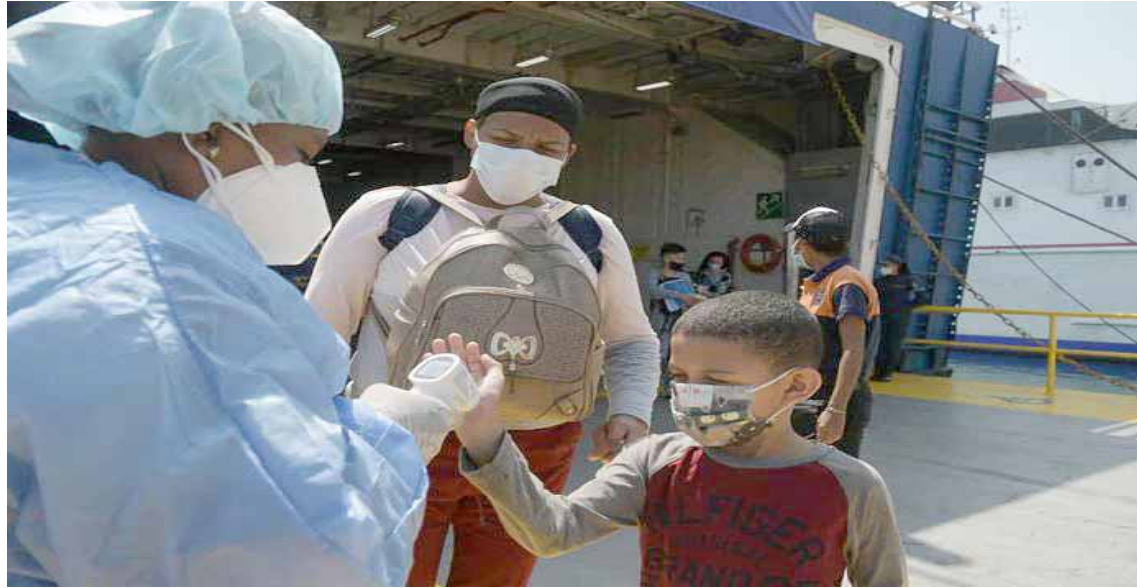
El Plan Vuelta a la Patria es el puente humanitario con mayor alcance del mundo

En el operativo participó una delegación enviada por el Gobierno venezolano, compuesta por médicos, funcionarios del Comando Nacional Antidrogas, la Guardia del Pueblo, la Policía Nacional Bolivariana y bomberos