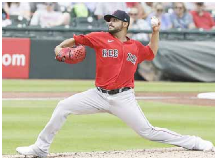
El siniestro poco a poco se afianza como abridor

El relevista de 25 años se encontraba en lista de lesionados de ligas menores, tras lastimarse el costado derecho el 18 de mayo, en un juego contra los Bisontes