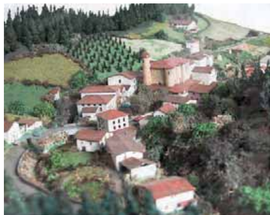
Maqueta de la Puebla de Bolívar, Vizcaya, España