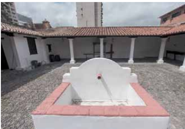
Patio de la Cuadra

- Hay quienes dicen que es un pensamiento, otros que es una doctrina, otros que es una ideología. Por supuesto, como toda ideología, doctrina o pensamiento, tiene elementos susceptibles de periclitarse, de vencerse en el tiempo, pero el bolivarianismo que nosotros defendemos no se queda solamente en el contenido, sino en la forma. De Bolívar imitamos no solamente su concepto político, sino su empeño, su empuje, su espiritualidad, su voluntad de ser libres, y creo que en ese sentido, el bolivarianismo tiene dos vigencias, uno en cuanto a lo que dice, y otro en cuanto al empeño en lo físico y espiritual por ser libre, de tal manera que para nosotros también se transmuta en una doctrina, pero sobre todo es un ejemplo a seguir, un referente espiritual necesario para decirnos siempre que nuestra vocación es ser dignos, soberanos e independientes.