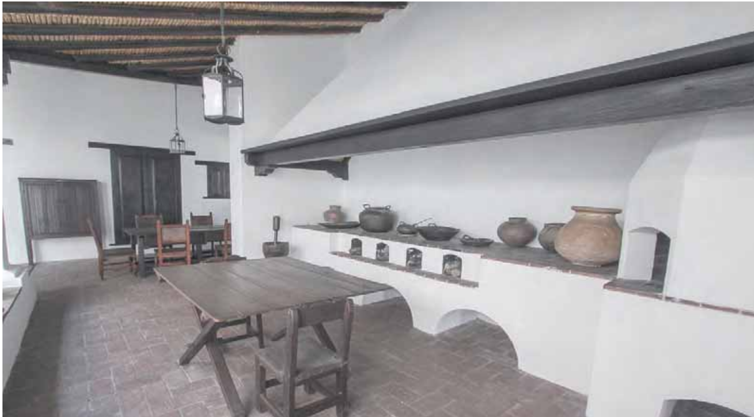
La cocina de la Cuadra Bolívar