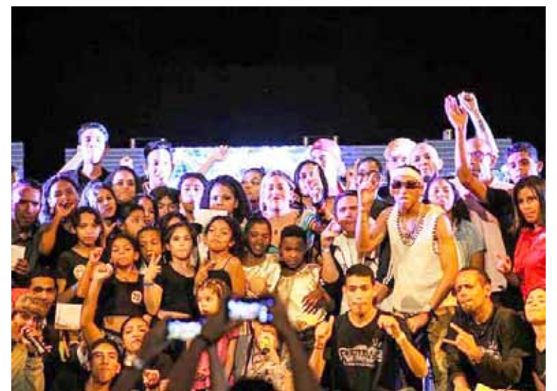
El festival de talento emergente Portavoz será parte del programa