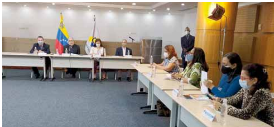
Las personas con discapacidad podrán ejercer su derecho al voto mediante la figura del acompañante

Una comisión especial permanente creó el Consejo Nacional Electoral (CNE), que se encargará de velar por las garantías, así como la adecuación del sistema electoral para atender las necesidades y requerimientos de las personas con discapacidad en el ejercicio pleno de sus derechos políticos, entre ellos, el voto.