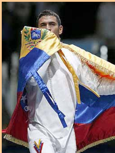
A pesar de las adversidades por la pandemia, Limardo se concentrará

“Creo que en este punto, no sólo en mi caso sino en el de todos los atletas que van a representar a Venezuela en estos Juegos Olímpicos, lo más importante es no dejar que las cosas que están pasando, las restricciones, nos afecten. Esperamos que podamos darle la mayor cantidad de medallas al país”, argumentó el medallista de Londres 2012