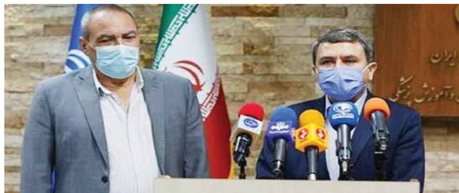
Rueda de prensa de los representantes del instituto cubano Finlay y el Instituto Pasteur de Irán

"El Instituto Finlay tiene mucha experiencia en la producción de vacunas conjugadas para niños, por lo que decidimos utilizar esta plataforma para construir una vacuna contra la Covid-19", ha precisado.