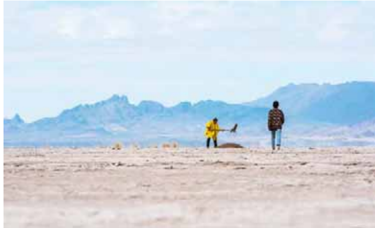
El autor vuelve sobre el tema de la paternidad latinoamericana