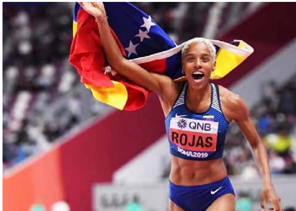
La caraqueña quiere pasear la bandera tricolor por el estadio olímpico

"Estoy muy contenta con todo el apoyo que estoy recibiendo de parte de todos, incluyo a todo el mundo y todos los mensajes que me llegan. Me ponen muy feliz y me motivan. Estoy contentísima de sentir esta adrenalina y de compartir con